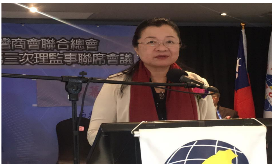
非洲臺灣商會聯合總會第23屆第3次理監事聯席會暨會員大會致詞