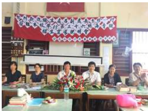
圖 5. 眉苗佛經學校宣導說明會

長、段董事長及校內師長們共計約 20 人互相交流，約 15:30 結束參訪搭車前往曼德勒。下午 17:30 抵達曼德勒 Full house 餐飲店用餐，此間店為海青班第 25 及 26 期畢業學生（數位媒體設計、烘焙暨餐旅管理專業）畢業後返國開設，約於晚間 19:30 抵達飯店結束一天的行程。