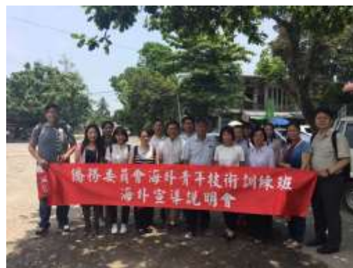
圖 2. 海青班宣導團與當地教師進行交流