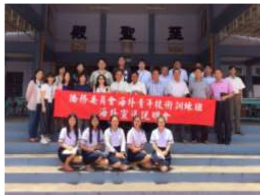
圖 13. 宣導團參訪明德中學