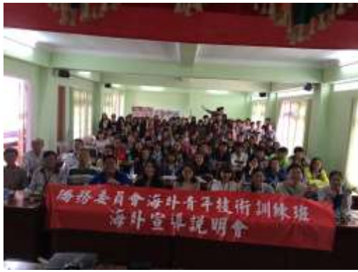
圖 8. 東枝華校宣導說明會