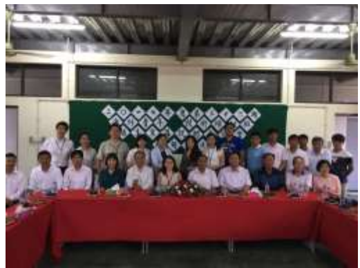
圖 11. 臘戍地區僑校師長座談會