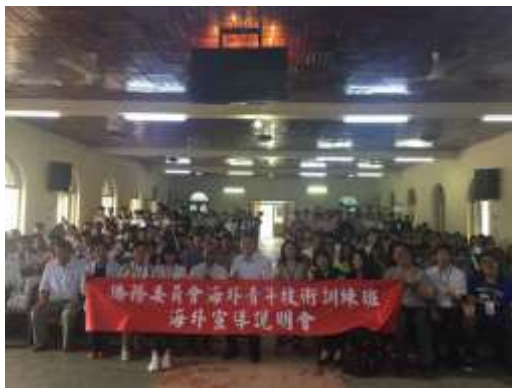
圖 10. 臘戍聖光中學宣導說明會