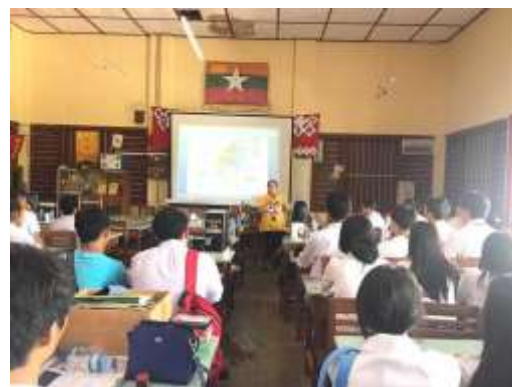
圖 6. 海青班畢業校友經驗分享