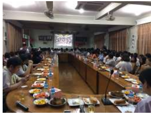
圖 4. 海青班秋季班課程特色介紹