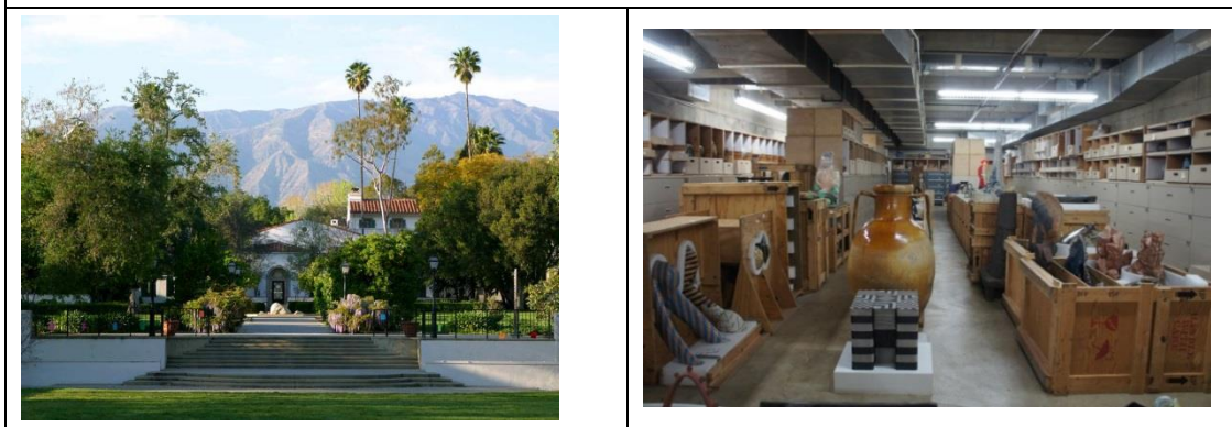
Scripps collage collection room

Scripps College，是每年度舉辦國際陶瓷展覽 Scripps College's Ceramic Annual Exhibition 的主辦學校，成立於 1926 年，在此歷史悠久美麗的校園內，有一個設備完善且專業的收藏館，主要收藏著來自於世界各地和二戰之後美國極為重要影響力的藝術家的作品，收藏的質與量令人佩服，其收藏量多達 7500 多件，年代則跨越 3000 年，這些收藏品成為教學觀摩的最佳教材及範例。藉由此次的參訪讓學生能親身體會和大師作品直接對話而受到啟發，讓原本只能透過書本或是期刊上看到的作品，能在此做近距離地觀看欣賞，能清楚的觀察到作品的表面質感和其細節處理的部分，更明確、貼近的與歷史中重要藝術家作品接觸，並經由收藏中心負責人清晰解說，更清楚了解當代陶瓷從日本民藝運動到近代美國的發展脈絡。