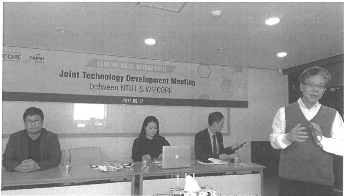
圖一: WIZCORE 與 Taipei Tech 聯合技術發展會議