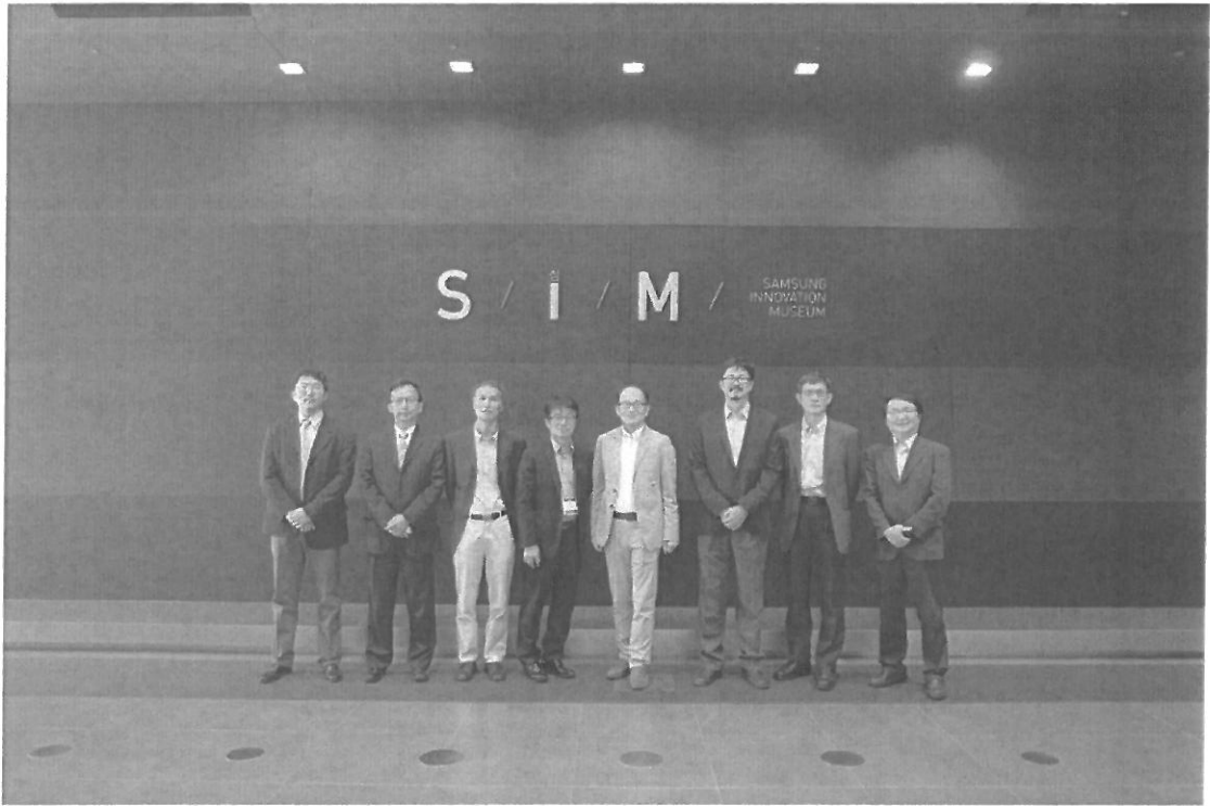
圖十三: 北科代表團於 Samsung Innovation Museum 前合影留念