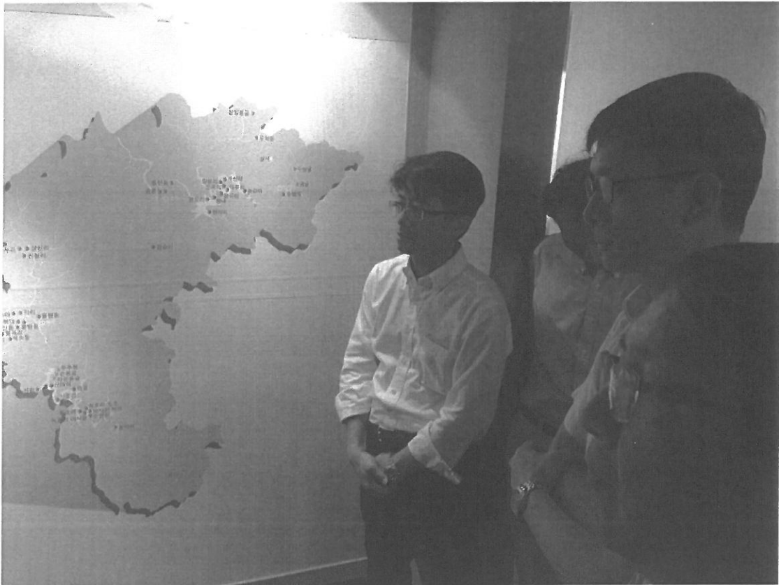
圖八: 參觀位於忠北大學校園內之史前博物館