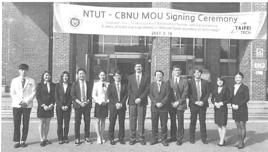
圖五: 北科大學術參訪團於忠北大學工學院門前留影