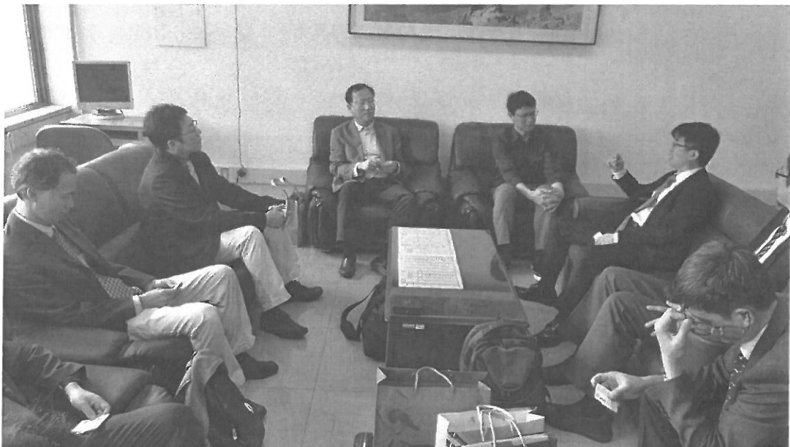
圖二: 北科大學術參訪團與 KAIST 工業與系統工程教授們會晤