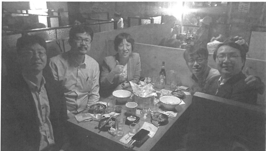
圖十六：代表團與中央大學朴教授進行會晤討論未來研究合作方向