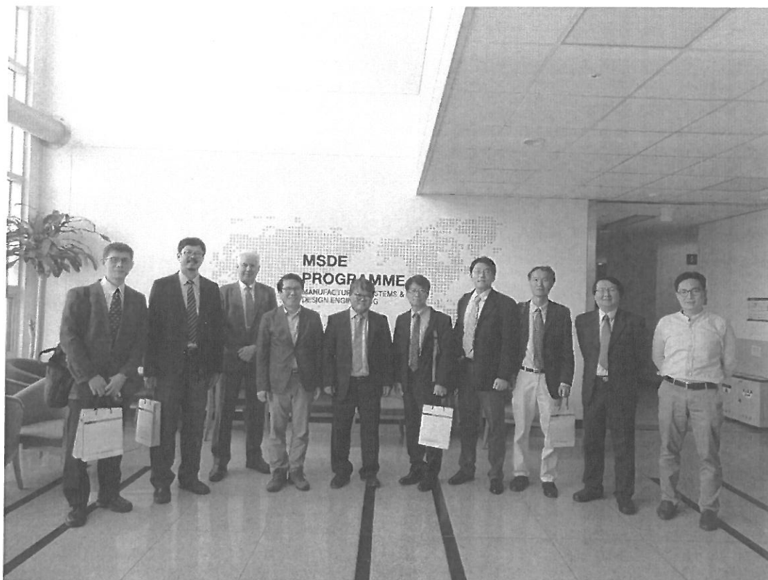
圖九: 北科大學術訪問團於 MSDE (Seoul Tech) 系館前合影