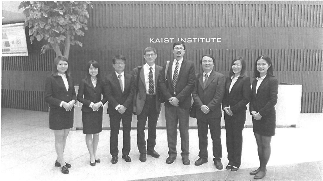
圖三：北科大參訪團於 KAIST 科技研發大樓