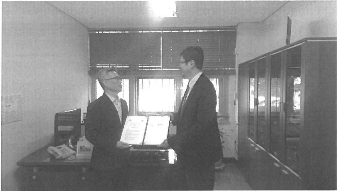
圖七: 北科大與忠北大學簽署交換學生 MOU