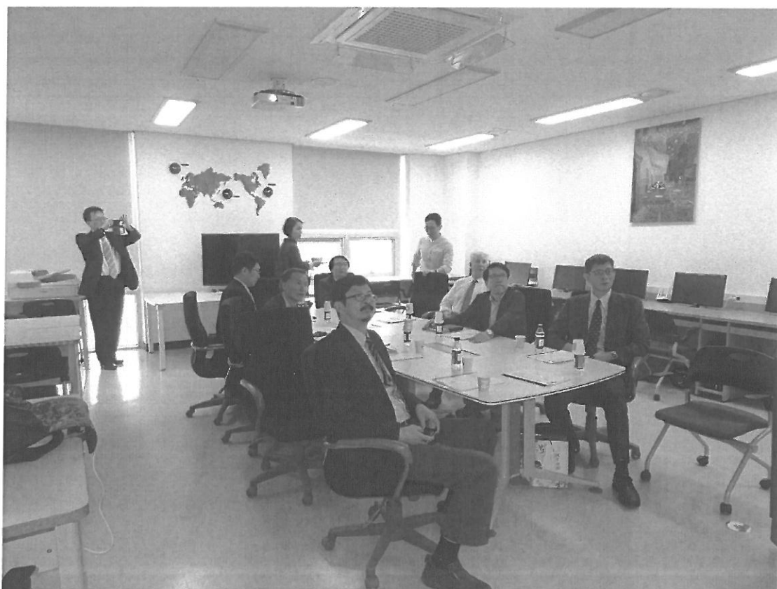
圖十: 北科代表團於 MSDE (Seoul Tech) 聽取簡報