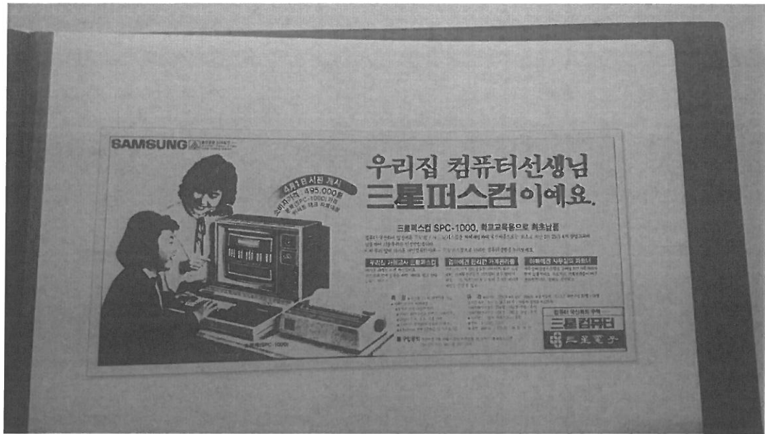
圖十五：三星電子映像管電視機發展史