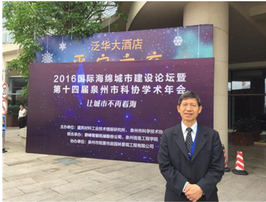
圖 3：在泉州泛華大酒店國際海綿城市建設論壇開幕會場。

本人專題演講之議題為”綠色水泥材料應用於海綿城市設施建設之可行性評估”，內容應用於海綿城市建設之工程材料為波特蘭水泥(Portland cement)混凝土，然而波特蘭水泥生產製造過程中產生巨大之排碳量，造成環境破壞。另一方面，高爐石粉產量隨著每年鋼鐵產品生產而增加，亦需有完善再利用之管道避免環境二次汙染。