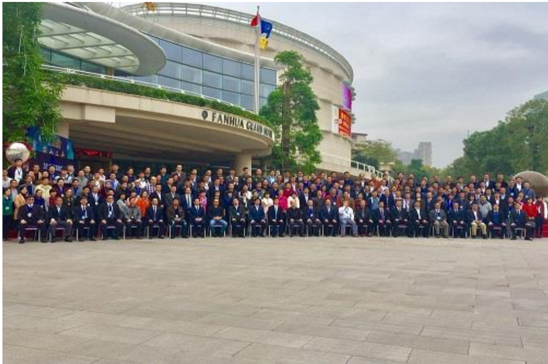
圖 1：參加 2016 國際海绵城市建設論壇大合照。

在 2016 年 12 月 25 日上午的開幕式並進行“第十四屆泉州市科協學術年會的頒獎活動”，19 位青年科技工作者獲得“第六屆泉州青年科技獎”，10 位基層科技工作者獲得“第四屆文創科技創新獎”。會議於 26 日結束，取得圓滿成功。會議推動中國海绵城市的建設與發展，搭起國內外海绵城市投資、建設企業的合作交流平台。