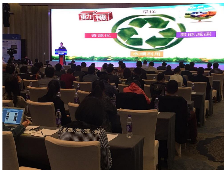
圖 4：專題演講之現況。

有機會至廣州碧水灣溫泉渡假村參訪，溫泉渡假村的規劃、設施、規模等皆值得台灣溫泉的參考，不過在軟體方面仍有很多進步的空間。且參加 2016 國際海綿城市建設論壇，經由此次國際海綿城市建設論壇後，瞭解中國大陸在推動海綿城市的建設與發展；同時，致力於打造真正實現讓城市不再看海的海綿城市為宗旨，為海綿城市投資、設計、建設、材料供應等企業搭建最有效、最直接的合作交流平台等方法頗值得我們的參考及借鏡。