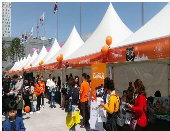
首爾東大門與民眾互動並贈送紀念品