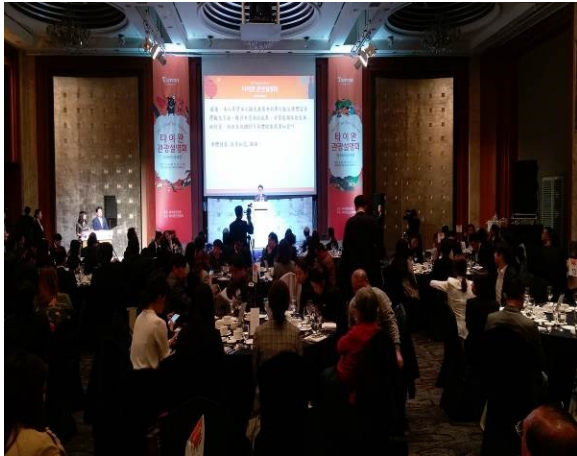
首爾推廣會餐敘場地