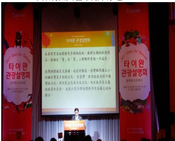
首爾推廣會餐敘韓方代表致詞