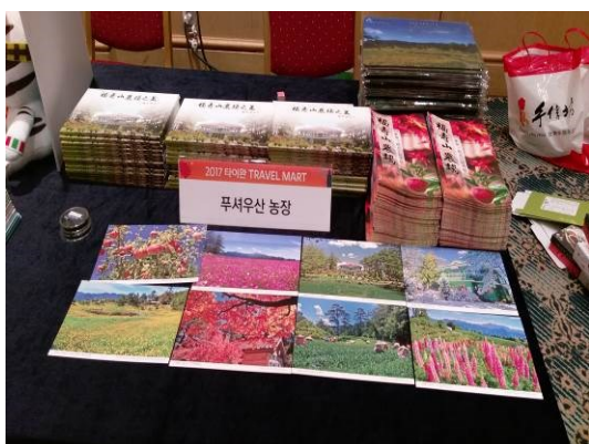
釜山觀光推廣會農場 DM (一)

4月21日上午10時至14時於釜山樂天飯店舉辦臺灣觀光推廣會及餐敘暨摸彩活動，與當地業者、媒體、記者溝通，於洽談會現場進行洽談、行銷農場並拓展觀光業務。