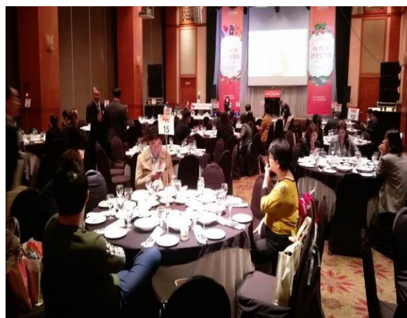
大邱餐敘暨摸彩活動場地