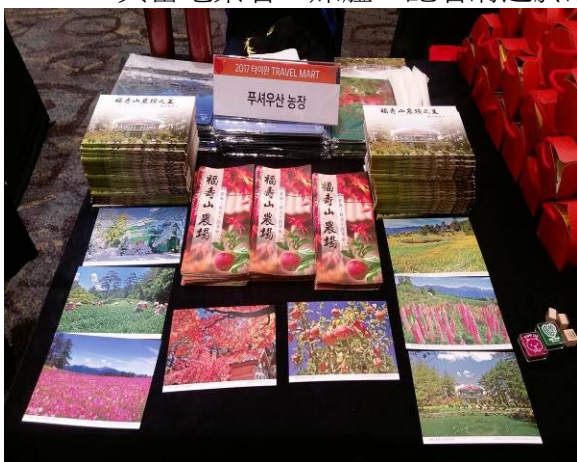
首爾臺灣觀光推廣會農場 DM

4月24日上午10時至14時於首爾樂天飯店舉辦臺灣觀光推廣會及餐敘暨摸彩活動，與當地業者、媒體、記者溝通於洽談會現場進行洽談、行銷農場並拓展觀光業務。