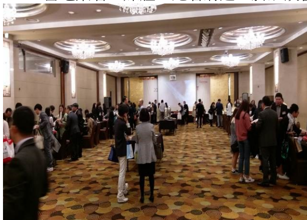
大邱臺灣觀光推廣會(一)

4月22日上午11時至14時於大邱飯店舉辦臺灣觀光推廣會及餐敘暨摸彩活動，與當地業者、媒體、記者溝通，於洽談會現場進行洽談、行銷農場並拓展觀光業務。