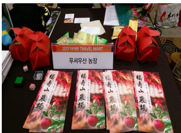
大邱臺灣觀光推廣會農場 DM