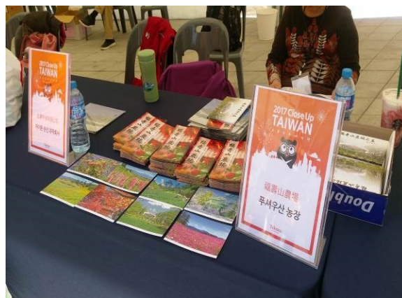
釜山 Road Show 活動農場 DM