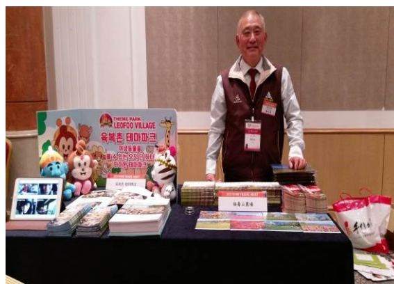
釜山觀光推廣會農場洽談桌 (二)