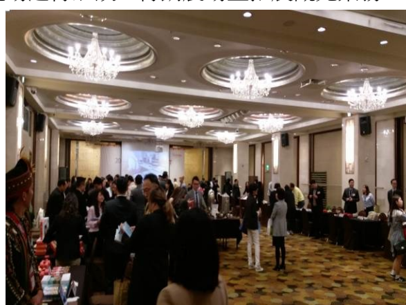
大邱飯店臺灣觀光推廣會(二)