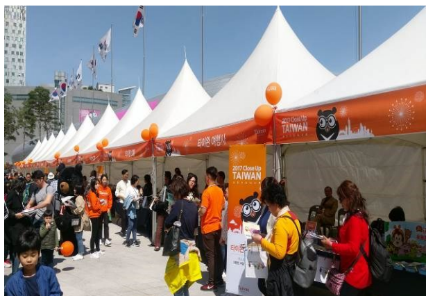
釜山NC百貨西面店 Road Show 活動

4月21日下午15時至18時於釜山人潮聚集地NC百貨西面店前廣場舉辦臺灣觀光Road Show活動，更貼近當地民眾，提升臺灣觀光印象。