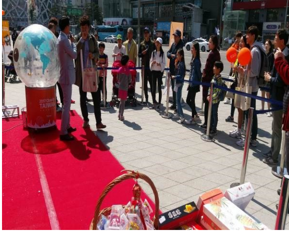
首爾東大門設計廣場趣味問答活動

4月23日下午14時至18時於首爾東大門設計廣場，人潮聚集地舉辦臺灣觀光 Road Show 活動，與當地民眾互動並贈送紀念品或臺灣農特產品。