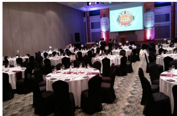
釜山觀光推廣會餐敘暨摸彩活動場地 (四)