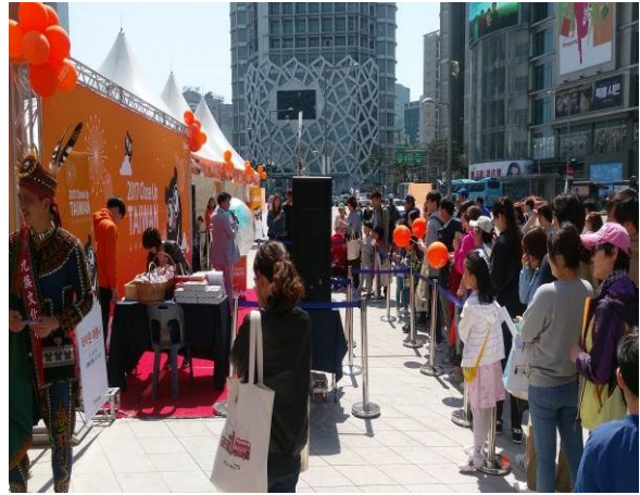
首爾東大門設計廣場 Road Show 活動