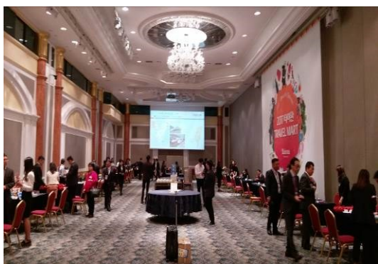
釜山觀光推廣會場地 (三)