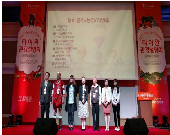
首爾推廣會介紹臺灣業者