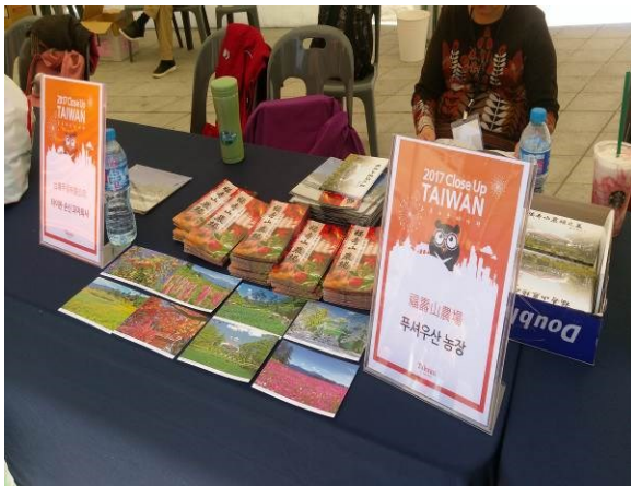
首爾東大門設計廣場洽談桌