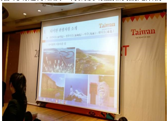
首爾臺灣觀光推廣會介紹臺灣景點