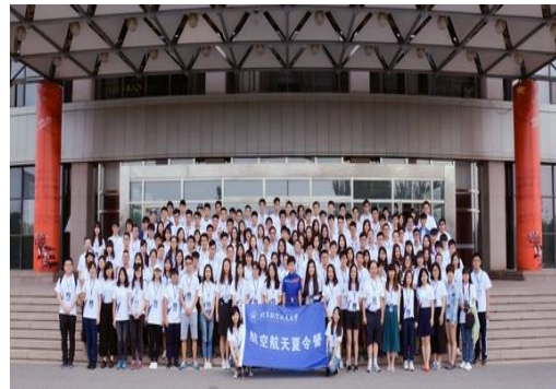
與中國首位女太空人合影