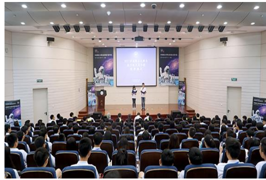
京港澳臺大學生航空航太夏令營開營