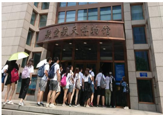
參觀航空航天博物館