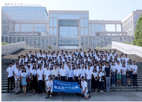
在新主樓前大合影