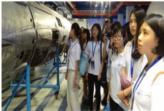
同學們認真聽導覽