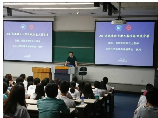
北京大學介紹講座