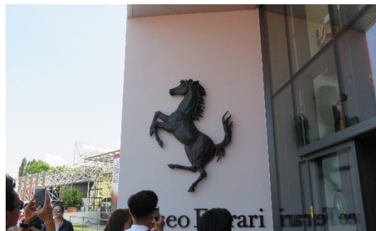
第四天: 法拉利博物館