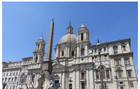
第九天:羅馬 四河噴泉