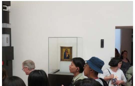
第六天:佛羅倫斯 烏菲茲美術館