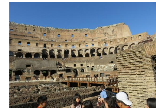
第八天:羅馬圓形競技場