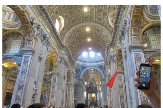
第八天:羅馬 梵諦岡博物館