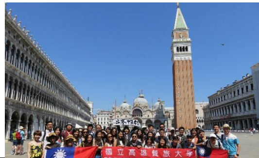
第三天: 聖馬可廣場