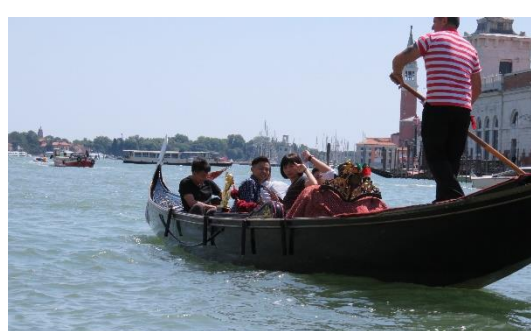
第三天: 坐 GONDOLA 鳳尾船