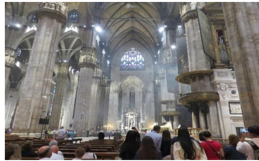
第二天: 米蘭大教堂