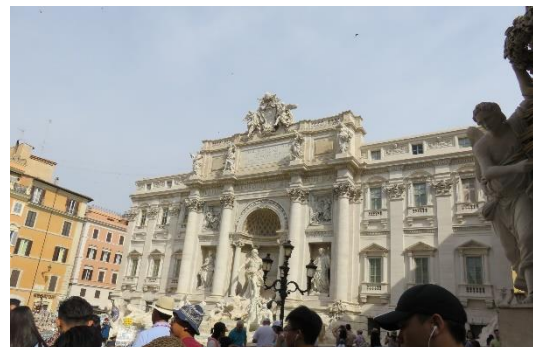
第九天:羅馬 心靈活水許願池