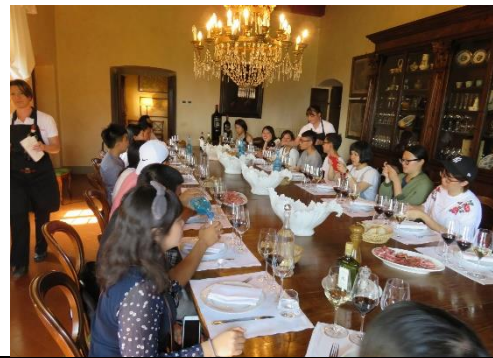
第五天 Castello di Nipozzano 酒莊 試喝