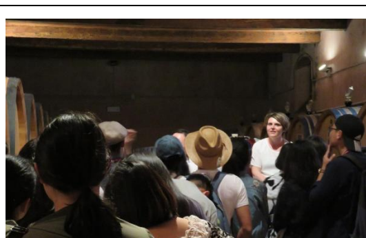
第五天: 參訪 Castello di Nipozzano 酒莊