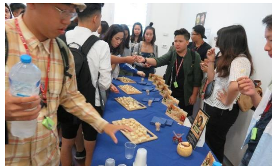
第四天: 起司工廠 試吃