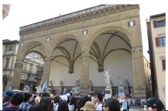
第六天:佛羅倫斯 領主廣場