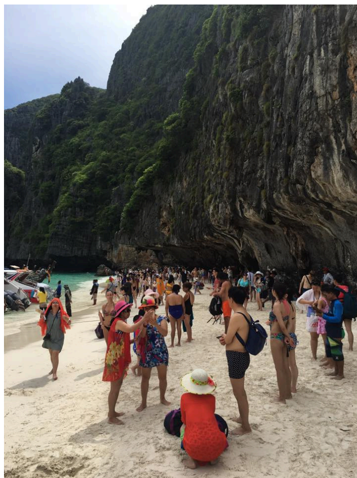
圖四：泰國島嶼觀光擁擠的問題

決飯店客人在海灘休憩時，財務被扒、被竊的問題。另外，我們也發現當地的飯店會與當地的業者合作，劃定水上摩托區專用區，並引薦有興趣的遊客，前往特定的水上摩托車區體驗。順利解決水上摩托車與泳客衝突的危險情況。最後，如何解決飯店門口嘟嘟車、摩托車雜亂，沒有制度的排班問題。一味的禁止只會引起在地勢力更大的反彈。因此，在飯店門口劃定特定的排班區，給予遮蔭設施、排班背心。在不與在地勢力爭利的情況下，順利解決飯店門口雜亂的交通業者排班問題。