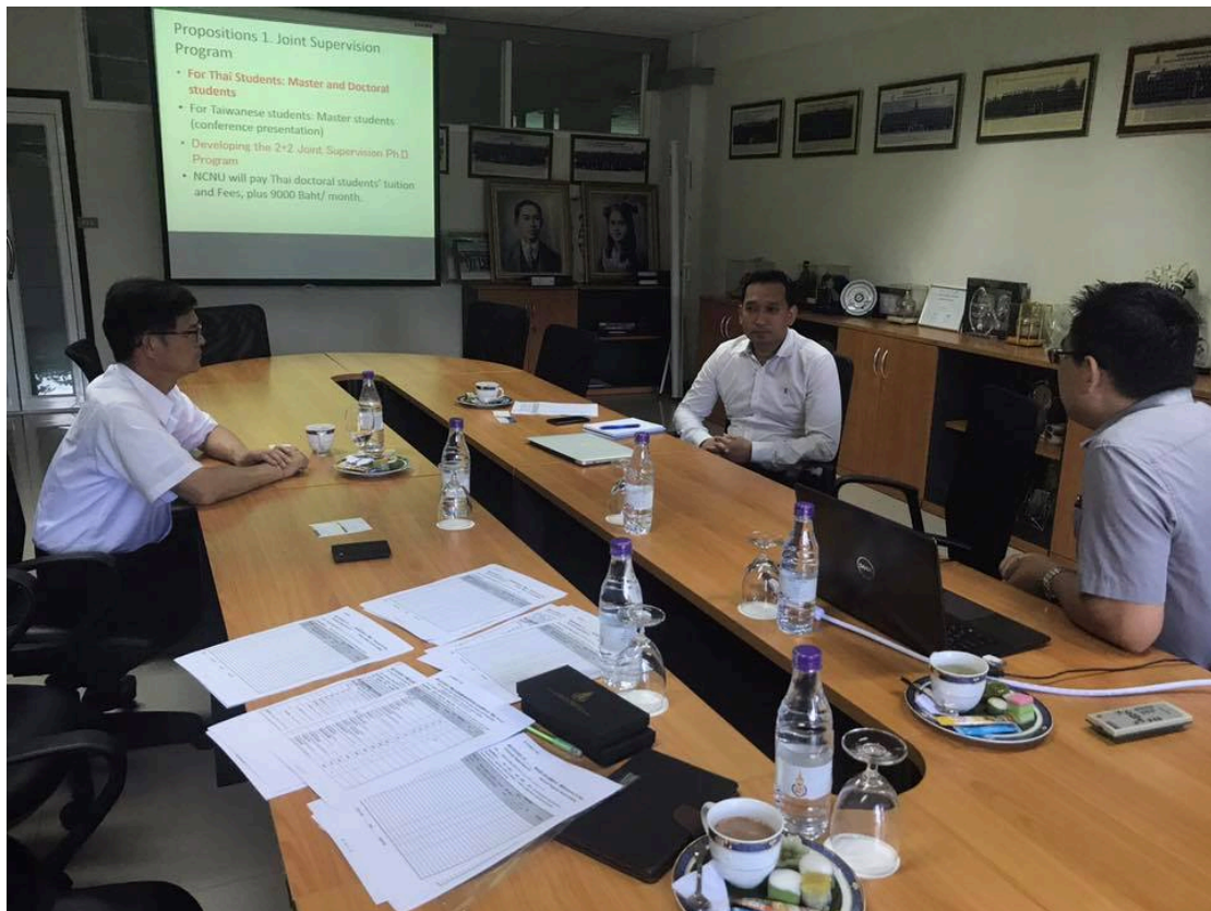
圖五：前往 PSU 進行拜會與提案