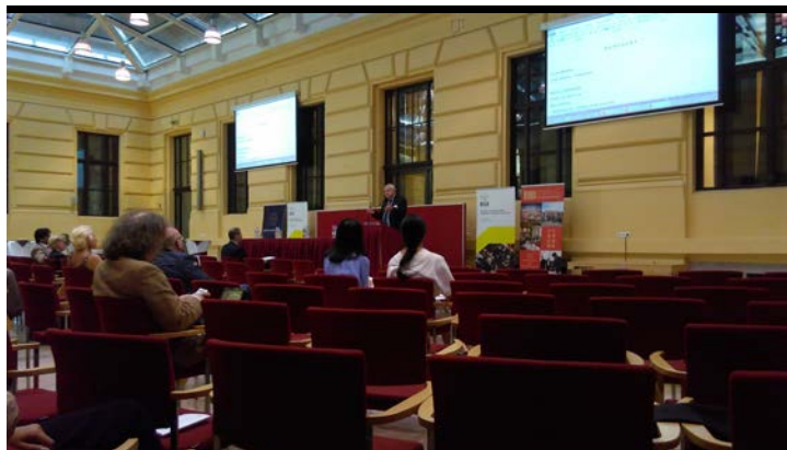
第四天 參加第二天學術研討會