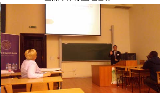
第三天 參加研討會本人發表論文過程