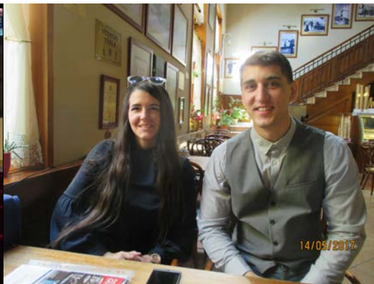
與該商學院學生討論交換學生事宜