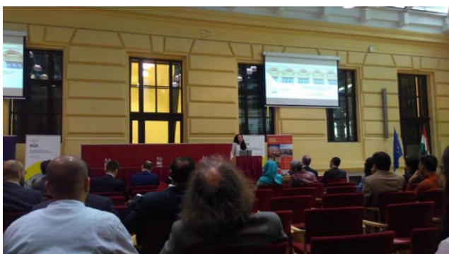
第三天 參加該商學院舉辦之學術研討會