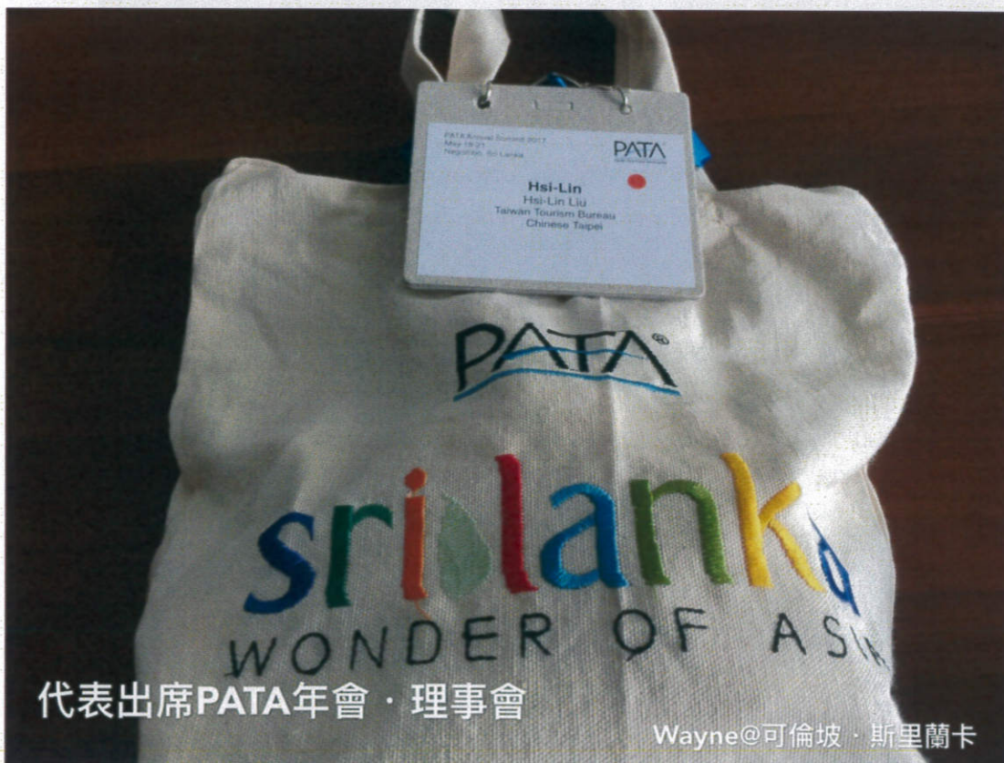
代表出席PATA年會·理事會