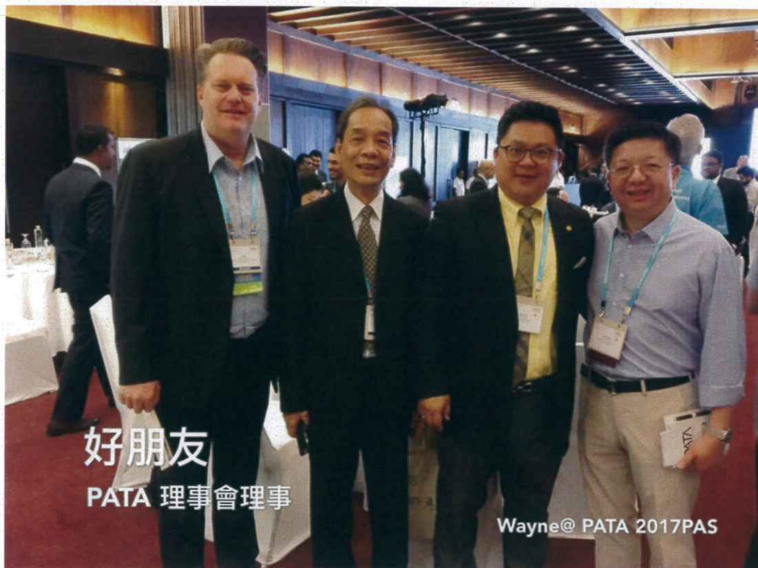
好朋友 PATA 理事會理事