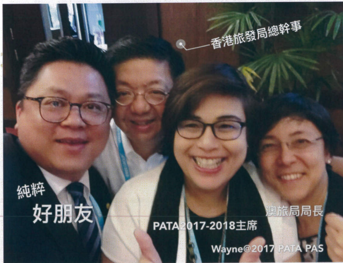
香港旅發局總幹事