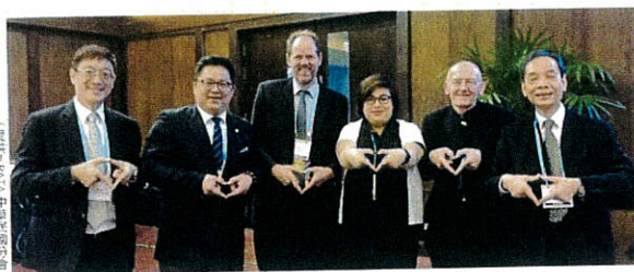
2017 PATA 中國區副會長

PAS2017由斯里蘭卡政府旅遊促進局主辦,會議內容包括協會執行和諮詢委員會會議、年度會員代表大會(AGM)、PATA青年論壇、PATA與聯合國世界旅遊組織(UNWTO)部長級辯論及因應旅遊業變化的討論會議等。今年高峰會由青年論壇揭開序幕,主題為「零