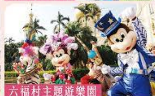
六福村主題遊樂園