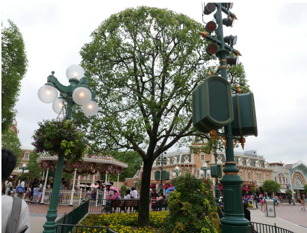
5 月 20 日參訪香港迪士尼樂園-植栽視覺景觀(一)