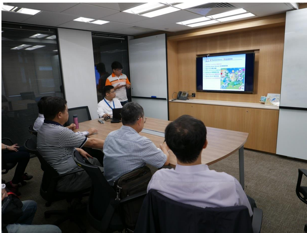
5 月 20 日參訪香港海洋公園聽取設施介紹與發展理念簡報