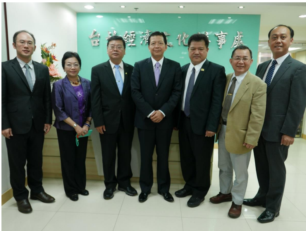
5月22日拜會經濟文化辦事處(澳門)(三)