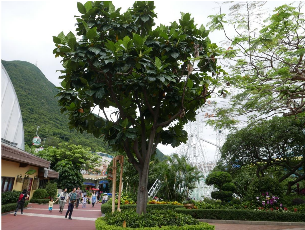
5 月 20 日參訪香港海洋公園-植栽視覺景觀(一)