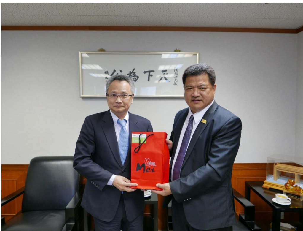
5月19日拜會行政院大陸委員會香港事務局(三)