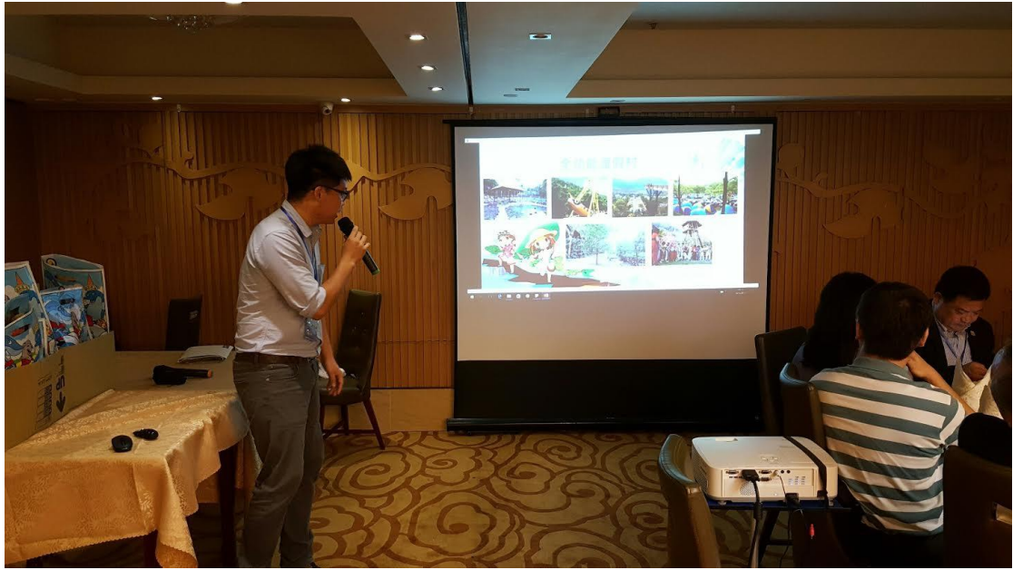
5月18日舉辦香港業者推介會及聯誼餐會現場(五)