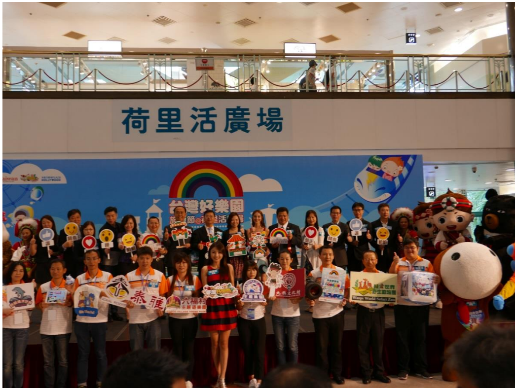
5月19日2017台灣好樂園開幕記者會現場(三)