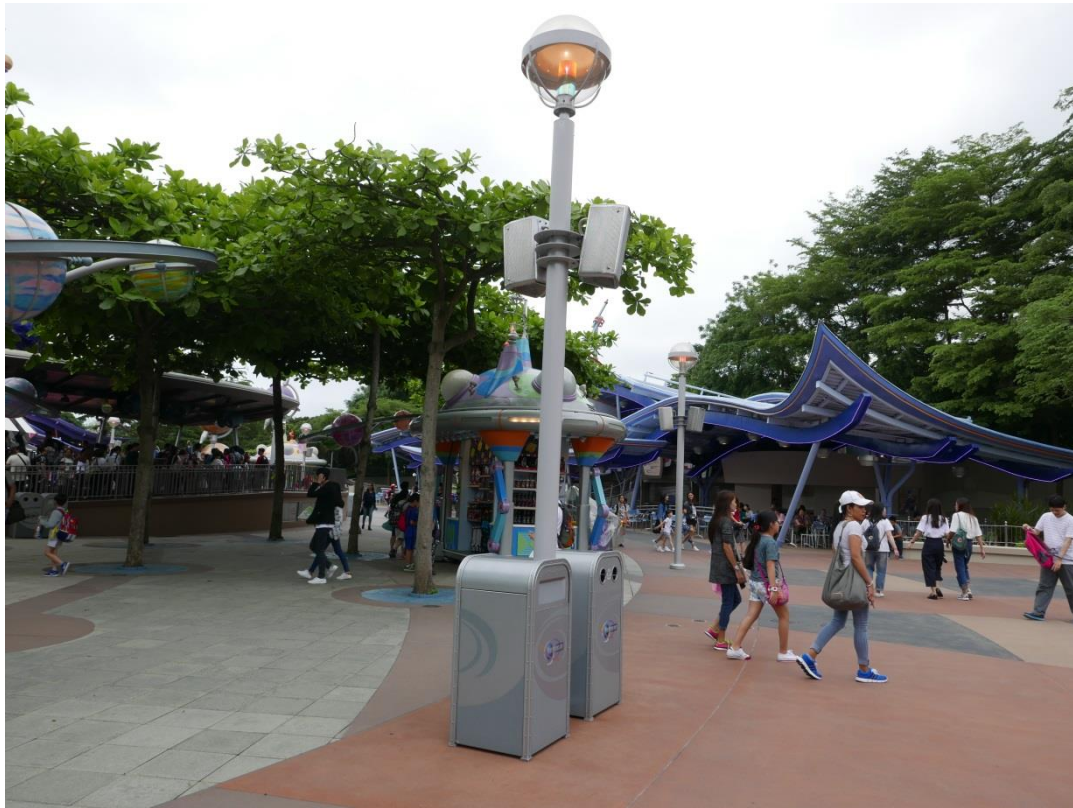
5月20日參訪香港迪士尼樂園現場景觀(垃圾桶特色與乾淨)