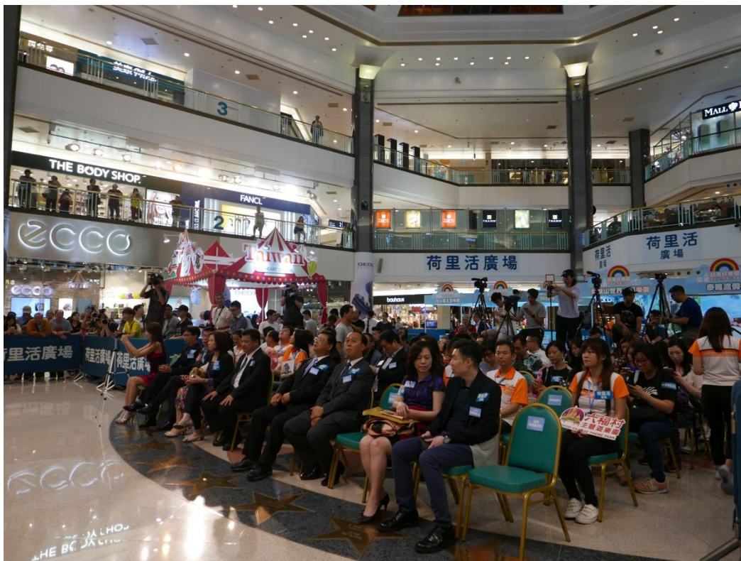
5月19日2017台灣好樂園開幕記者會現場(四)