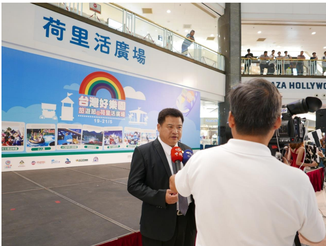
5月19日2017台灣好樂園開幕記者會現場(六)