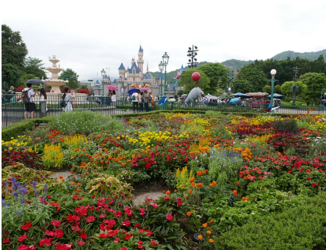
5 月 20 日參訪香港迪士尼樂園-植栽視覺景觀(一)