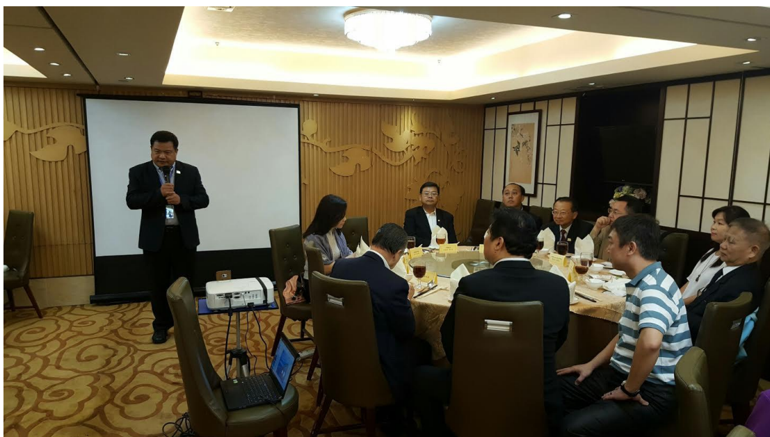
5月18日舉辦香港業者推介會及聯誼餐會現場(三)