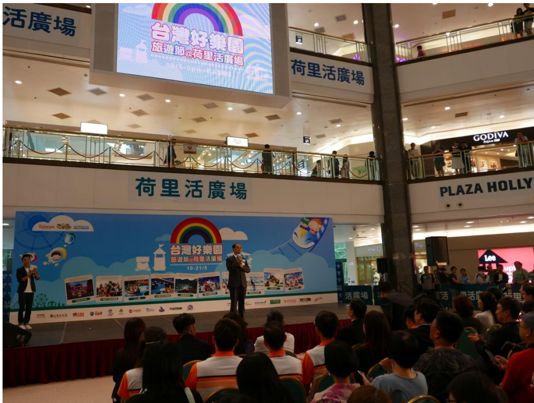
5月19日2017台灣好樂園開幕記者會現場(二)