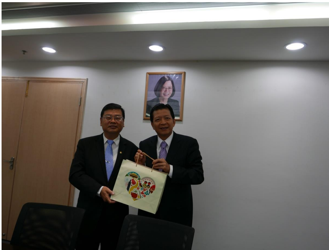
5月22日拜會經濟文化辦事處(澳門)(二)