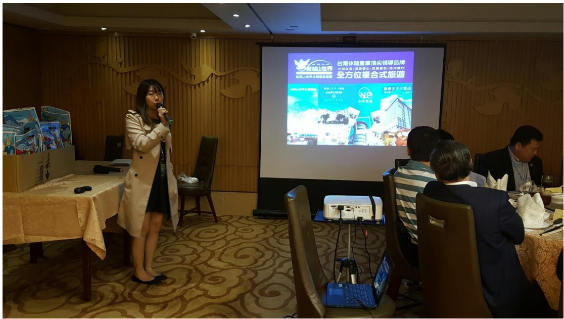
5月18日舉辦香港業者推介會及聯誼餐會現場(六)