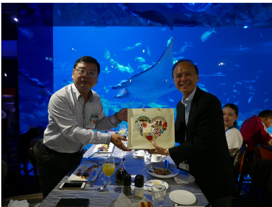
5 月 20 日參訪香港海洋公園