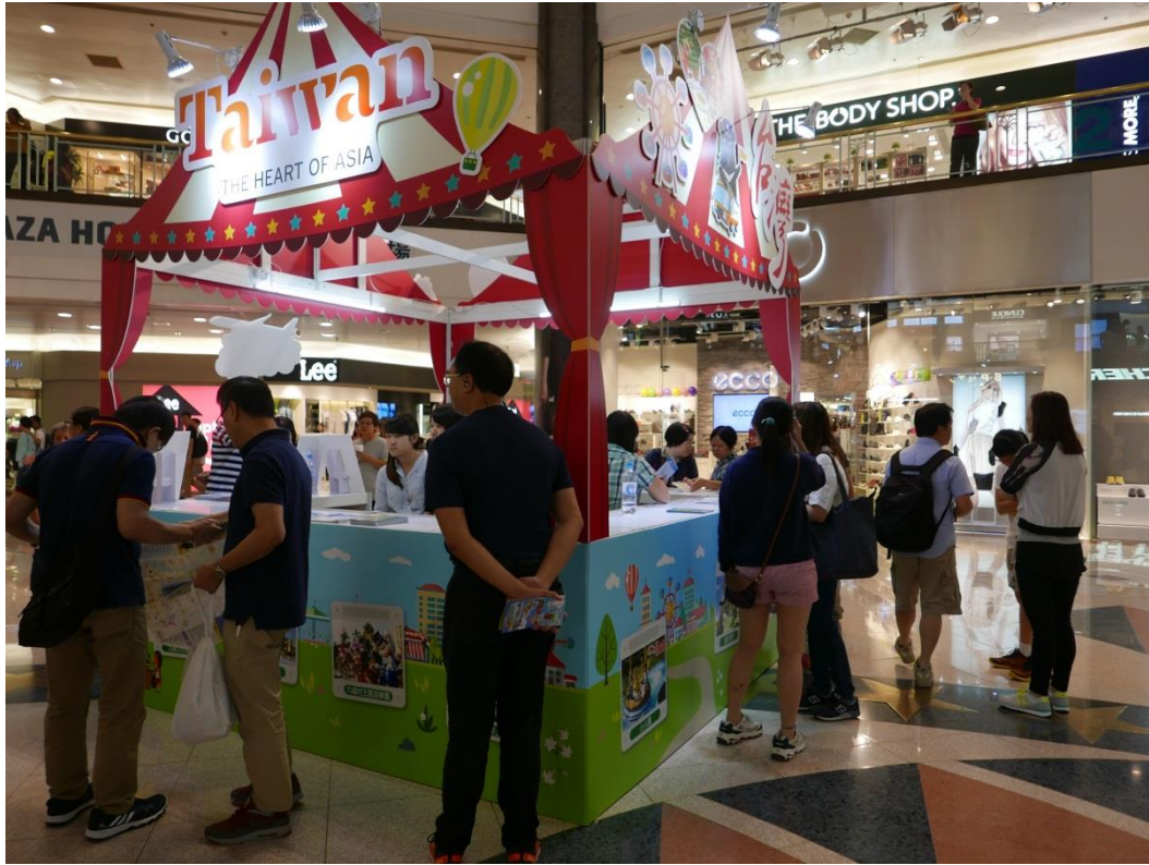
5月20日2017台灣好樂園開幕記者會現場(一)