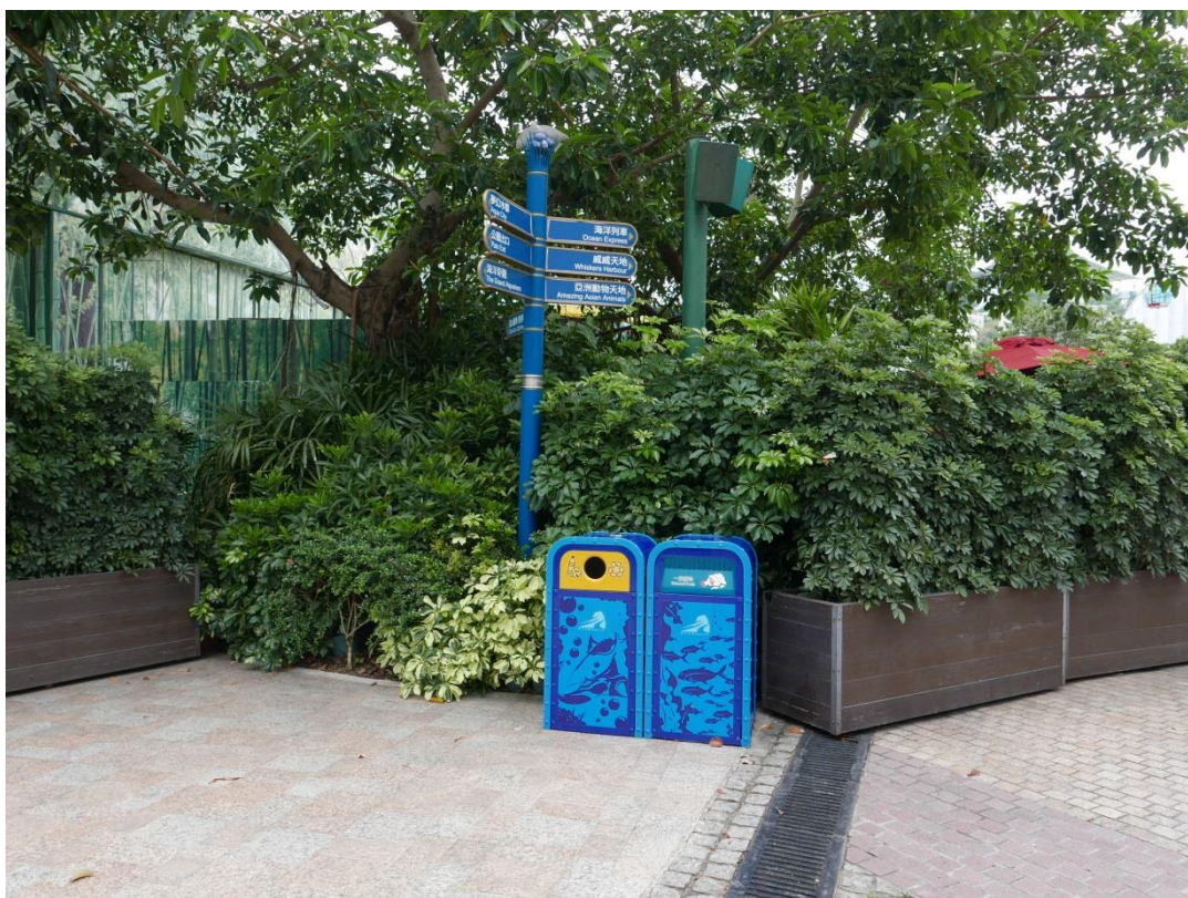
5月20日參訪香港海洋公園現場景觀(垃圾桶特色與乾淨)