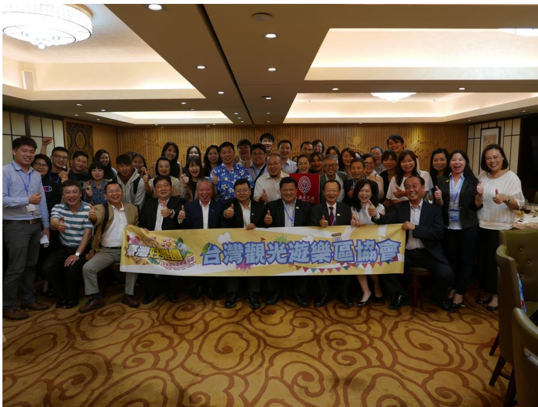
5月18日舉辦香港業者推介會及聯誼餐會現場(一)