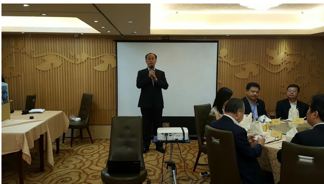
5月18日舉辦香港業者推介會及聯誼餐會現場(四)