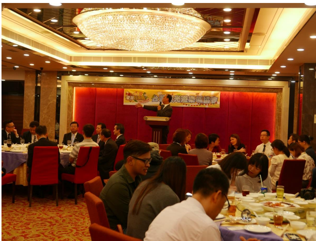
5月22日舉辦澳門業者推介會及聯誼餐會現場(三)