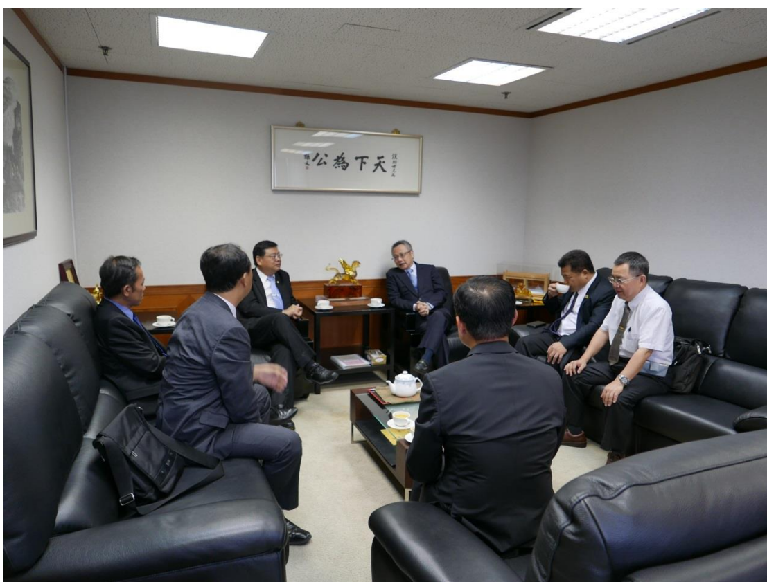
5月19日拜會行政院大陸委員會香港事務局(一)