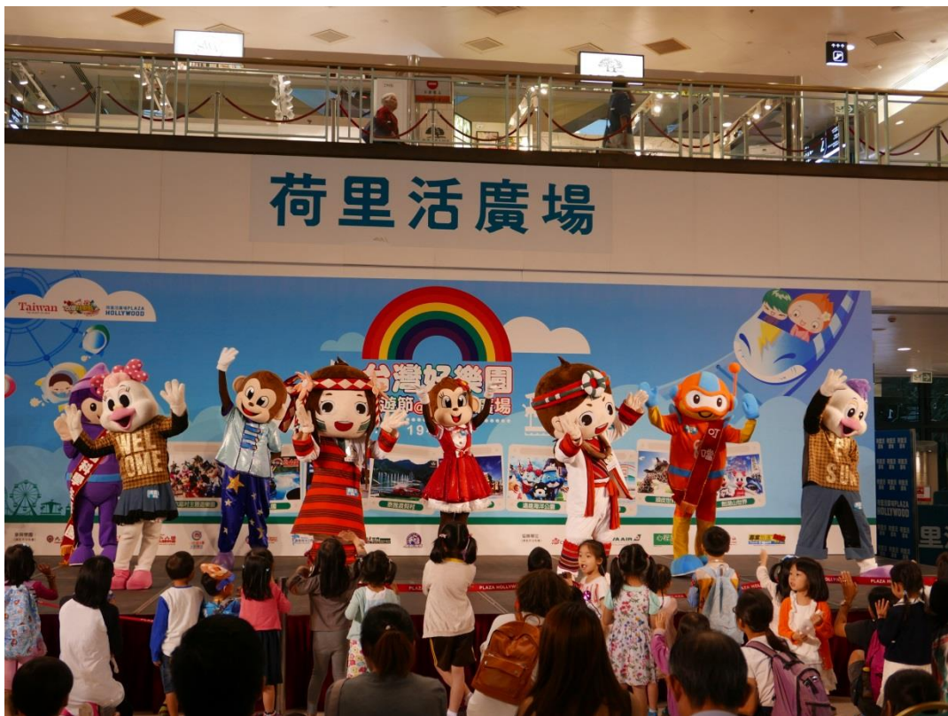
5月20日2017台灣好樂園開幕記者會現場(四)