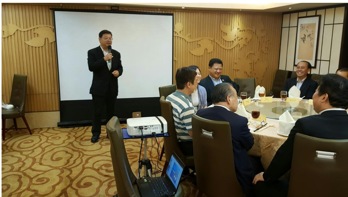
5月18日舉辦香港業者推介會及聯誼餐會現場(二)