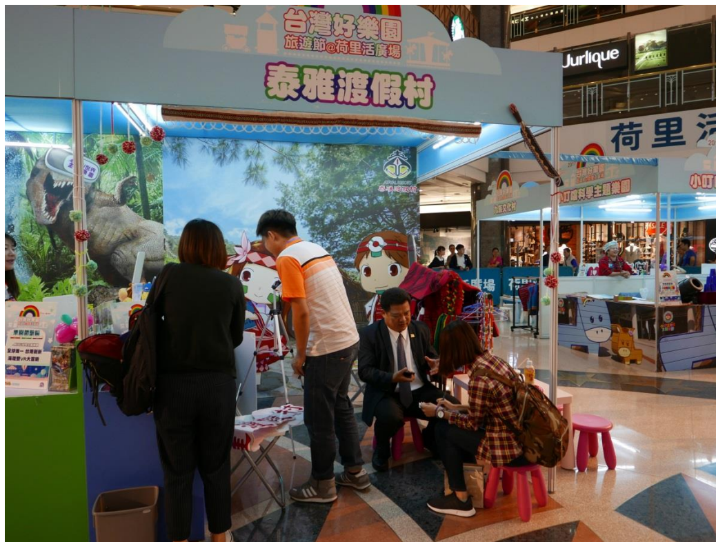
5月19日2017台灣好樂園開幕記者會現場(八)