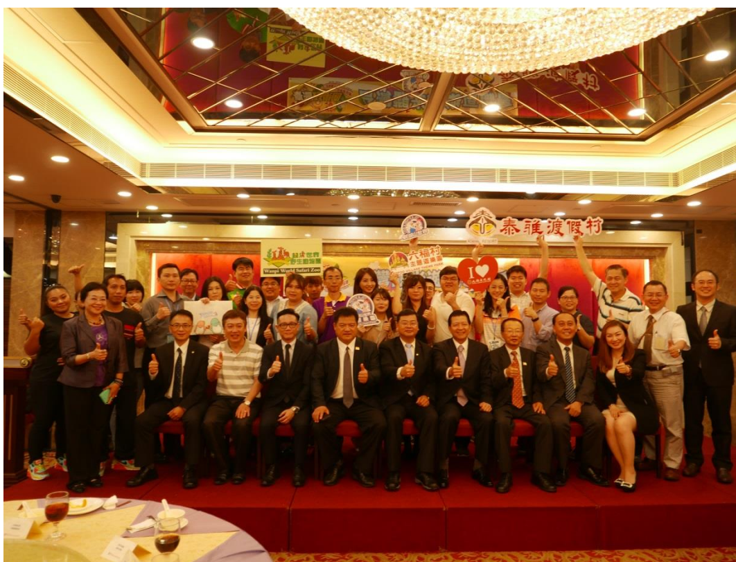
5月22日舉辦澳門業者推介會及聯誼餐會現場(五)