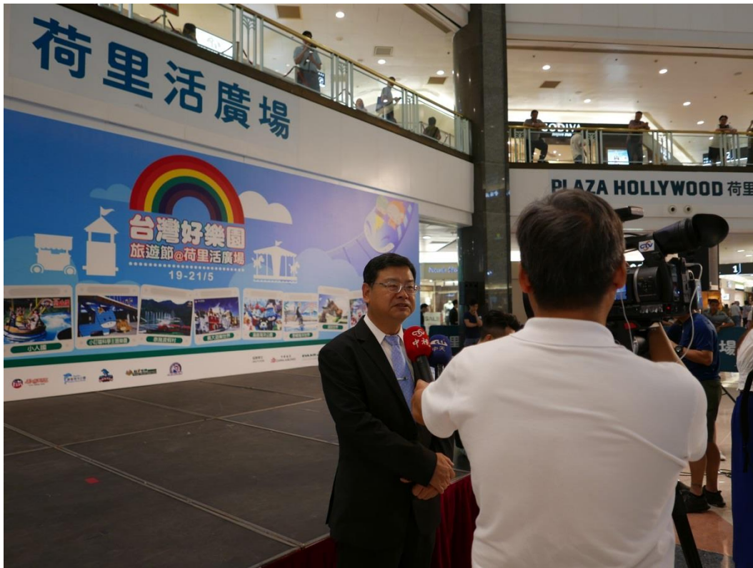
5月19日2017台灣好樂園開幕記者會現場(五)