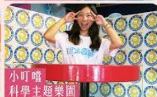
小叮噠科學主題樂園

有關活動最新消息，請密切鎖定台灣觀光協會駐香港辦事處 Facebook專頁 f Itstimefortaiwanhk/