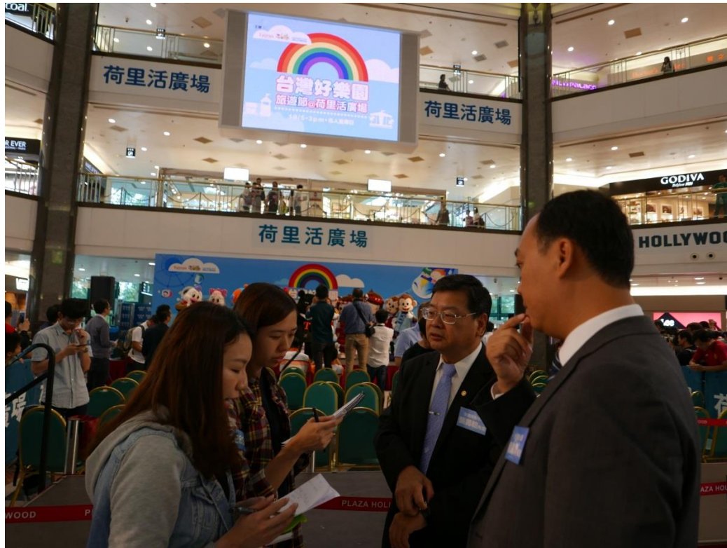
5月19日2017台灣好樂園開幕記者會現場(七)