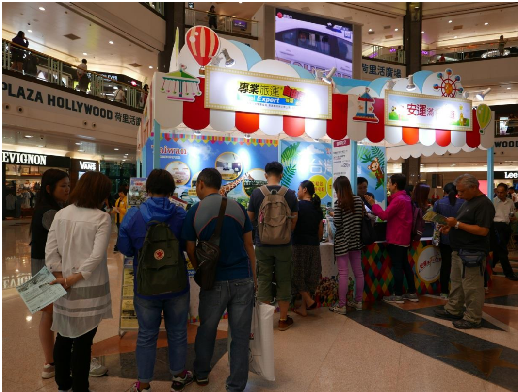
5月20日2017台灣好樂園開幕記者會現場(二)