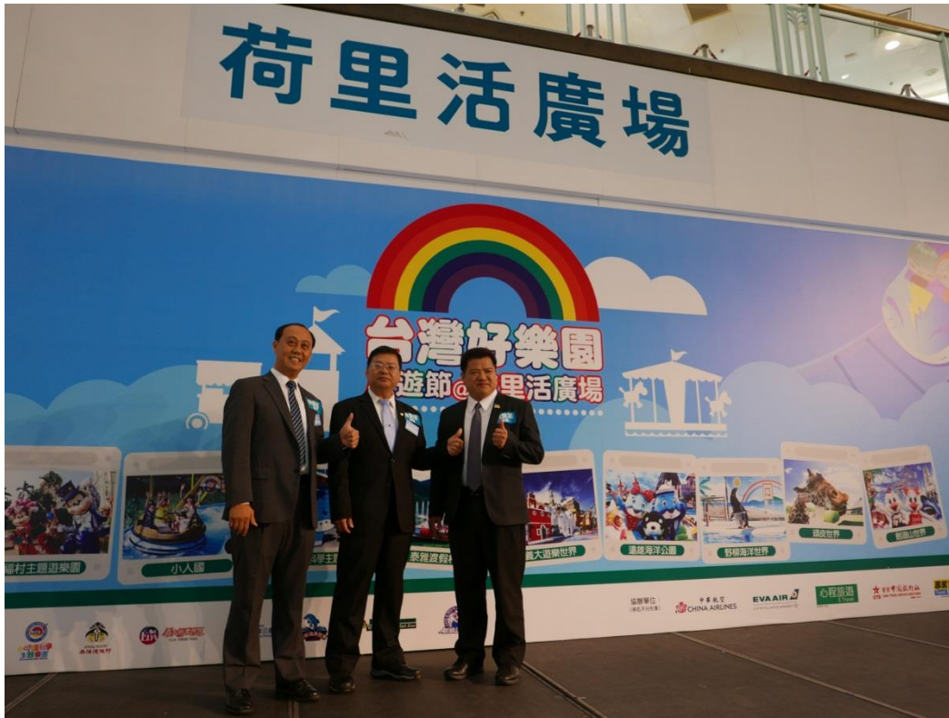
5月19日2017台灣好樂園開幕記者會現場(一)