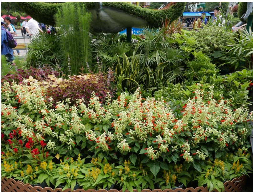
5 月 20 日參訪香港海洋公園-植栽視覺景觀(二)