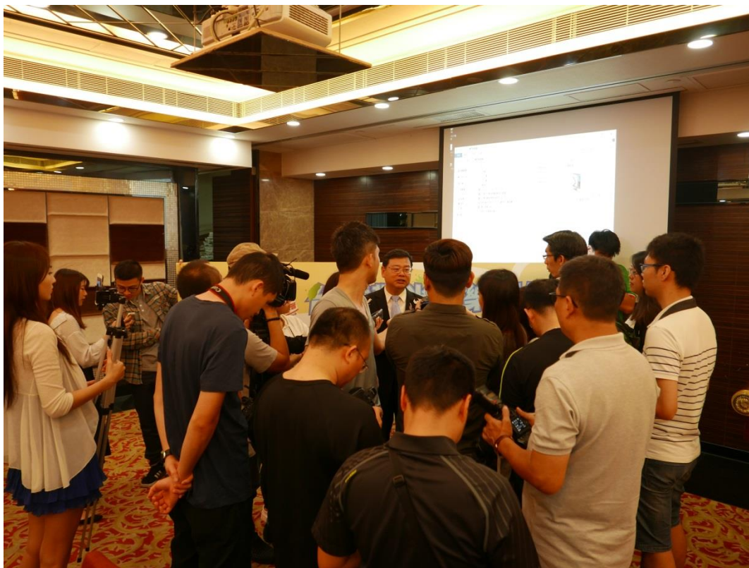
5月22日舉辦澳門業者推介會及聯誼餐會現場(四)