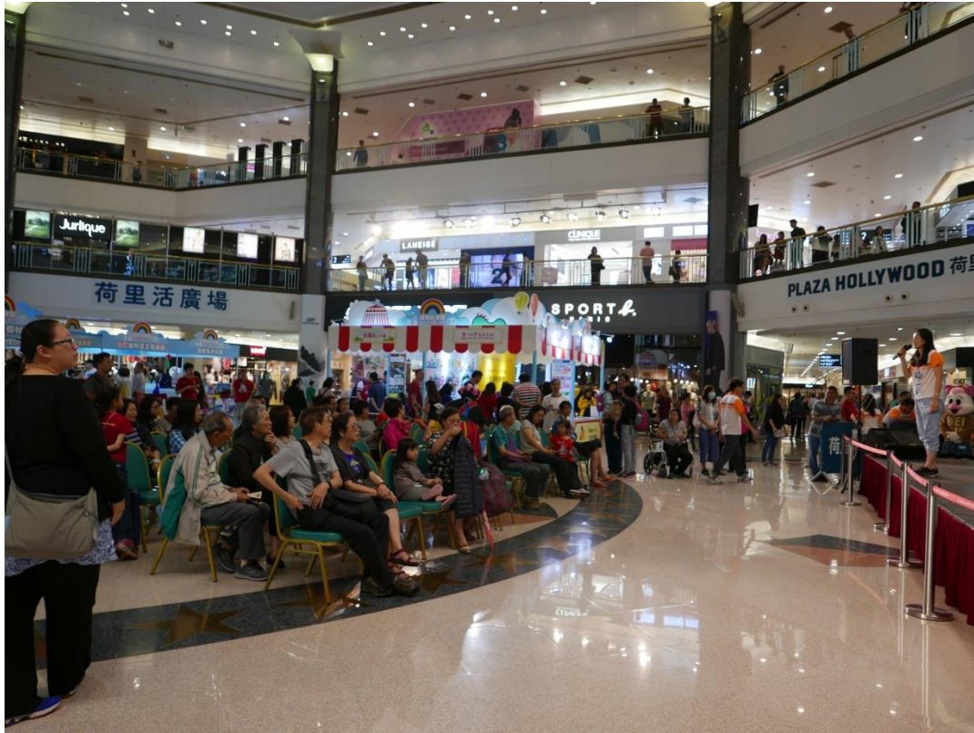
5月20日2017台灣好樂園開幕記者會現場(三)