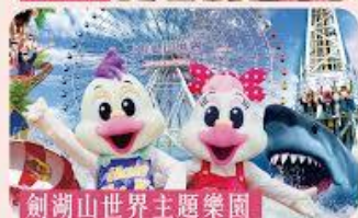
劍湖山世界主題樂園