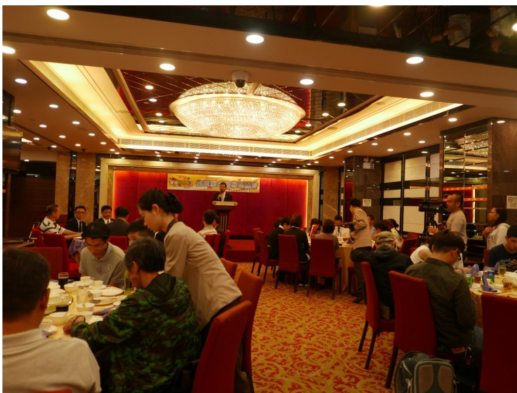
5月22日舉辦澳門業者推介會及聯誼餐會現場(一)