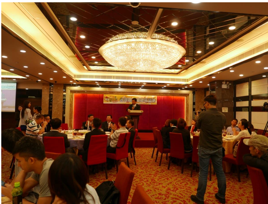
5月22日舉辦澳門業者推介會及聯誼餐會現場(二)