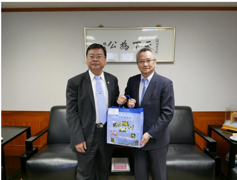
5月19日拜會行政院大陸委員會香港事務局(二)