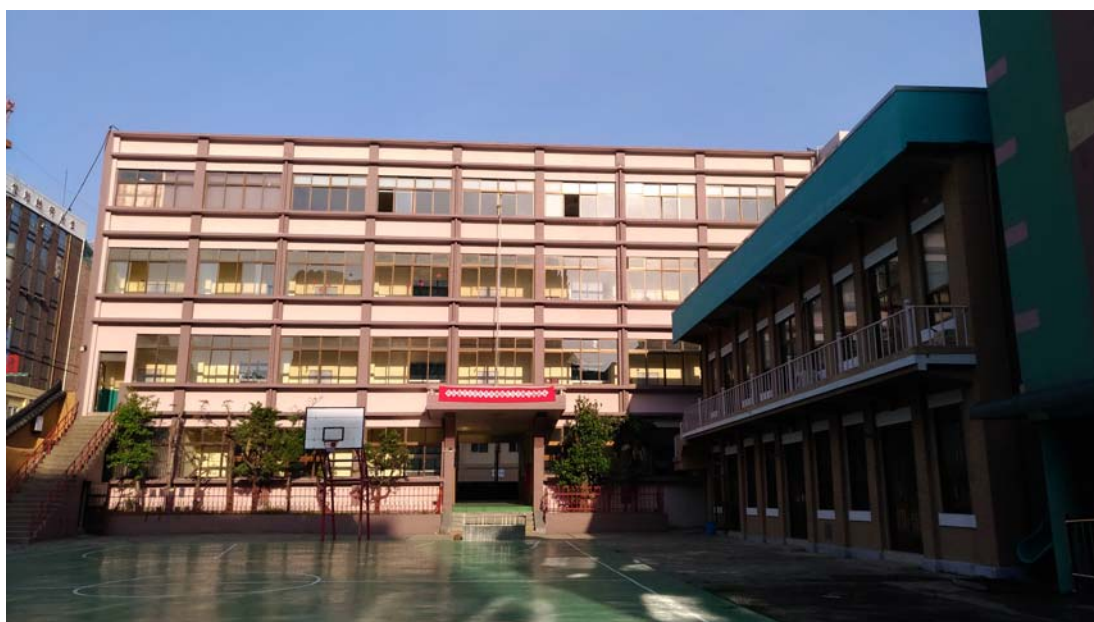
釜山華僑中學校園