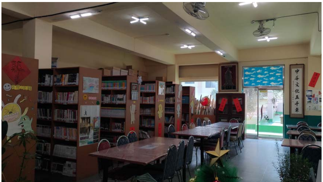
考師休息室 (設於圖書室內)