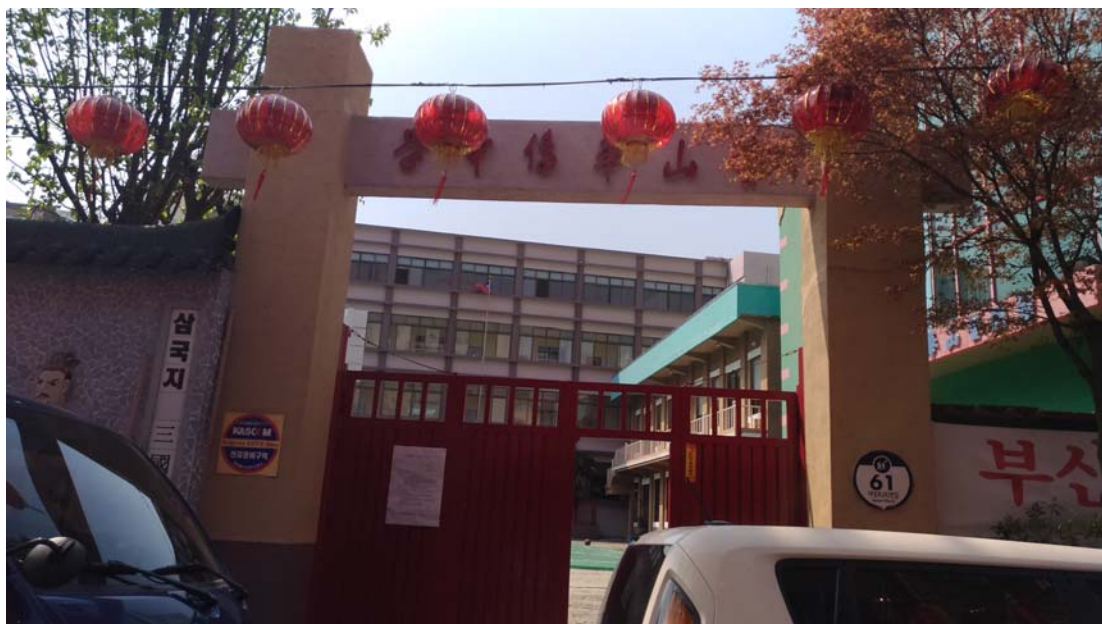
釜山華僑中學大門