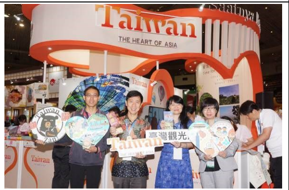
圖十二：巫主任蒞場指導