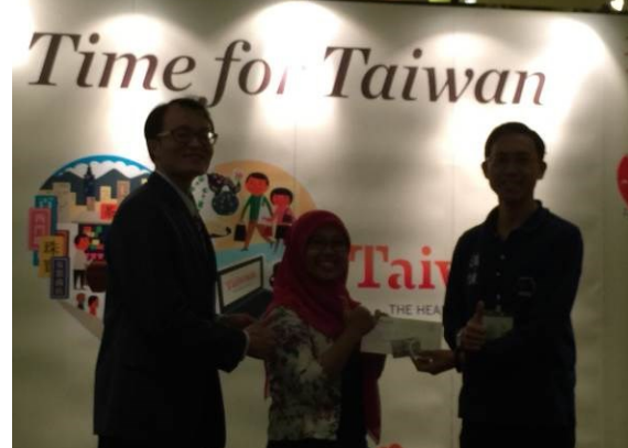
圖六：交流餐會致贈抽獎品