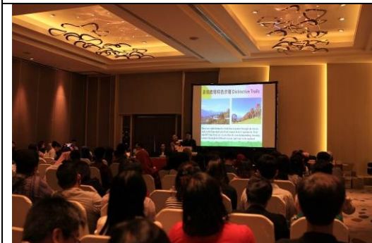
圖三：推廣會專題簡報