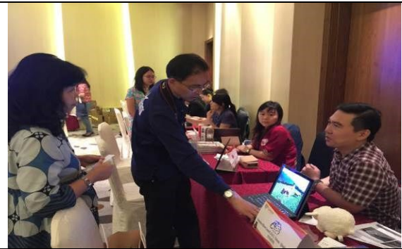
圖二：推廣會推廣洽談