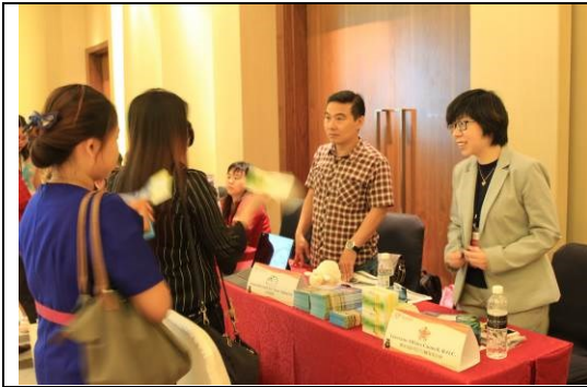
圖一：本會與清境農場準備文宣品吸引當地業者洽談