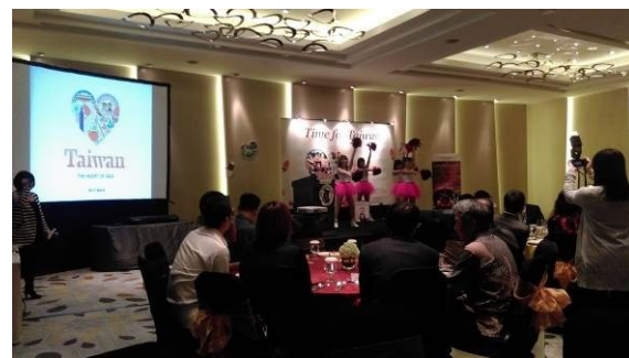
圖四：交流餐會開場表演