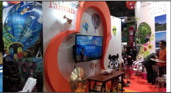
圖十：影片推播農場風貌