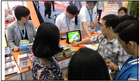
圖九：工讀生展場解說推廣