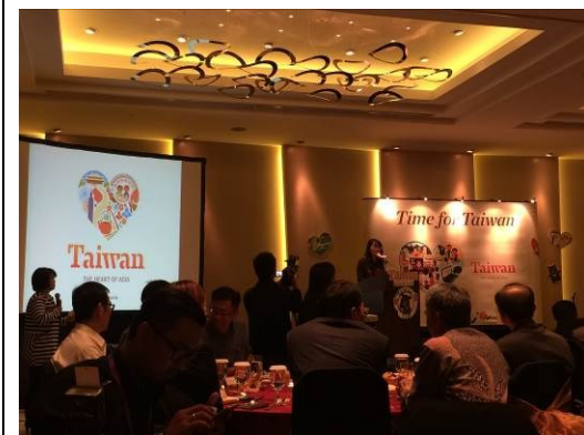
圖五：交流餐會觀光局簡報