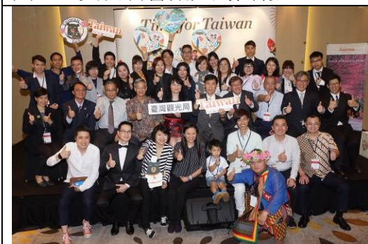
圖七：推廣會大合照