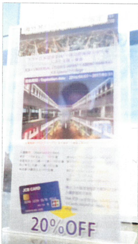
附圖 1：持 JCB 卡購買日本第一高大樓展望台-海闊天空展望台（阿倍野 HARUKAS300）入場券即可享有 8 折優惠