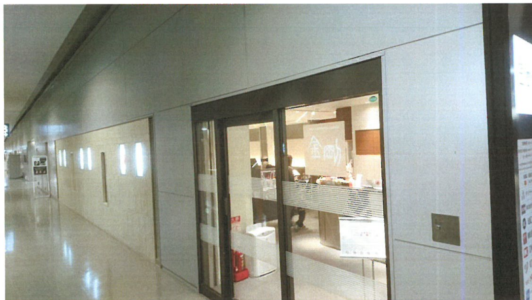
附圖 7：「在日本 FamilyMart、Circle K、Sunkus 一刷土銀 JCB 卡即賺 5%現金回饋」