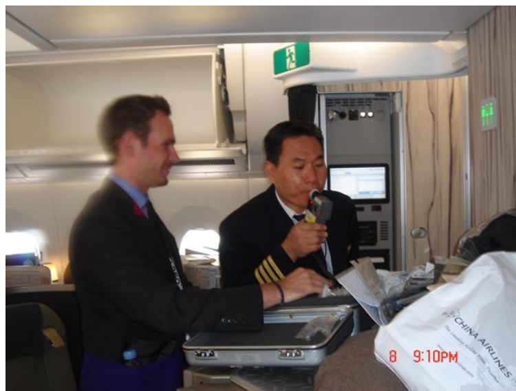
— 酒測作業 —