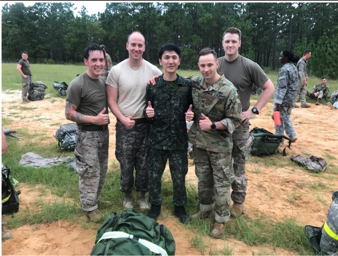
1 2 英 哩 負 重 行 軍 後 與 美 軍 同 學 合 影