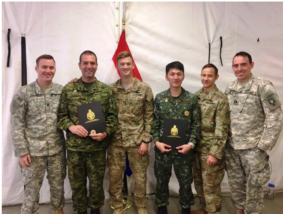
心 戰 軍 官 資 格 課 程 結 訓 合 影