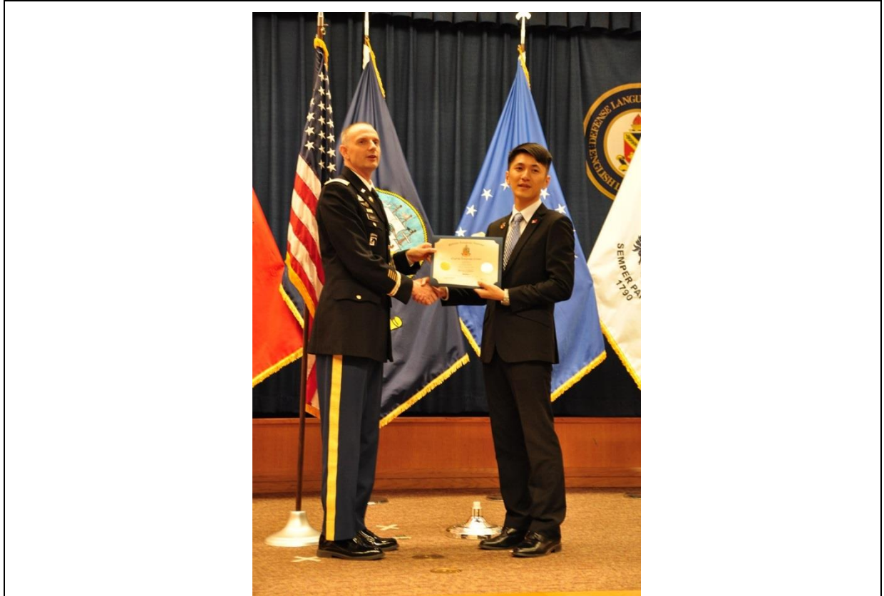
美國國防語文機構英語語言中心結訓合影