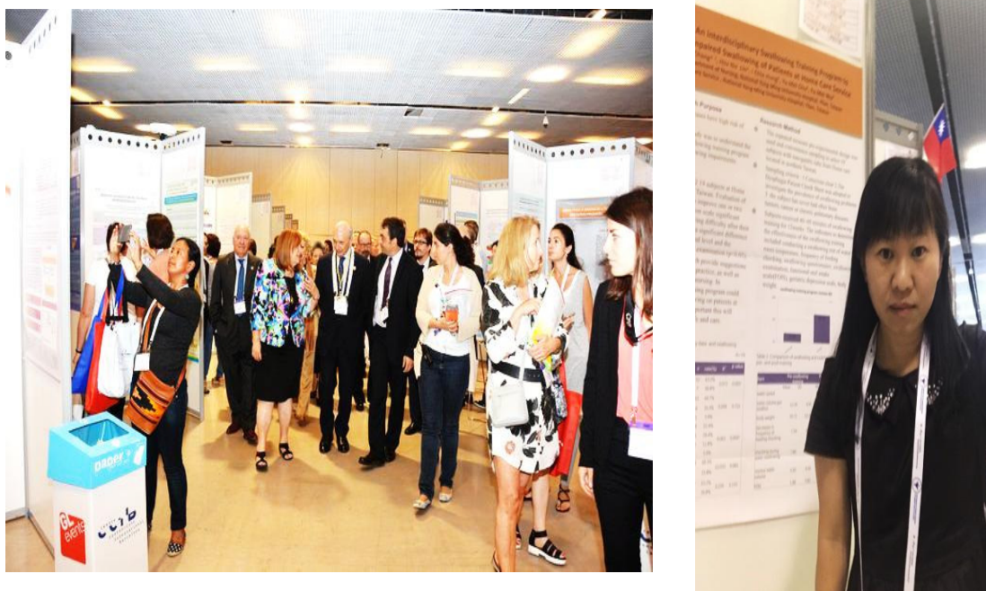
圖三. 參加國際護理協會第二十六屆大會論文海報發表