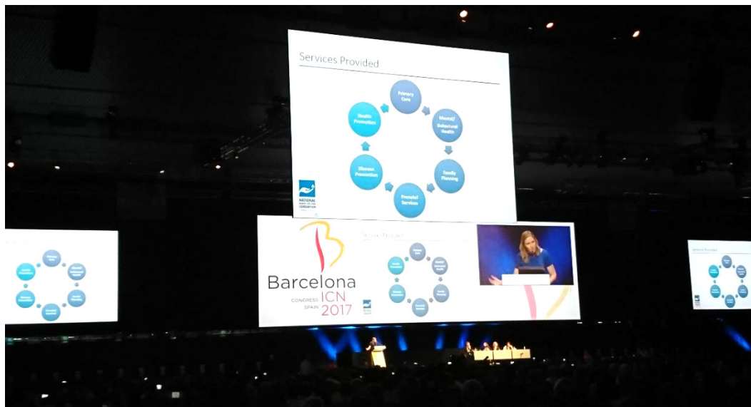
圖二. 參加國際護理協會第二十六屆大會大禮堂演講

賞 ICN 在 2017 年國際護理師節的資源，護理師：領先的聲音 - 實現 SDGs，強調應與非護理受眾一起使用，因為“強調 SDGs 和護理師主導的解決方案”。她還讚揚了 ICN 關於移民的草案立場聲明和難民健康：“我們有責任對待陌生人，對所有人倡導。”維克菲爾德還強調，她的護理師背景對於她在政府工作中至關重要，而且這個職業有責任帶領變革。