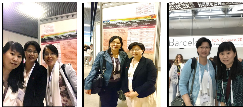
圖五. 參加國際護理協會第二十六屆大會論文海報報告發表與交流

四、5月30日：今天主會場的會議主題為「品質安全：從業人員與工作場所」，會議討論的議題圍繞著「安全的護理人員配置」議題，五位專家分享他們的實證與研究成果，進行分場演講與觀點分享。大會“政策咖啡廳 Policy