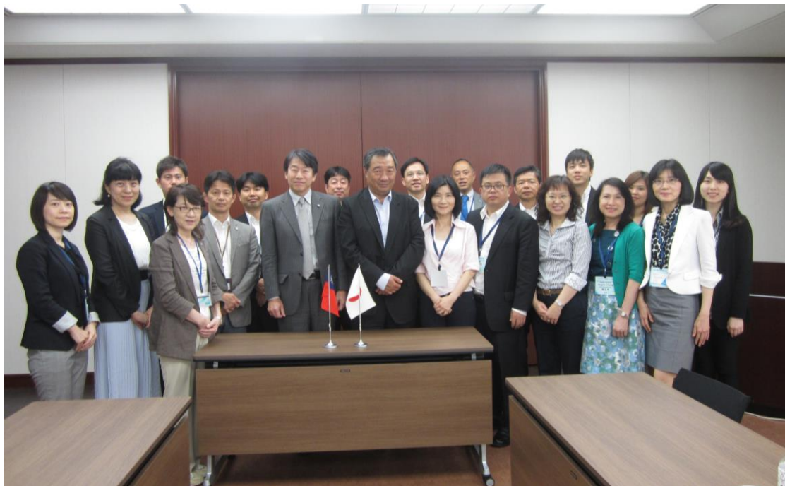
2017/5/22 參訪大阪大學，校方人士及本團團員合照