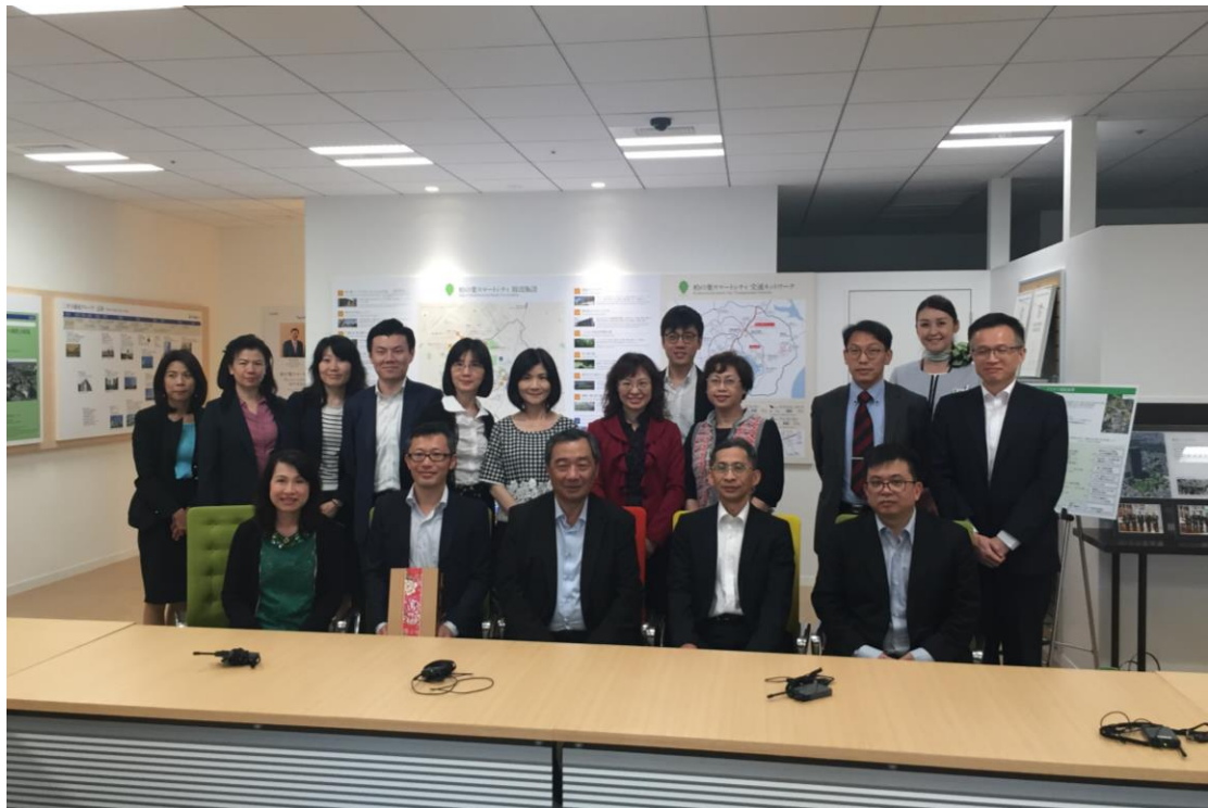
2017/5/25 參訪三井柏葉開放創新實驗室，三井公司與本團團員合照