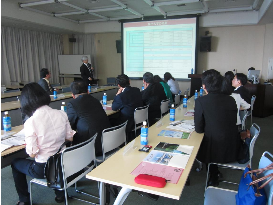
2017/5/22 參訪神戶大學，由 Career Center 長進行該校介紹