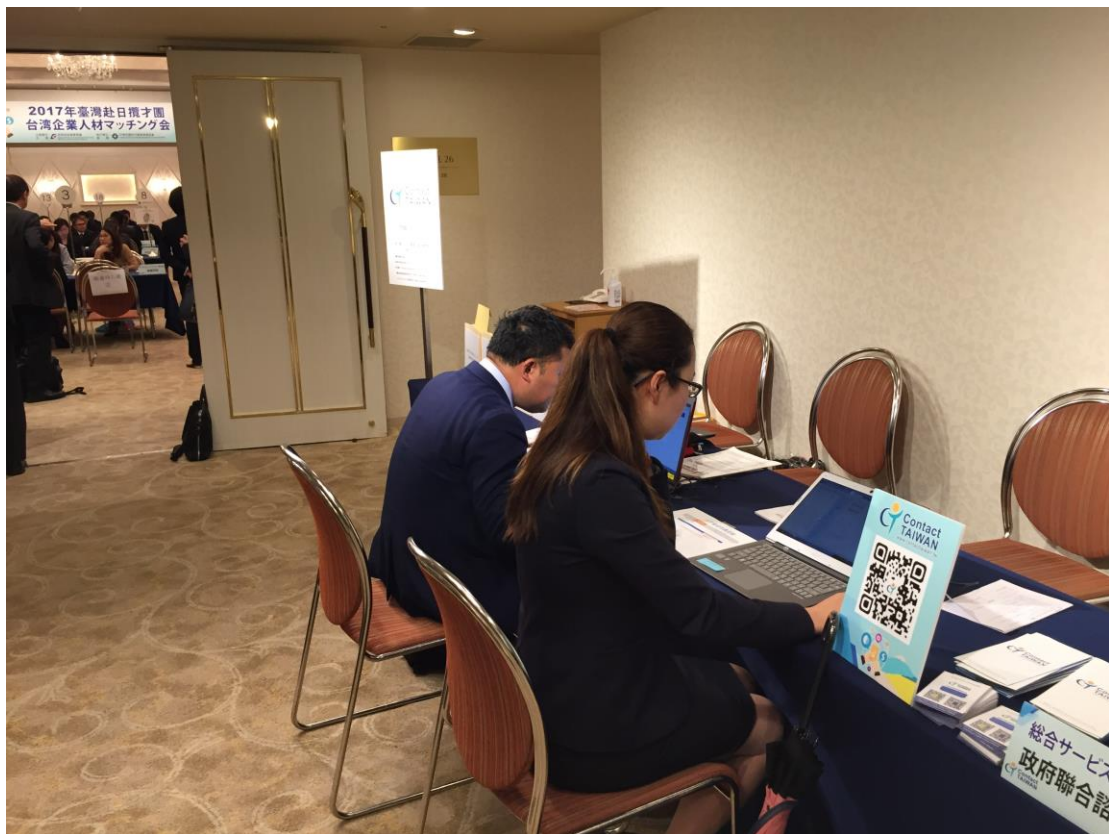
2017/5/26 企業與人才一對一媒合會，人才於現場註冊為 Contact TAIWAN 會員