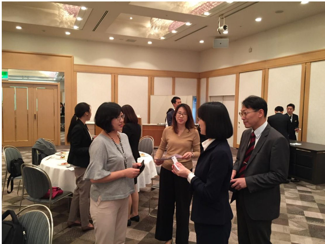
2017/5/26 產業人才交流座談會（東京場），廠商現場交流情況踴躍