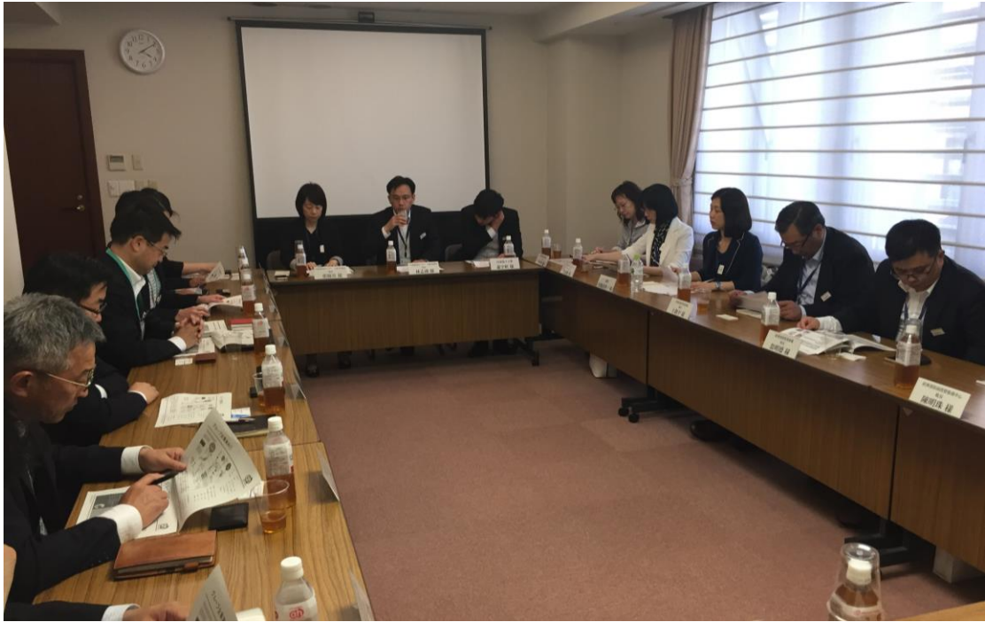
2017/5/22 參訪赤ちゃん本舗，雙方針對該商來臺投資交換意見