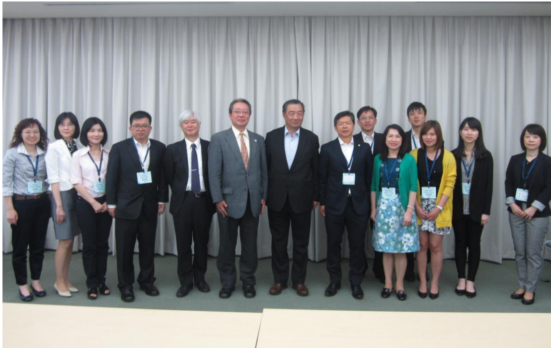
2017/5/22 參訪神戶大學，校方人士及本團團員合照