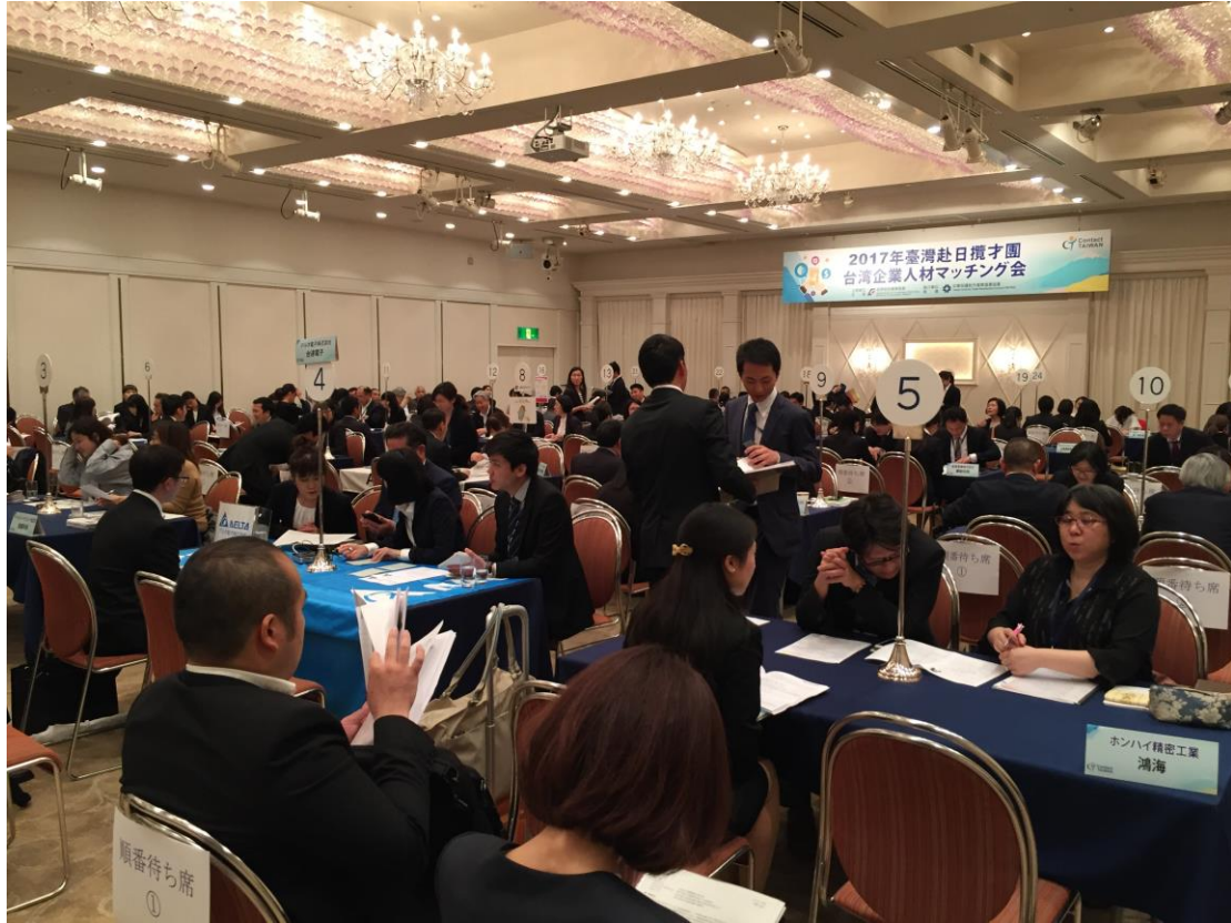
2017/5/26 企業與人才一對一媒合會，求職者眾多，現場洽談氣氛熱絡