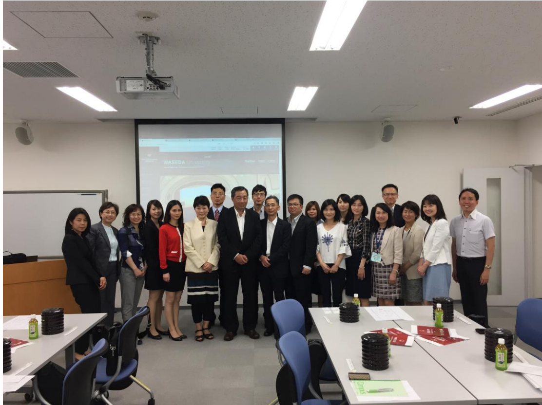
2017/5/24 參訪早稻田大學，校方人士與本團團員合影