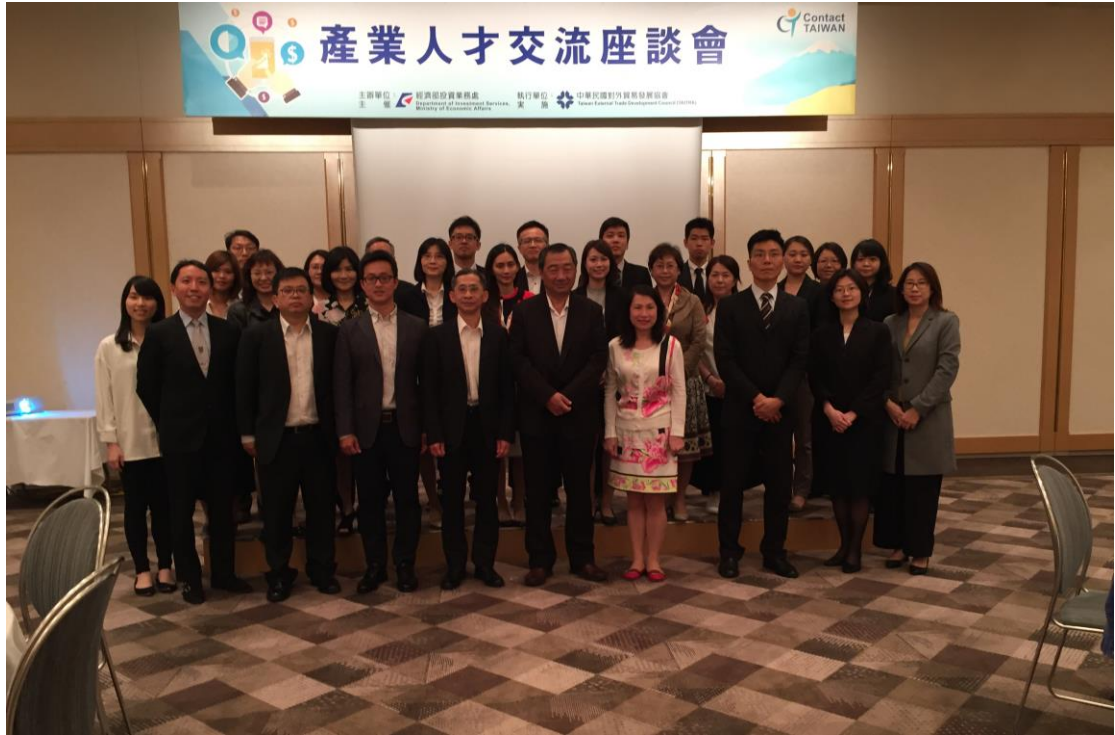
2017/5/26 產業人才交流座談會（東京場），全體團員合影