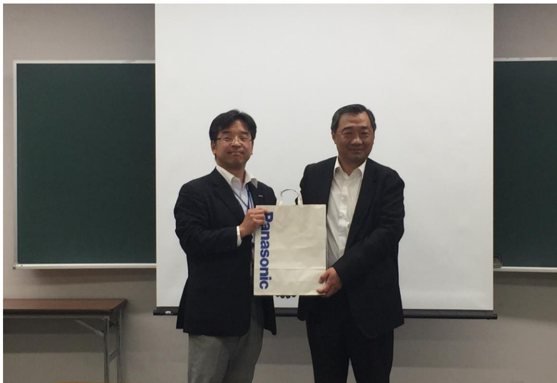
2017/5/23 參訪 Panasonic，並致贈禮品予本團