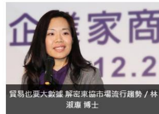
貿易也要大數據 解密東協市場流行趨勢 / 林淑惠 博士