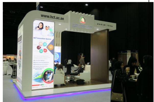
主辦學校的攤位佈置