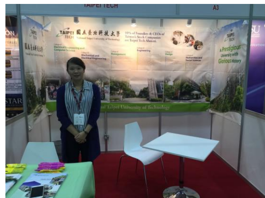
學校參展攤位、佈置及參展代表