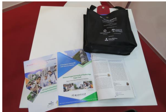
7 th QSMAPLE 節目冊與本校廣告