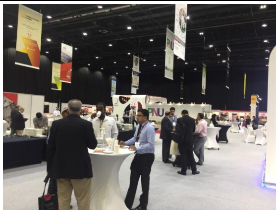
大會現場交流狀況