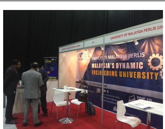
其他各校代表交流狀況-2