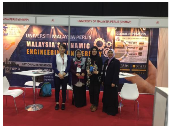
本校代表與馬來西亞及印尼代表合影