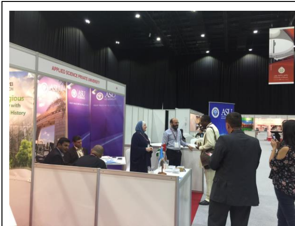
其他各校代表交流狀況-1