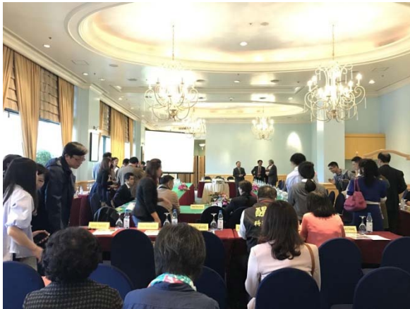
圖一：臺越學術交流座談會