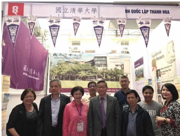
圖十：本校代表團與賀陳校長合照