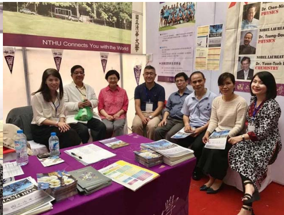
圖十一：本校代表團與河內傑出校友合照