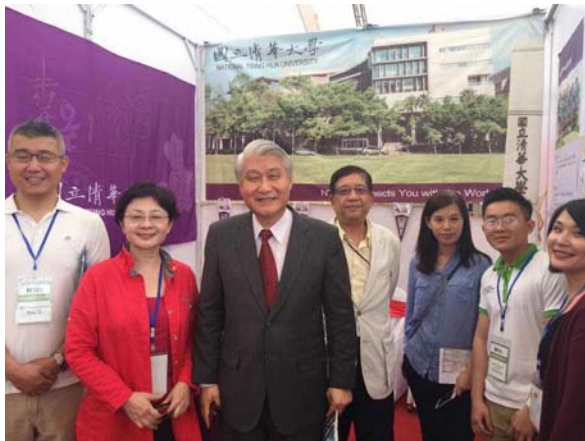
圖八：本校代表團與駐越代表處石大使合照