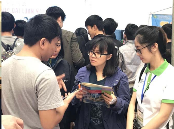
圖二：教育展攤位越南學生詢問入學資訊