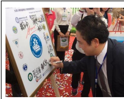
圖 3 太原大學教育展參展學校簽約儀式