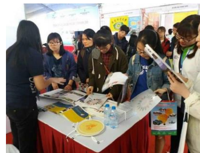
圖 6 河內人文大學教育展