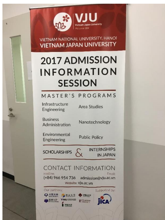
圖 4 日越大學碩士班招生海報