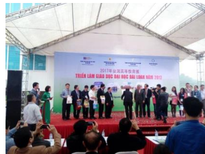
圖 2 太原大學教育展合影