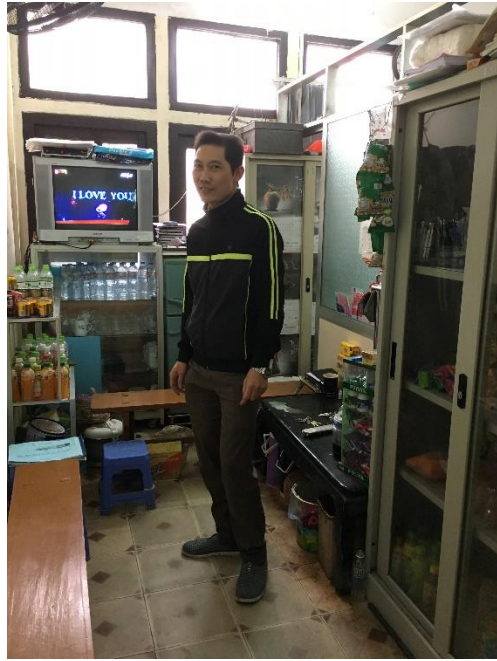
圖 2 校舍內的福利社

3月15日上午11時，楊武勳國際長參訪日越大學（Vietnam - Japan University）該校由日本與越南政府共同出資設置於河內市，在2013年通過設置法案後，成為河內國家大學系統的一員。2016年正式招收研究生，設定未來目標招生人數為6,000名，並包含博、碩、學不同階段的學生。當日由日越大學古田元夫校長、東京大學清水剛教授、日越大學碩士課程小樋山覺首席顧問、加藤敦典講師接待。古田校長表示日本政府開發援助的方式相當多元，近年以人才培育作為主流之一，因此該校使命即是培養越南當地與知悉越南的外國人才，因剛招生，目前僅有碩士課程。日本籍教師約佔一半，由日本知名大學輪流派遣前來任教。課程包含區域研究、公共政策、企業管理、奈米科技、環境工程、社會基礎、氣候變遷與日語課程。由該校的設置方式、課程架構與教師成員的特殊性可以瞭解越南目前因應經濟發展，結合外國政府人力與財力，大舉投資高等教育。