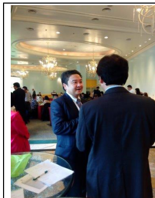
圖 1 臺越交流會