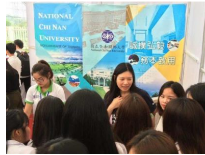
圖 4 太原大學教育展