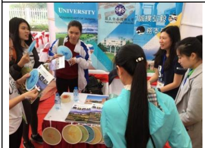
圖 5 太原大學教育展