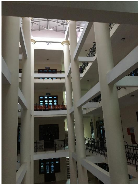
圖 6 太原科技大學行政大樓一景