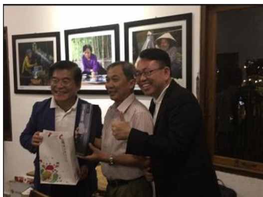
古源光校長(左)贈禮感謝接待的肯特大學副校長(中)，右為國際長