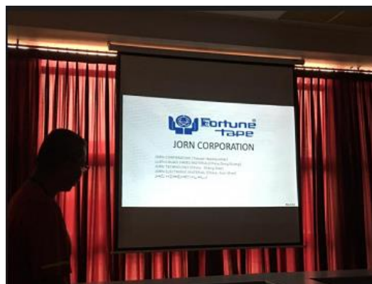
越南臺商眾安企業對來訪的屏東大學團隊進行簡報