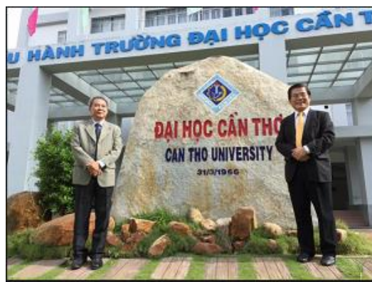
古源光校長與友校副校長在肯特大學校園留影