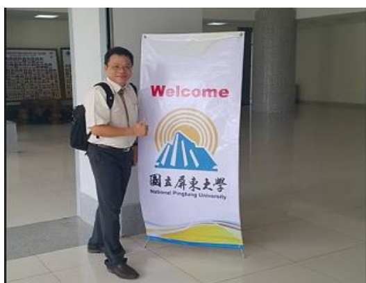
越南肯特大學用心布置安排歡迎國立屏東大學訪問團隊