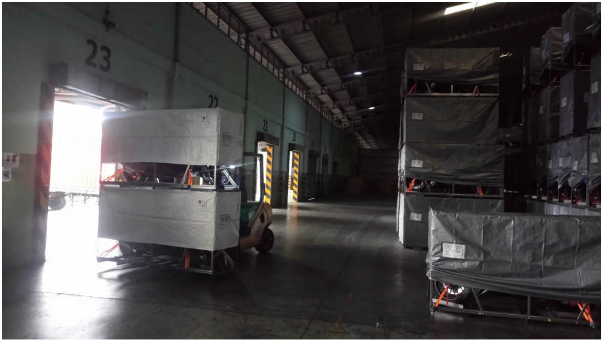
TUNGYA COLLINS TERMINAL 倉儲出口倉(某國際機車品牌置放區)