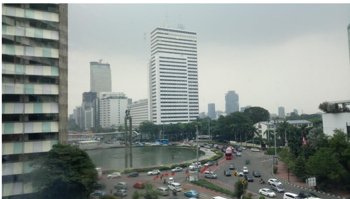
雅加達市中心市容

繼參訪印尼泗水後，本公司接續安排至印尼雅加達，探查印尼第一大港丹戎普祿港附近倉儲物流設施，並至台商於印尼雅加達投資之 TUNGYA COLLINS TERMINAL 交流參訪。雅加達（JAKARTA）為印尼全國政治及經濟中心，人口約 1,200 萬（含移動人口），面積 650 平方公里，同時也是外國公司及外國人居住的中心，經本次參訪觀察，雅加達工商大樓林立，消費市場蓬勃，知名歐美廠牌多已進駐或駐點生產，國際化程度高且當地消費能力亦較泗水高，可從其繁榮市景、購物中心及國際連鎖知名飯店林立顯見消費市場成長態勢及趨勢，亦可反映出該地進出口貨物之需求與量成長之榮景。