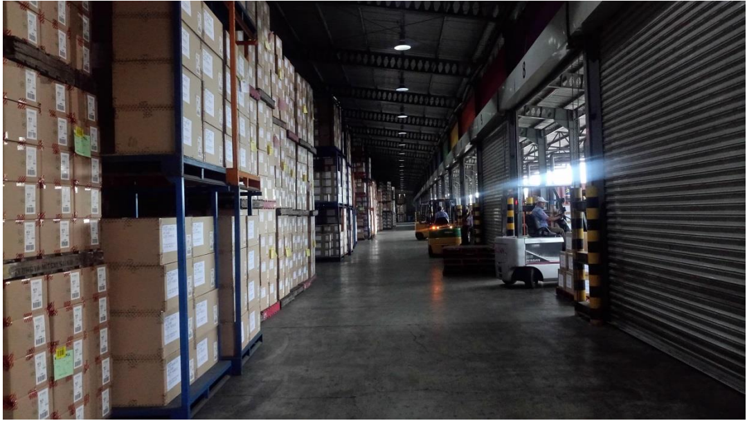
TUNGYA COLLINS TERMINAL 倉儲出口倉(某國際運動品牌儲放區)