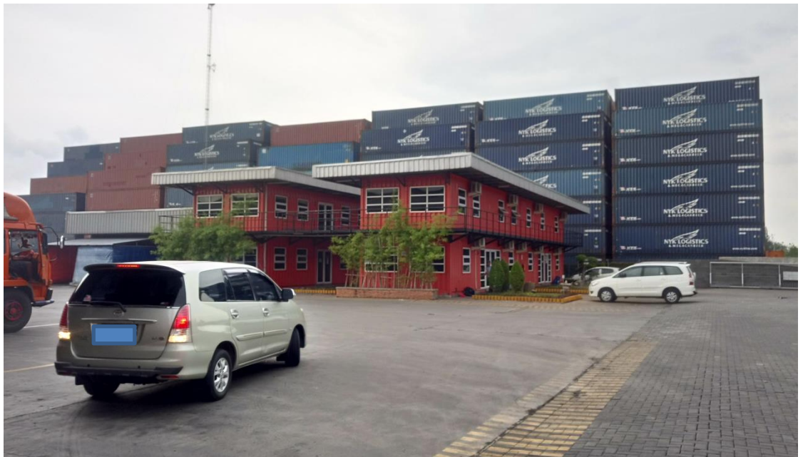
TUNGYA COLLINS TERMINAL 貨櫃堆置區

本次參訪台商投資之 TUNGYA COLLINS TERMINAL，實地參訪其位於雅加達的印尼總部據點，該處距港口約 20 分車程，為 45 公頃的物流中心，整區為保稅區並有海關進駐，該區現規劃為物流中心分區招租，已有不少物流業者與貨櫃場進駐經營，該業者於 20 年前已來印尼進駐開拓，分享近幾年印尼發展神速，消費性品牌大廠紛紛進駐，其倉儲與貨櫃量成長可為見證，惟當地基礎建設部分仍有很多改善空間，凡通勤時間各類人車雜流匯集，塞車情形十分嚴重，為當地經營進行物流運輸之風險與隱性成本。另當地勞動市場意識抬頭，政府對於勞力市場的最低薪資要求經與資方協商結果逐年調增，調漲幅度皆為成本所在，未來如有投資應多加考量。雅加達的貨櫃與倉儲物流設施規劃顯然較為完備，動線規劃與鄰近道路設施發展顯見較泗水之水平與規格高