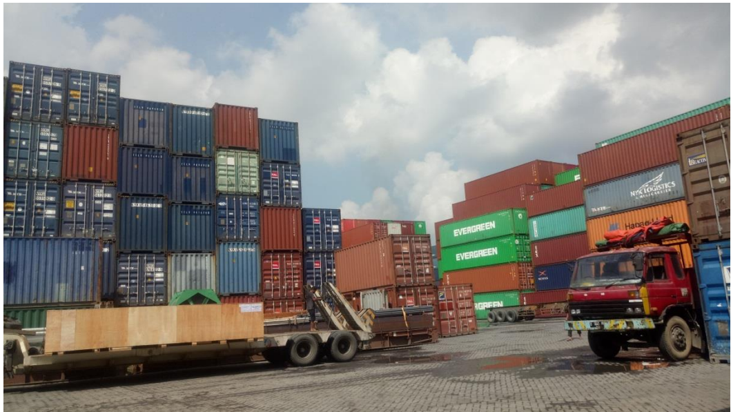
當地台商業者 TUNGYA COLLINS TERMINAL 櫃場堆儲情形(滿載)