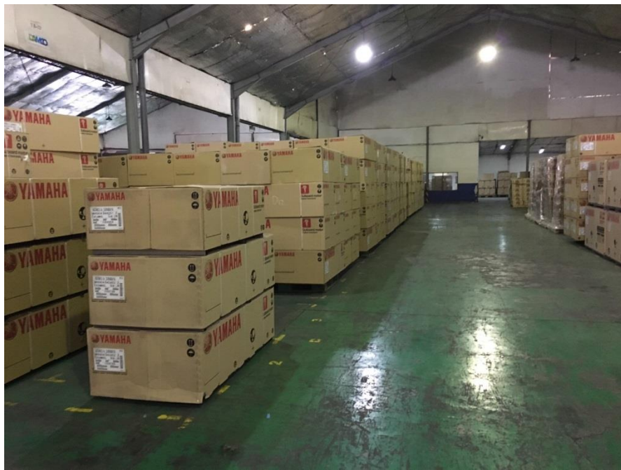
當地台商業者 TUNGYA COLLINS TERMINAL 倉儲裝載情形