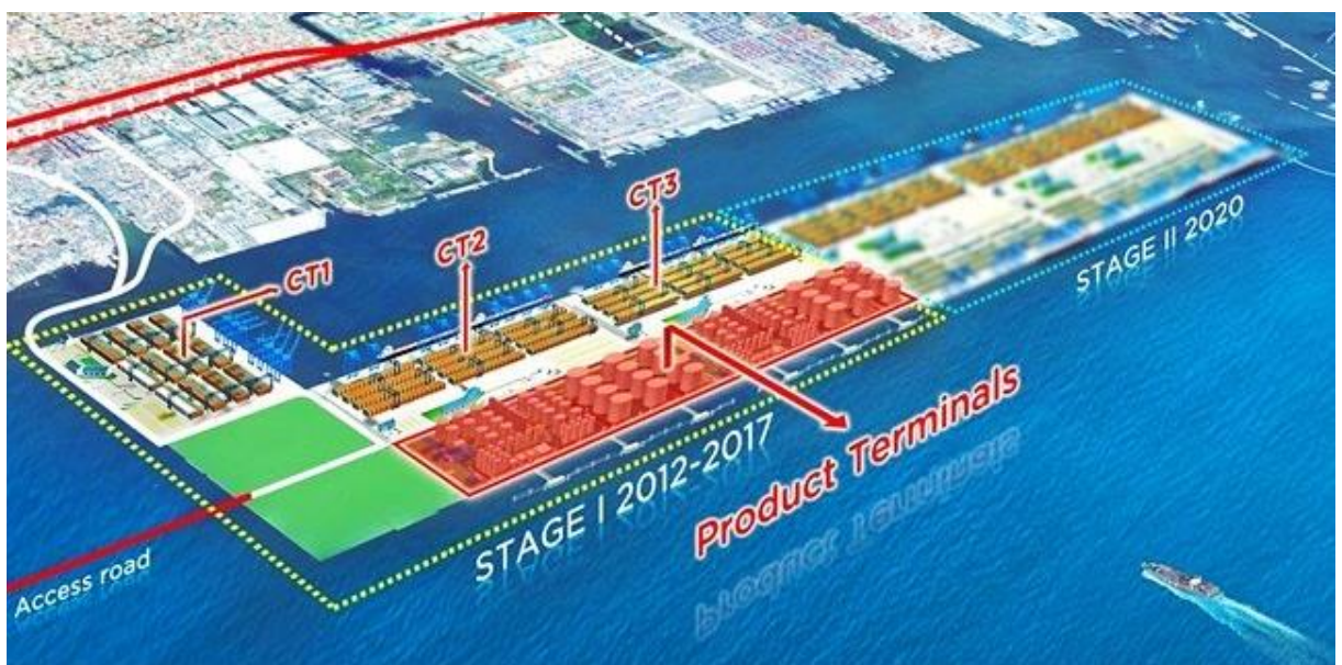
新丹戎普祿港規劃圖

丹戎普祿港為提升港口服務效能，於 2007 年港口發展主計畫中規劃建設新丹榮普祿港，投資金額為 24.7 億美元，預估 2023 年完成二階段開發建設。新丹榮普祿港第一階段開發面積 172 公頃，共有 3 座貨櫃碼頭與 2 座散裝碼頭，貨櫃碼頭總長度 2,400 公尺、水深 16 公尺，設計年貨櫃裝卸量為 450 萬 TEU，可供 18,000 TEU 貨櫃船舶彎靠。目前 Container Terminal 1 已於 2014 年完工，由 IPC 與三井物產、NYK 及新加坡 PSA 合組 PT New Priok Container Terminal One (NPCT1) 公司經營，Container Terminal 2、3 則預於 2017 年底完工。第二階段開發為 2018-2023 年，總開發面積 179 公頃，共 4 座貨櫃碼頭，貨櫃碼頭總長度 4,000 公尺、水深 16 公尺，設計年貨櫃裝卸量為 800 萬 TEU。