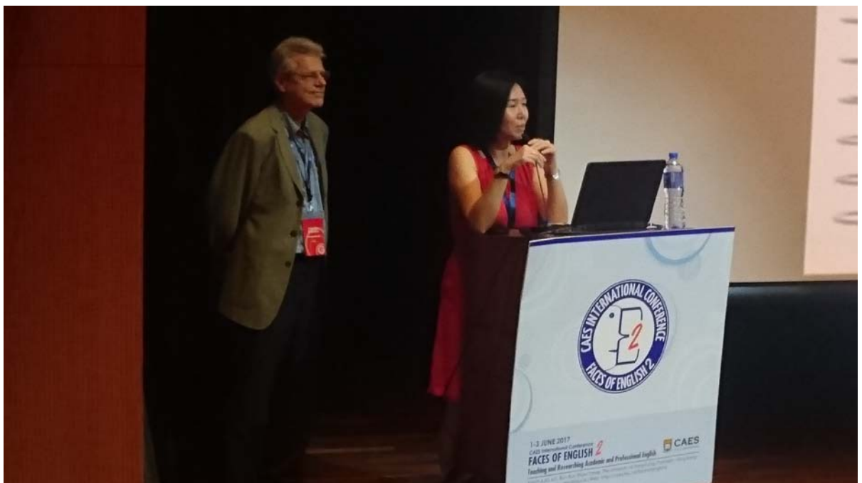
圖六，Flowerdew 教授專題演說