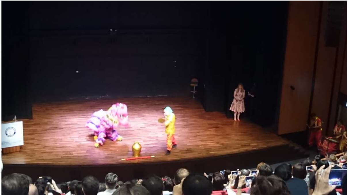
圖七，開幕舞獅表演