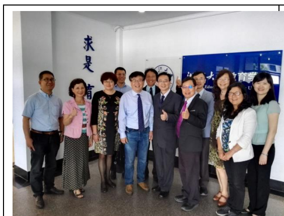
代表團於教育學院合影

臺灣清華大學及浙江大學本已簽訂交流合作意向書，兩教育學院樂意於此基礎上，以院對院的方式簽署雙聯學位，惟對於學生是否需完成兩本碩士論文以取得兩校之學位，仍待深入討論。