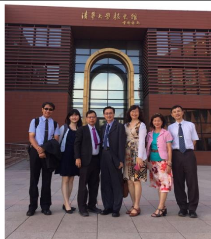
參觀北京清華大學校史館