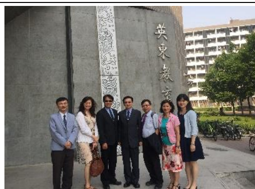
代表團於教育學部前大樓合影

10:30 前往北京師大智慧學習研究院，參觀智慧學習研究院的設施及工作環境。智慧學習研究院是北京師大於 2015 年 3 月下設的綜合性科學研究、技術開發和教育教學實驗平台；研究院的目標是推動教育技術學及相關學科建設，增強教育數位學習人才的培育，社會服務能力，提高教育產品研發能力，以促進數位技術語教育的雙向融合，支持終身學習的智慧學習環境和平台。