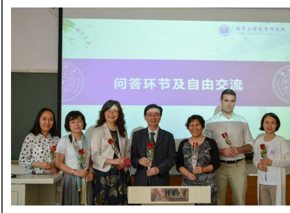
宣講會所有講者合影