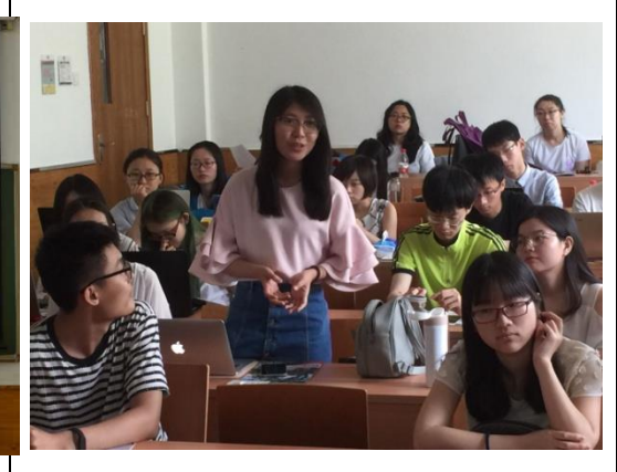
參與夏令營宣講會的學生提問踴躍