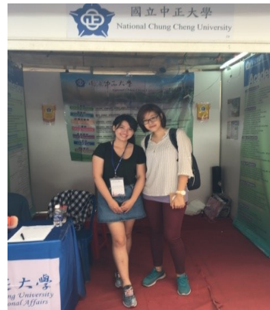
在胡志明市國家所屬人文社會科學大學遇到正在該校教授學生華語文之本校外文所畢業校友。