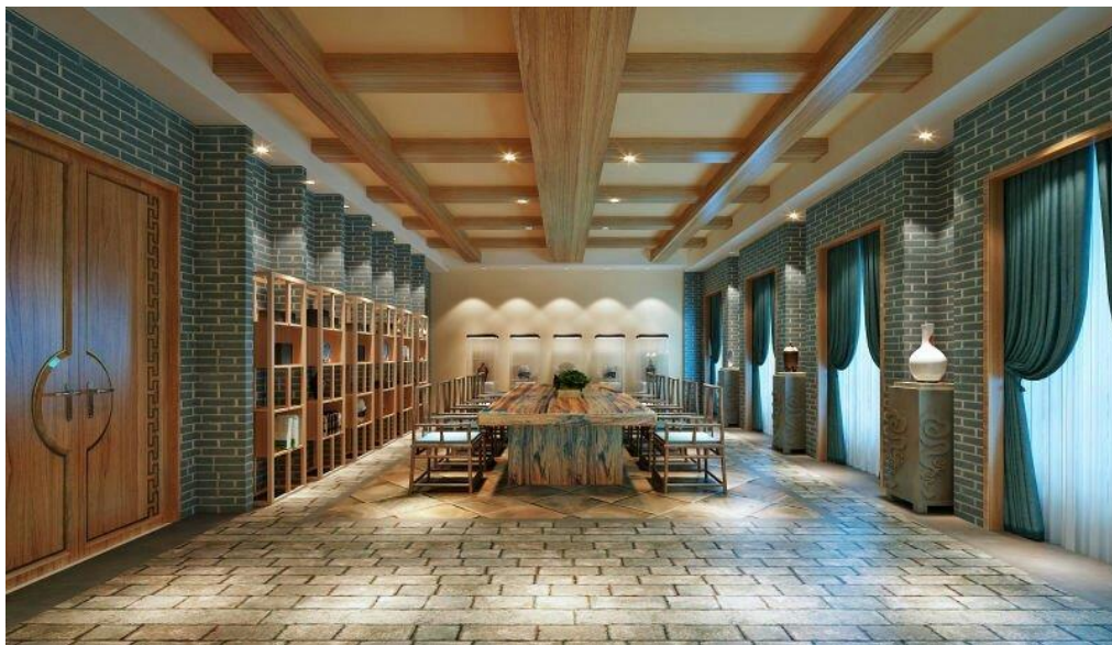
圖一、民宿研究中心建設藍圖

學校規模，不斷的擴大中，目前已成立國家級主題式學院研究中心的方式進行研究，其中目前成立之研究中心與本校有關的有川菜研究中心與民宿研究中心。而其中民宿研究中心之藍圖已完成，希望未來能有學校教師定期進駐共同研究。