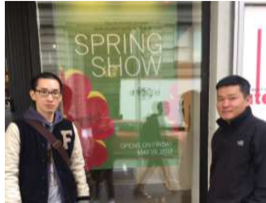
圖一：AAU 並沒有集中的校園，各大樓都有固定的標誌 圖二：藝術中心展示學生作品