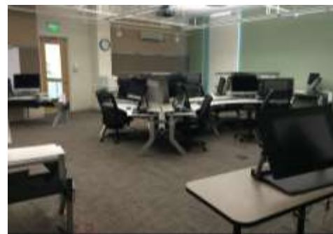
圖說：該校完善的設備與教學教室