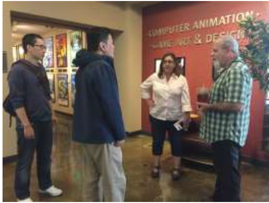
圖說：與該系主任與專任教授討論培訓事宜