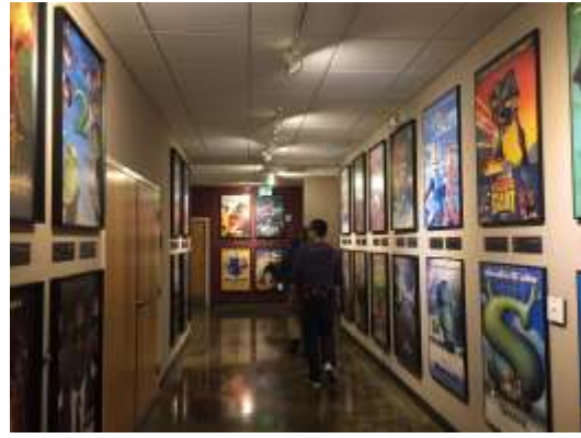
圖說：動畫系校友為好萊塢動畫主力