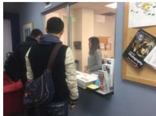
圖五：AAU 擁有眾多亞裔行政人員是其特色