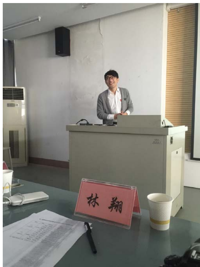
會議主持—蘇州科技大學城鄉規劃系副系主任