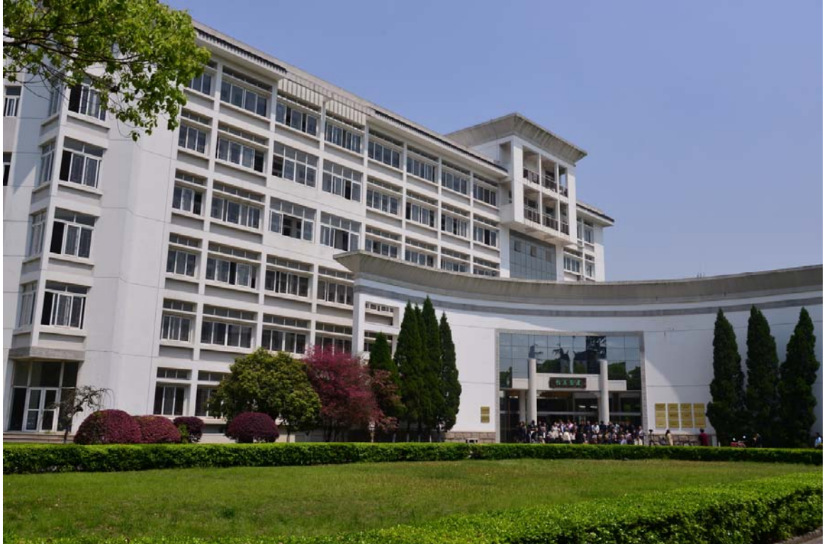
蘇州科技大學建築與城市規劃學院城鄉規劃系