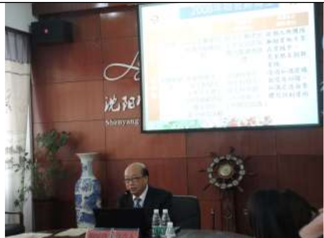
本系博士生進行學術論文發表。