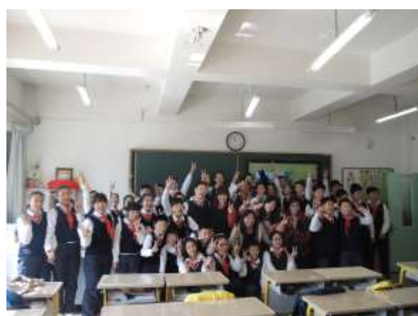
參訪瀋陽市渾南區第二小學