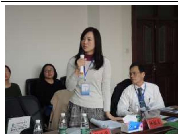
本系博士生針對學術會議發表內容進行提問。