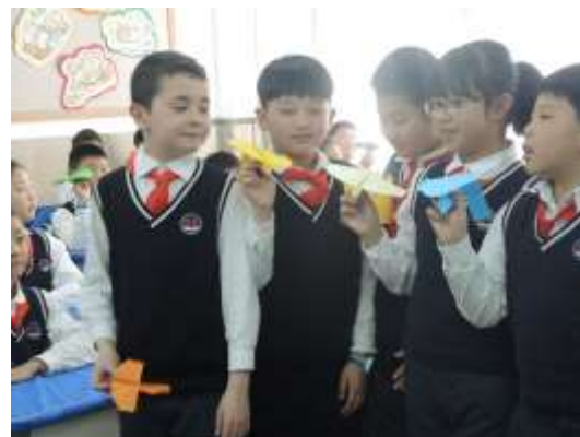
渾南區第二小學學生示範班本課程特色。