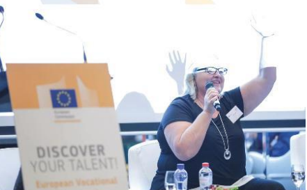
Employment, Social Affairs and Inclusion