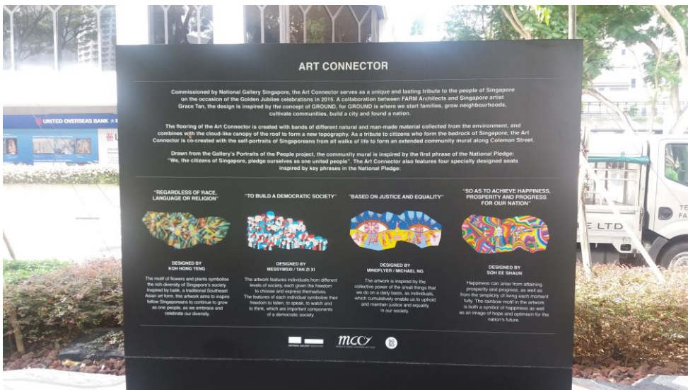
(新加坡國家藝廊規劃特展)