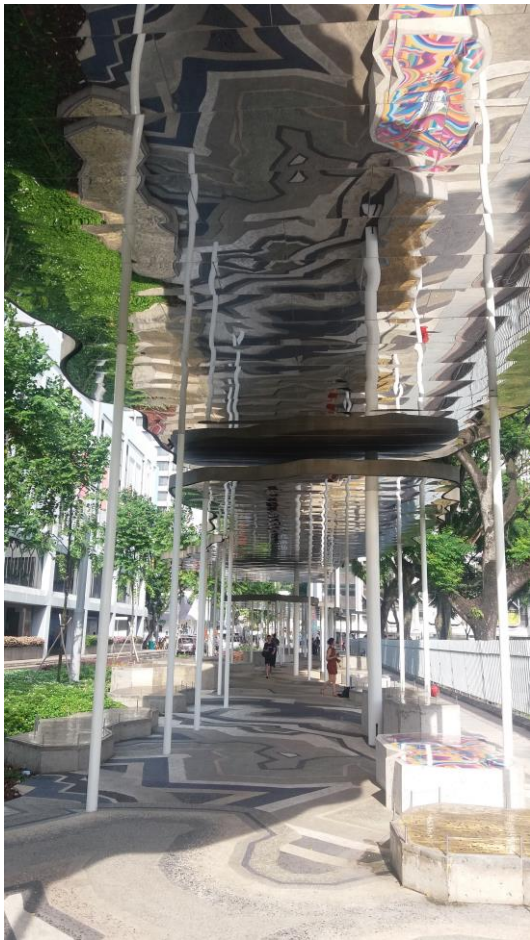
(新加坡國家藝廊規劃特展)