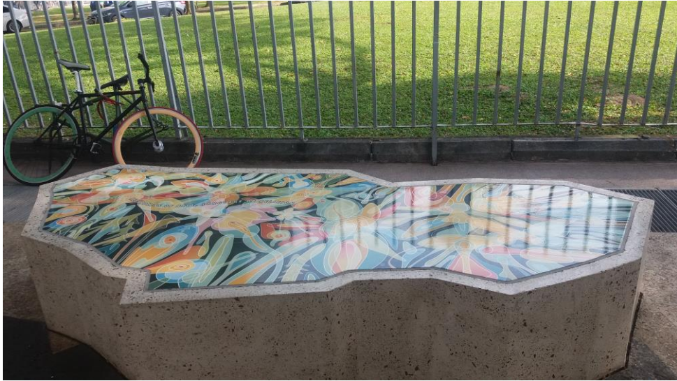
(新加坡國家藝廊規劃特展)