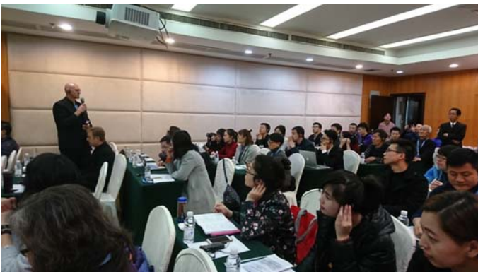
西方國家毒品處遇論壇開會情形