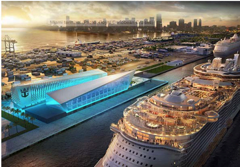
圖 12 皇家加勒比郵輪耗資 200 萬美金於 Port Miami 興建專屬旅運大樓 -Crown of Miami