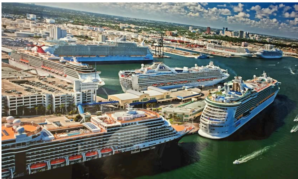
圖 16 Port Everglades 曾創下當日同時 8 艘郵輪母港靠泊(本圖為翻拍) Port Everglades 擁有目前全球最大的旅客服務中心 18 號碼頭，由皇家加勒比郵輪集團專用碼頭，此行參訪當日，因 Celebrity cruise 在 18 號碼頭進行母港作業，無法入內一探究竟，港區人員改至安排參訪

Port Everglades 為全球最忙碌的郵輪母港之一，歷年排名與 Port Miami 時互有先後，二者可並稱世界郵輪首都，郵輪收益佔全港收入 6 成，共有 11 座郵輪旅客中心，目前有兩艘 22 萬噸級郵輪以此為母港。曾創下當日同時 8 艘郵輪母港靠泊，接待 45000 名旅客通關作業的輝煌紀錄。