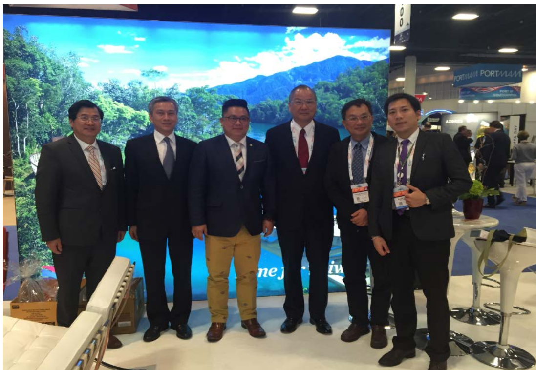
圖 2 臺灣港務公司、交通部觀光局、駐邁阿密台北經濟文化辦事處代表合影

本次出國參展主要的目的有三項：(1)拜會參展之郵輪航商，行銷港口及觀光資源。(2)與觀光局、旅行業者之合作，透過亞洲郵輪聯盟(Asia Cruise Corporation)，推廣台灣港口及周邊景點之國際能見度，吸引郵輪業者佈局台灣港口航線。(3)結合亞洲港口資源，共同爭取郵輪業者，本公司與新加坡等各港組成之亞洲郵輪碼頭協會(Asia Cruise Terminal Association, ACTA)，聯合交流，國際行銷亞洲航點魅力。