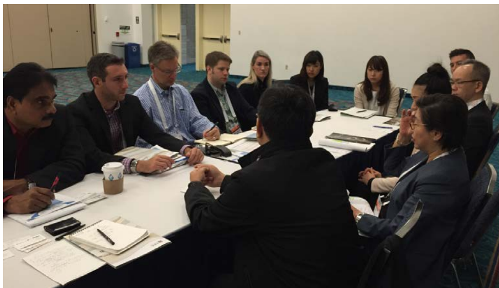
圖 5 與亞洲郵輪碼頭協會會員代表聯合拜會皇家加勒比郵輪 Chirst Allen 副總裁。

皇家加勒比郵輪集團航線規劃副總裁 Chirst Allen 指出，皇家加勒比郵輪現階段在亞洲發展重心仍以中國大陸客源為主，郵輪業界普遍都希望兩岸問題及中韓關係降溫情勢能及早改善，提升整體亞洲郵輪市場發展。