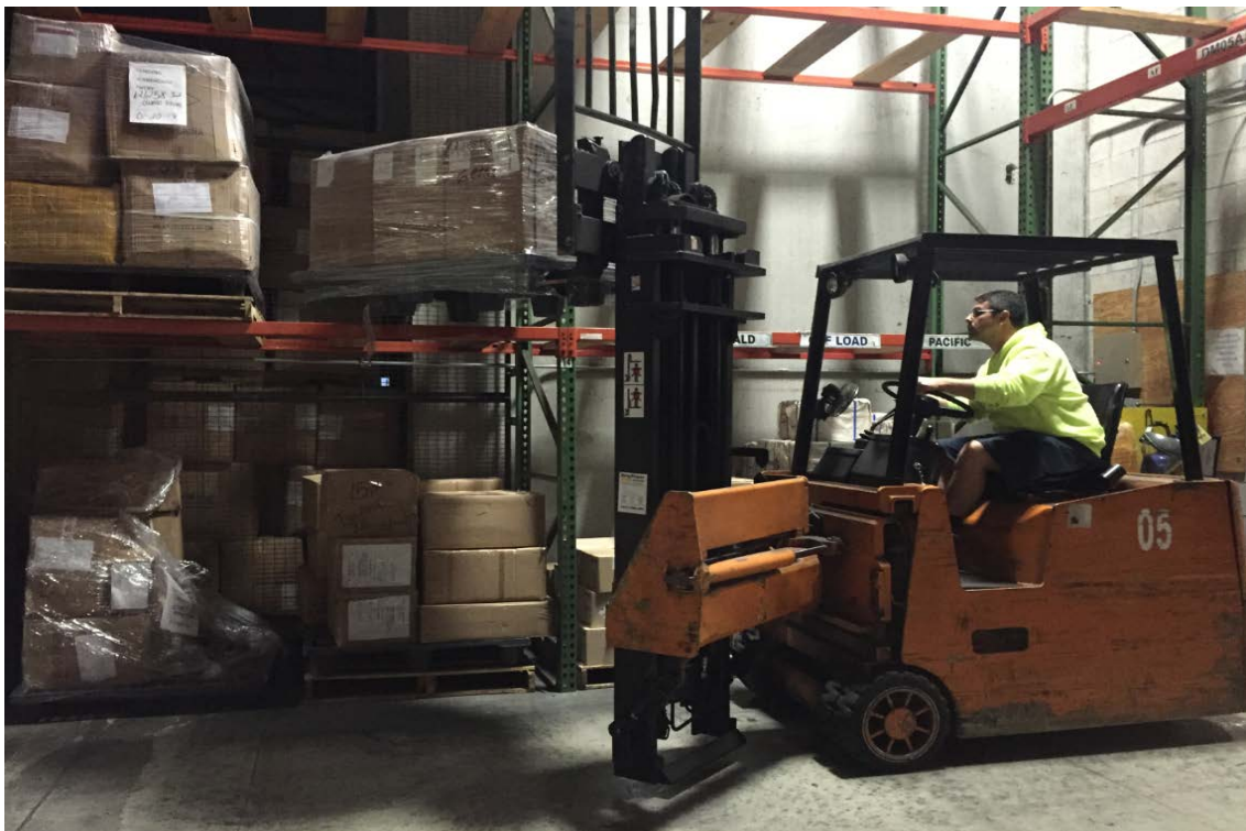
圖 20 荷美郵輪物流中心堆貨機可橫向直接上架，降低迴轉空間