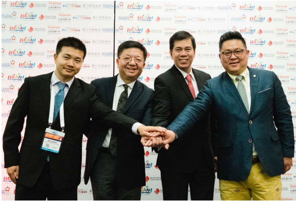
圖 9 亞洲郵輪聯盟(Asia Cruise Cooperation)聯合行銷活動