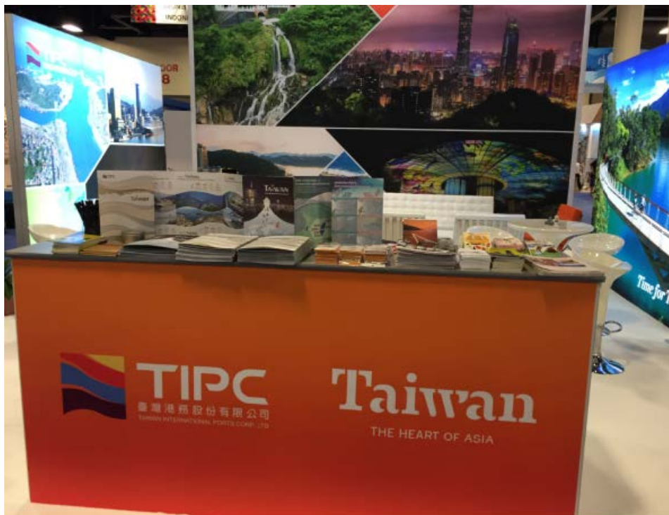
圖 3、4 交通部觀光局及臺灣港務公司共同規劃展攤設計