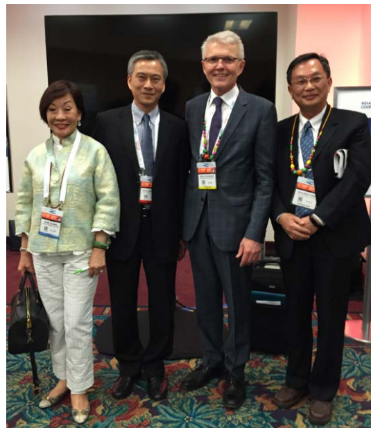
圖 10-11 亞洲郵輪聯盟會員國共同辦理雞尾酒會，邀請國際郵輪代表與會