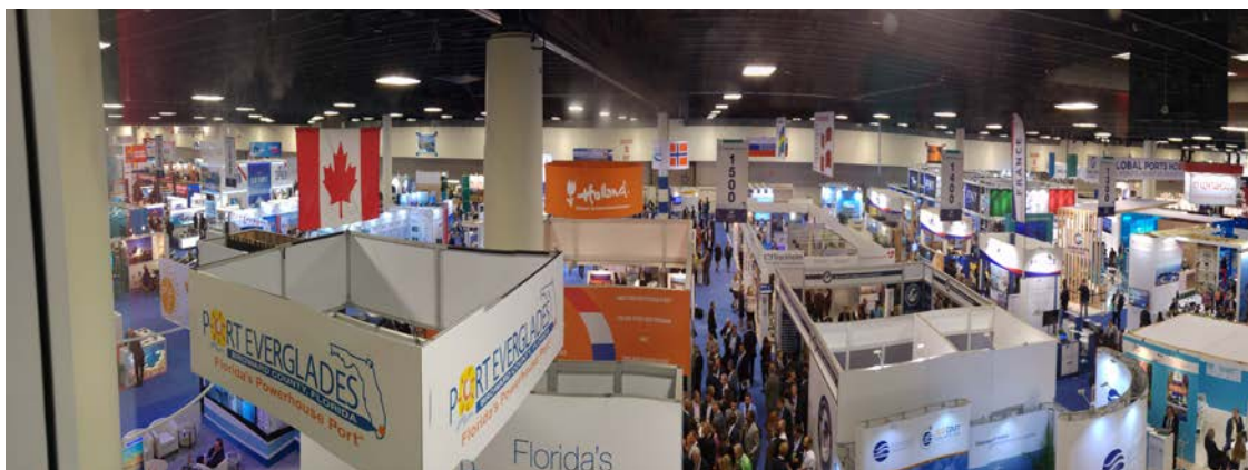
圖 1 全球郵輪展(Cruise Shipping Global)為每年國際郵輪產業重要盛事

邁阿密及羅德岱堡為全球前二大郵輪母港所在地，同時也是全球知名郵輪觀光盛行的度假勝地，兩地距離車程不到 40 分鐘，位於美國面向加勒比海、墨西哥灣的主要出入門戶，地理位置上具有相同優勢。其中邁阿密郵輪產業鏈完整，國際知名郵輪總部及上下游供應鏈產業多聚集於此，而成為全球郵輪基地。另一方面，羅德岱堡 Port Everglades 近年積極提升港埠設施，成功吸引成為全球最大郵輪-皇家加勒比海洋綠洲號及魅力號作為母港，一躍成為全球重要郵輪母港。