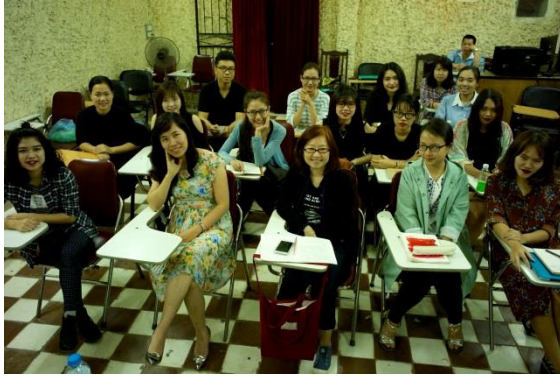
參加工作坊的學生與老師合照