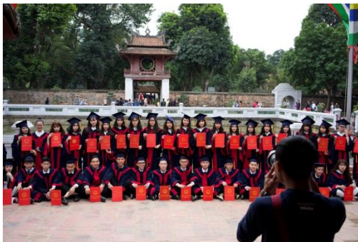
文廟拍畢業照對越南學子是重要儀式