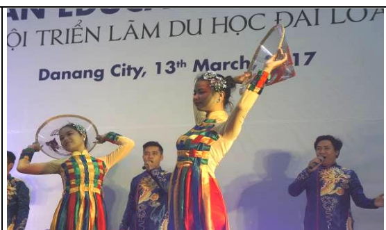
圖 20 峴港維新大學教育展開幕表演