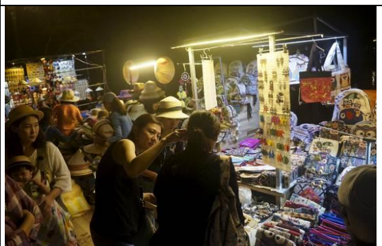
圖 16 會安古城河市集