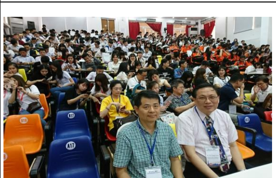
圖 18 峴港維新大學教育展開幕