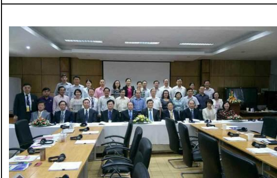
圖 13 人文社會科學大學教育展座談