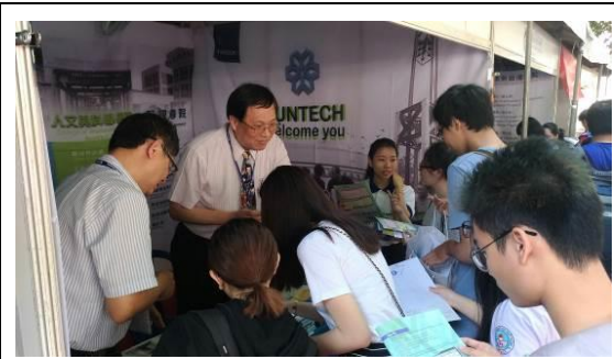
圖 12 人文社會科學大學教育展