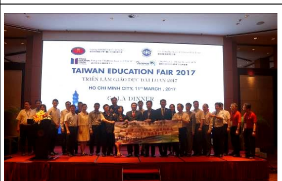
圖 14 教育展晚宴/ Equatorial Hotel