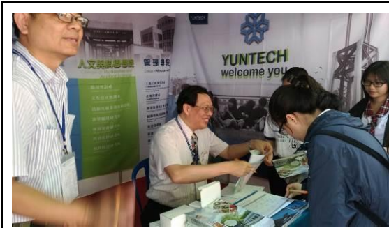
圖 11 人文社會科學大學教育展