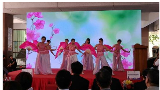
圖 10 人文社會科學大學教育展開幕式