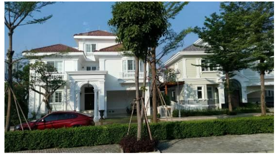
圖 4 參訪富美興企業建案