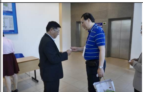
圖 24 拜會峴港大學與校長交換名片