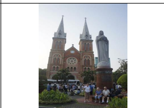
圖 26 參觀西貢聖母主教座堂