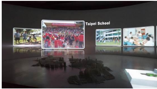
圖 3 臺商富美興企業簡報