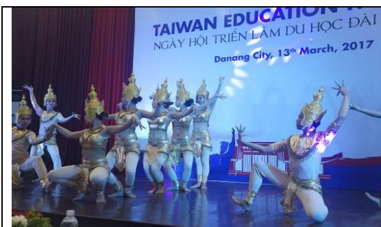
圖 19 峴港維新大學教育展開幕表演