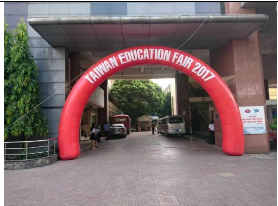
圖 8 胡志明市人文社會科學大學展場