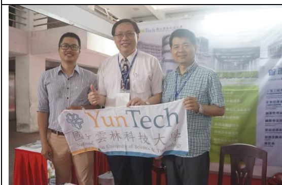
圖 21 峴港維新大學教育展