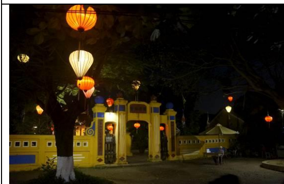
圖 15 會安古城河歷史建築