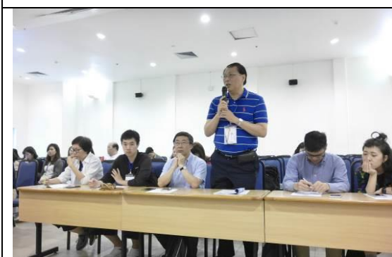
圖 25 參訪峴港大學簡介雲科大