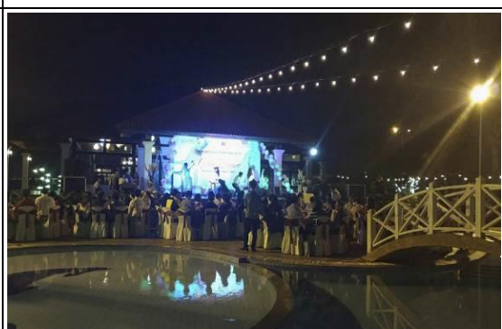
圖 22 峴港 Gala Dinner