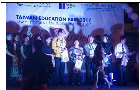
圖 23 峴港 Gala Dinner