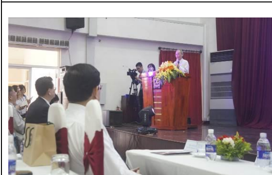
圖 17 峴港維新大學教育展開幕