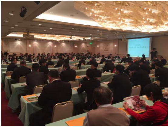
2017年日台冷凍農產貿易懇談會-開幕