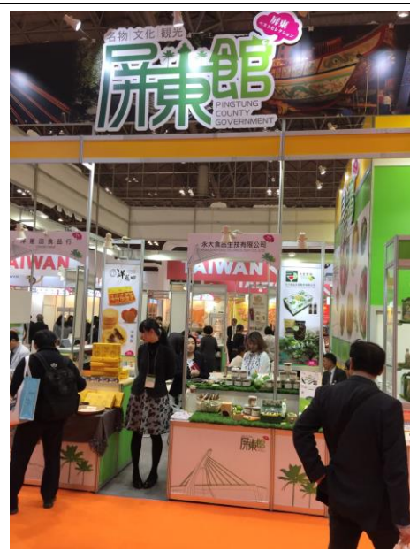
2017年東京食品展一隅(屏東館)