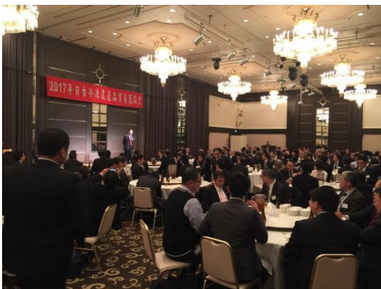
2017年日台冷凍農產貿易懇親會致辭