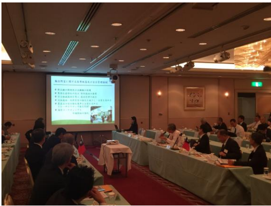
農糧署陳建斌署長簡報 外銷蔬菜安全管理體系