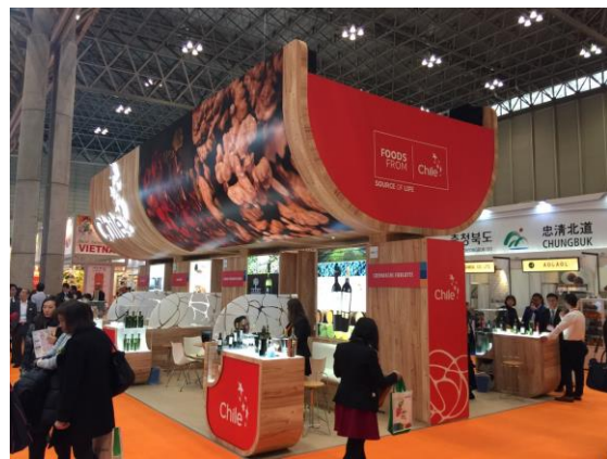
2017年東京食品展一隅(智利館)