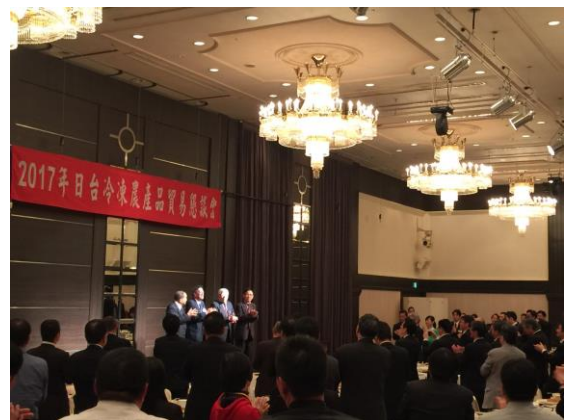
2017年日台冷凍農產貿易懇親會閉幕