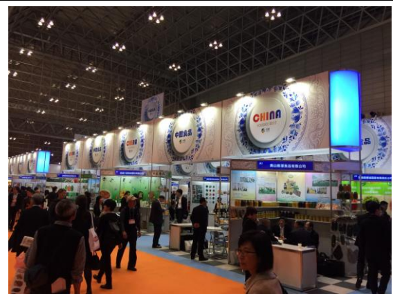
2017年東京食品展一隅(中國館)