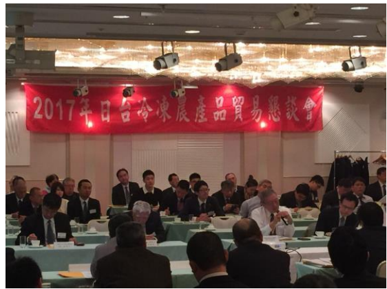
2017年日台冷凍農產貿易懇談會-Q&A