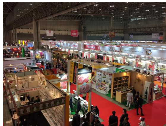
2017年東京食品展一隅(臺灣館及日本廠商展區)