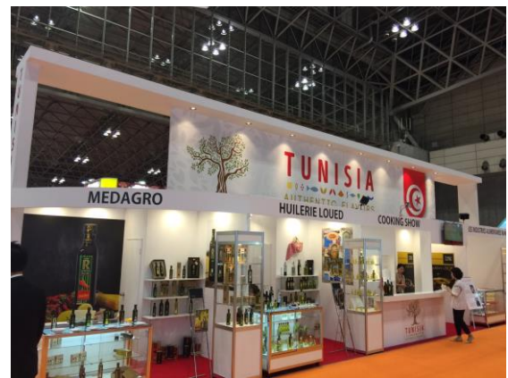
2017年東京食品展一隅(突尼西亞館)