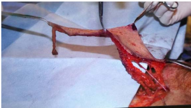
圖：SCIA flap 可以做成非常薄的皮瓣，讓重建的品質更符合實際需求。通常可以用來重建手部的皮膚缺損，不論是外觀和功能都十分良好。