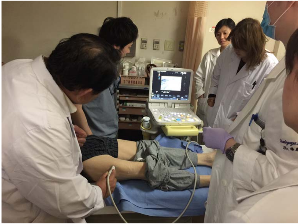
圖：開刀前的評估常常會利用許多儀器，像超音波，或者是特殊的紅外線照相機，來提供許多肉眼看不到的資料，使手術的決定更有說服力。