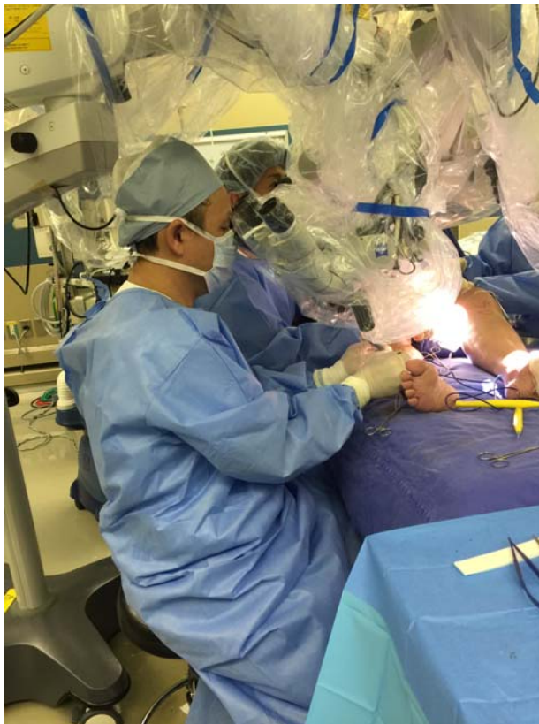
圖：能夠直接參與其中，所獲得的臨床經驗是無可比擬的，讓我有信心在回國之後，能夠立即將所學應用於自己的病人上。