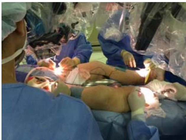
圖：日本人喜歡團體作戰，來節省手術的時間，同時使手術結果更有效率。因此經常可以看到多人同時手術的畫面。