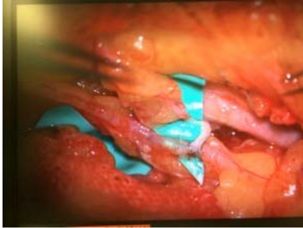
圖：超顯微手術與顯微鏡下淋巴管與靜脈的吻合實景。