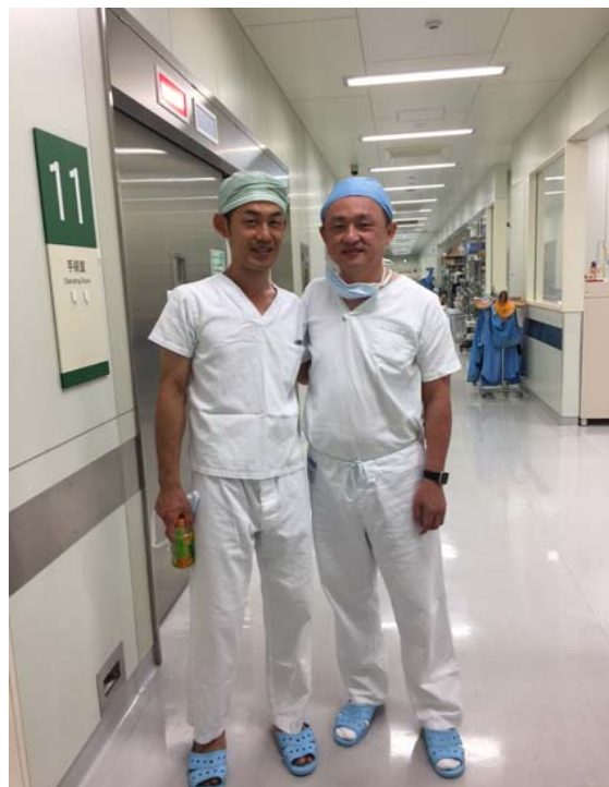
圖：感謝日本友人的協助，讓我在短短的兩個月之內收穫非常豐盛，留下了許多深刻的回憶