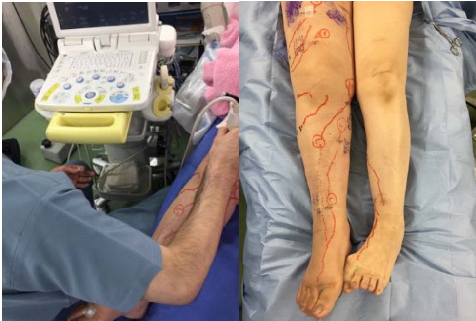
圖：如何在開刀前得知適當淋巴管與靜脈的位置，對於淋巴水腫手術來說非常的重要，有些時候可以利用各種的影像來收集資料，如超音波。這樣一來可以使手術更有效率。