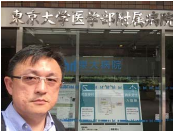
圖：第一天到東大病院報到。

感謝成大醫院的栽培，讓我有機會在短時間內，能夠前往日本東京大學附設醫院的形成外科參與超顯微(super-microsurgery)手術技術的訓練。我到日本的時間是從8月8號到10月8號整整兩個月的時間，在出發之前，必須先申請工作簽證，以取得暫時醫師資格，無法以觀光簽證前往。這是我第一次到日本的自由行，因此從住宿到交通乃至於飲食都必須一手包辦。因此在出發前，如何找到適當的住宿就花了許多時間再加上在東京的交通雖然便利卻也十分繁瑣，對於初行者的我來說又是一項挑戰，所幸我一個一個克服了。