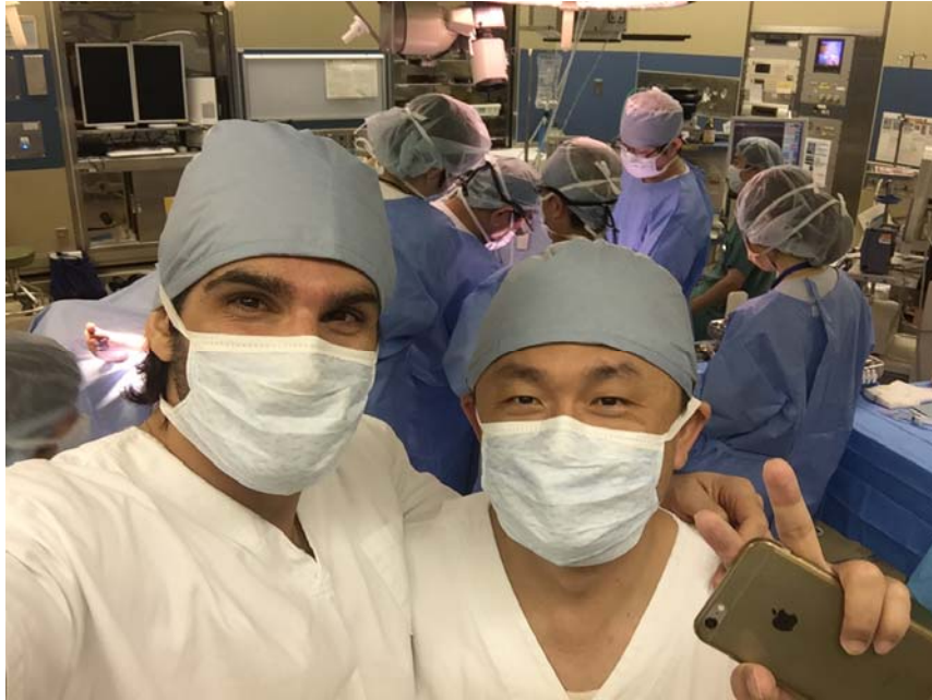
圖：與來自英國的整形外科醫師照相留念。

微手術的發展，並且引發興趣。與臨床以及基礎研究的老師合作，將淋巴水腫的課題進行更深入的研究，造福更多的南部鄉親。