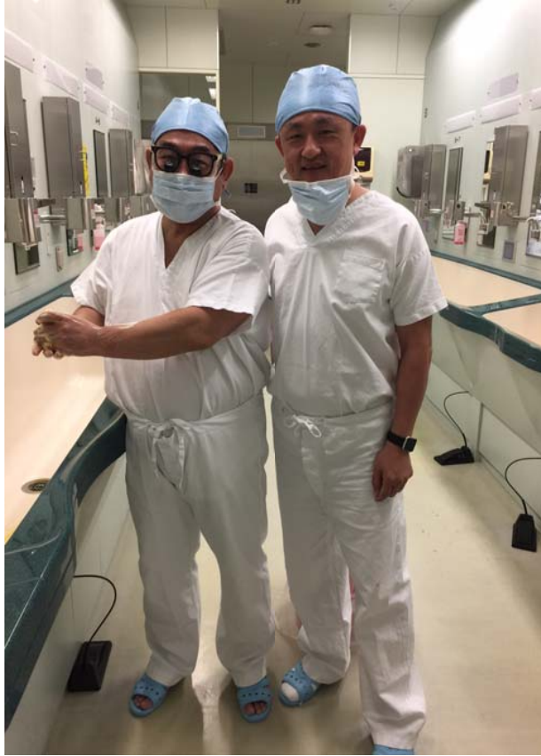
圖：與教授在手術房中合影留念。教授雖然年紀不小，但是體力驚人，常常可以開刀站一整天不會累。