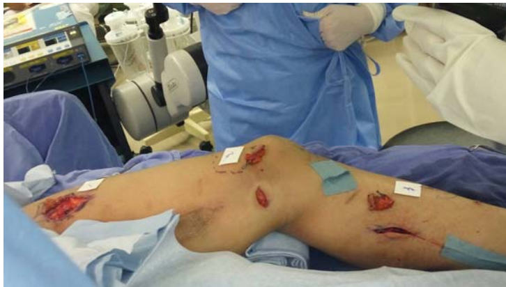
圖：利用超顯微手術治療淋巴水腫的病人，有很小的自由皮瓣來移植淋巴組織。

日本東京大學形成外科，是世界一流的顯微手術的專家的團隊。尤其是在 Koshima 教授的領導以及推展之下成爲世界著名的超顯微(super-microsurgery) 手術的聖地。特別是在淋巴水腫的手術治療方面更是獨佔鰲頭，因此，所有從事淋巴水腫手術的醫師們都會想要取經的地方，而我剛從美國芝加哥大學進修回來，也慢慢對於淋巴水腫的治療開始有了起步。而真正會想要到 Koshima 教授的團隊參觀，是因為在今年四月初，參加了第六屆世界淋巴水腫醫學會巧遇了 Koshima 教授，從他的口中知道日本有一個專門爲國際學者進行的訓練計劃 (Advance clinical microsurgery training program)，希望原本就學有專精的醫師能夠在短期內，不需要接受日本醫師國家考試就可以在日本境內治療病人，更可以在手術台上面直接參與手術治療病人，這樣的訓練計劃對我來說非常的珍貴，不但可以親身去學習大師的想法，並且同時親身參與臨床的治療，甚至於手術台上的訓練，非常難得。而這一次，到東京大學參觀訪問，並接受實際的臨床訓練，不外乎就是希望把治療淋巴水腫的手術技術，帶回本院免除南台灣地區的民眾無處治療的窘境。