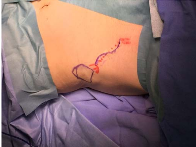
圖：這是一個 SCIA Flap 手術設計圖，圖中表現的是要摘取腹股溝附近的組織。