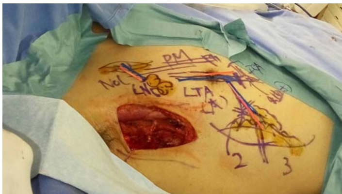
圖：利用胸前的小的皮瓣組織，減少供皮區的傷害