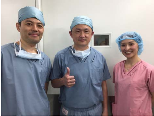
圖：非常開心與日本的友人合影，交流彼此的手術經驗與技術。