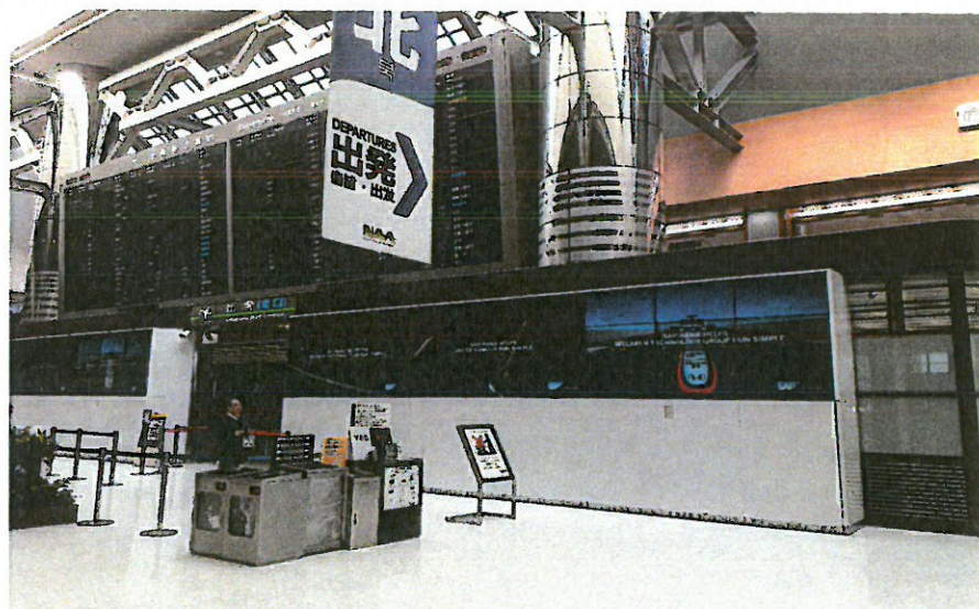
➤ 圖表 6 成田國際機場 T1 出境入關口宣傳影片播放點