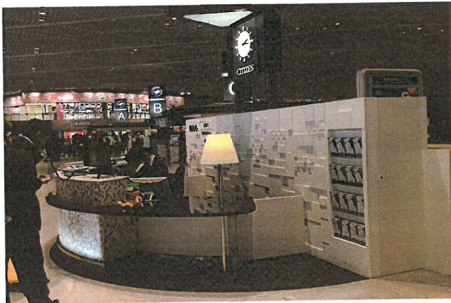
➤ 圖表 4 成田國際機場 T1 出境服務台文宣置放點