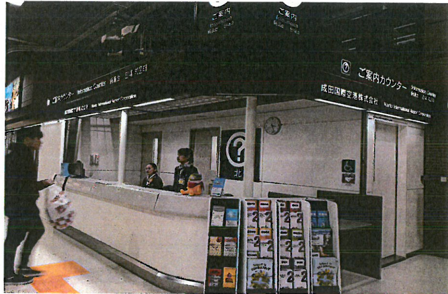
➤ 圖表 5 成田國際機場 T2 入境服務台文宣置放點