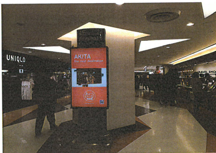
➤ 圖表 8 成田國際機場 T1 出境區宣傳影片播放點