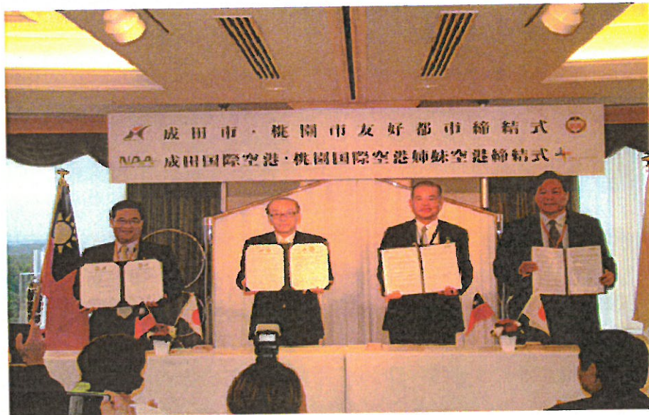
➤ 圖表1. 105.11.18 與成田國際機場簽署「姐妹機場合作備忘錄」

為加速達成服務合作之目標，桃園國際機場公司回訪成田國際機場洽商友好機場服務合作，實地考察成田機場服務設施及文宣品之宣傳模式，同時邀請觀光局東京事務所共同與會，共同推展旅遊觀光宣傳影片推播及機場宣傳展示區設置等服務合作，有效行銷台灣觀光。