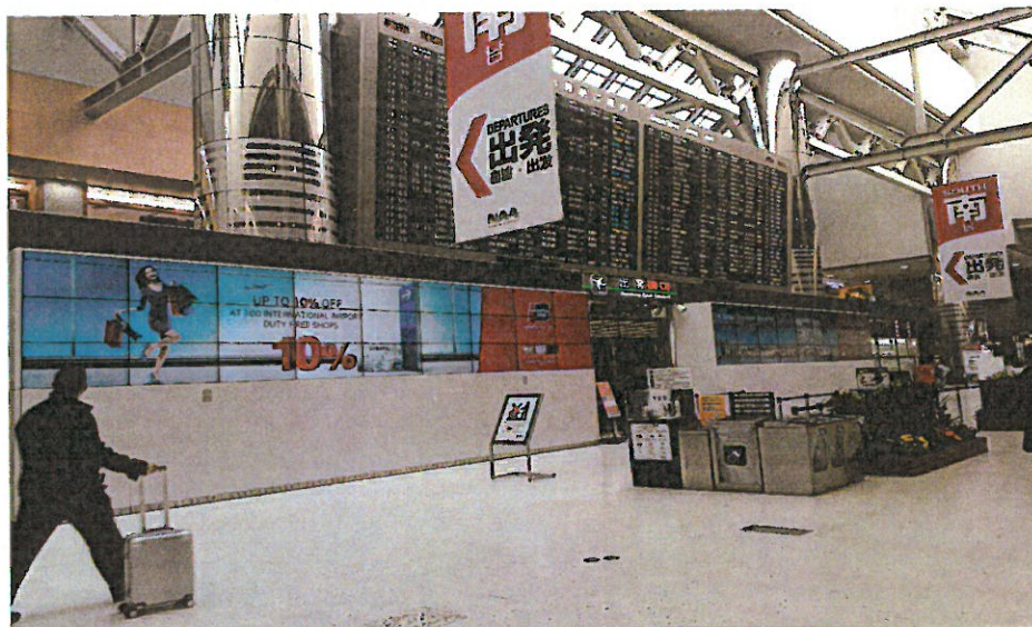
➤ 圖表 7 成田國際機場 T2 出境入關口宣傳影片播放點