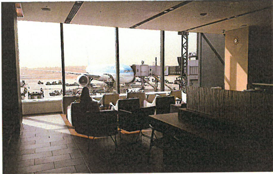
➤ 圖表10-2 成田國際機場自營貴賓室