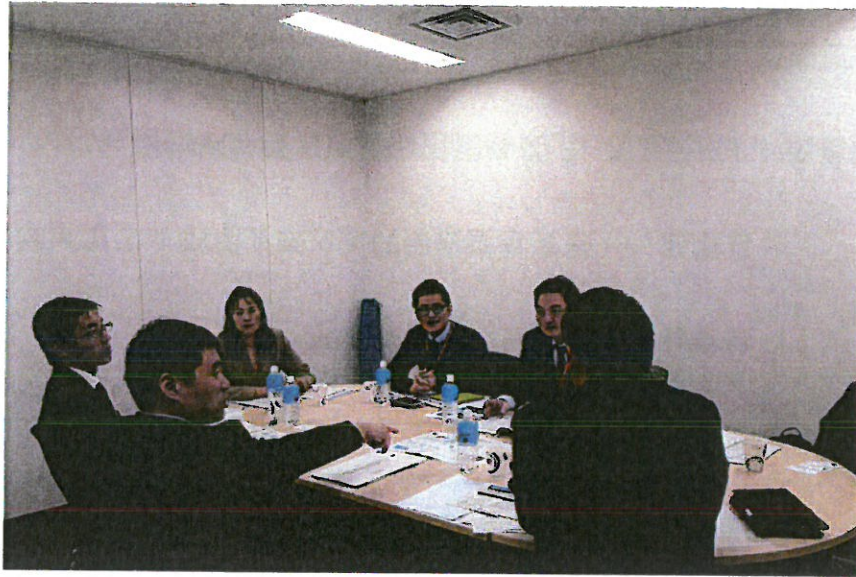
➤ 圖表 2 友好機場服務合作案討論會議