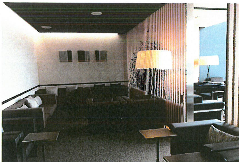
➤ 圖表10-1成田國際機場自營貴賓室

繼本公司於 105 年推動日本關西國際機場、北京國際機場、香港國際機場之機場貴賓室優惠活動後，於本次與日本成田機場服務合作計畫會議中，本公司提出貴賓室優惠活動計畫方案供成田國際機場參考，與會代表均表示考慮將其列為未來合作事項之一，並進行由成田機場自營貴賓室內部場勘，以做為未來合作之參考。