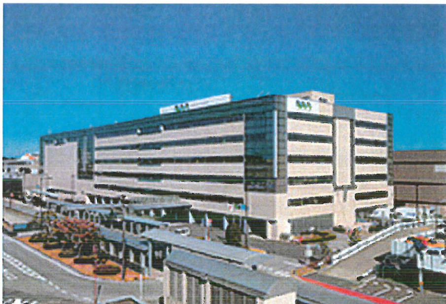
➤ 圖表10 成田國際機場株式會社外觀

成田國際機場株式會社日本政府的國營企業，成立2004年4月1日成立，資本額1000億日圓。公司成立之目的為透過成田國際機場高效管理，發揮國際樞紐機場作用，促進全球航空網絡發展，以世界頂級機場的水平為目標。同時提高航空運輸使用者便利性，促進航空整體發展，進而持續推動日本工業發展，及旅遊業等國際競爭力。