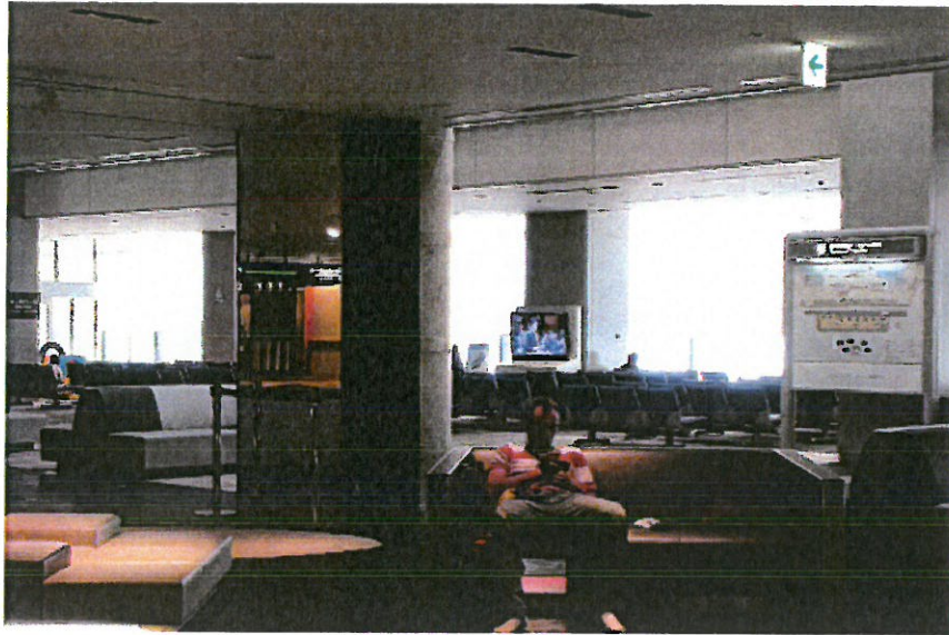
➤ 圖表 9 成田國際機場 T2 出境區宣傳影片播放點