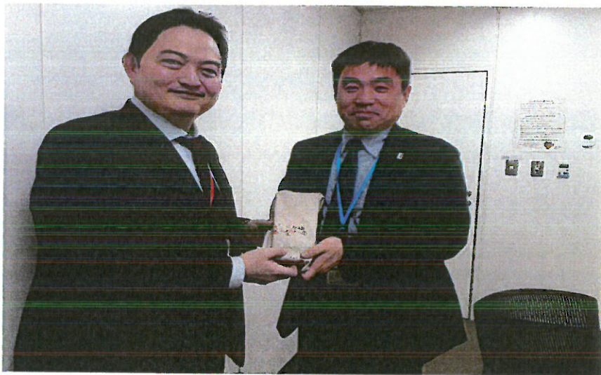
➤ 圖表 3 致贈成田國際機場代表禮品