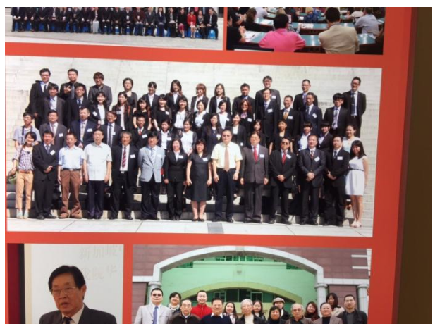
11/29 廈門大學海外教育學院院史室照片--本院應中系2012年與之交流留影