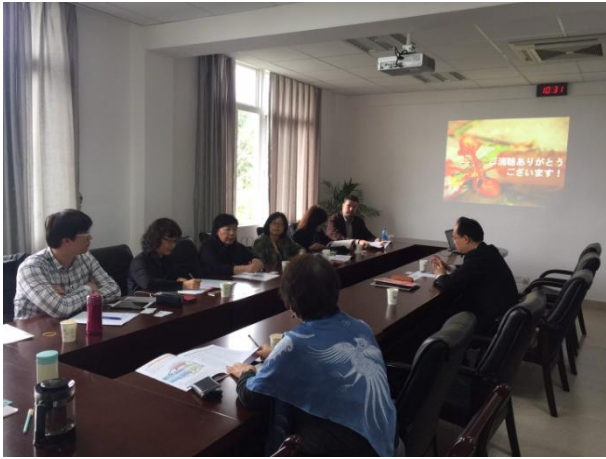
11/30 本團與廈門大學外文學院日語系座談