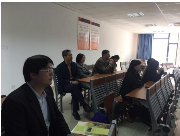
11/29 廈門大學海外教育學院初級班教學觀摩