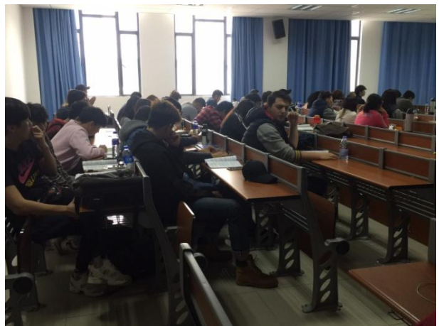
11/29 廈門大學海外教育學院中級班教學觀摩