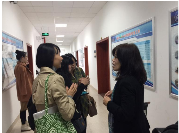
11/30 廈門大學外文學院日語系助教導覽外文學院歷史（走廊即是展場）