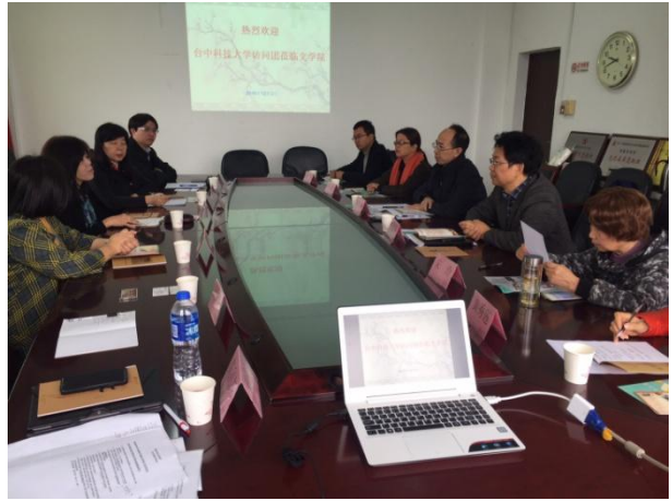
12/02 本團與福建師範大學文學院座談