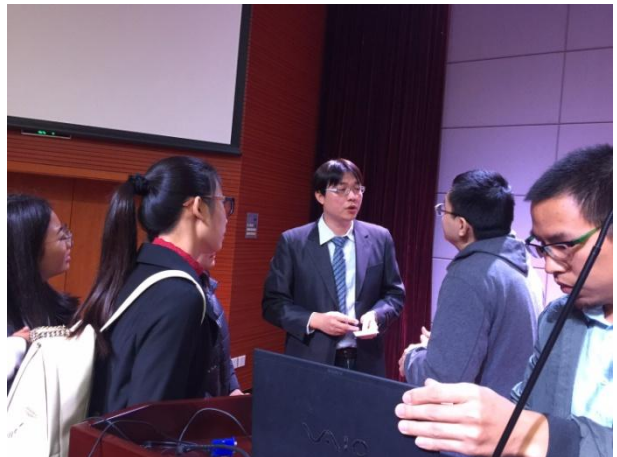
11/29 廈門大學海外教育學院學術研討會後討論熱烈欲罷不能