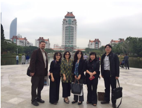
11/30 本團於廈門大學外文學院新建大樓前合影