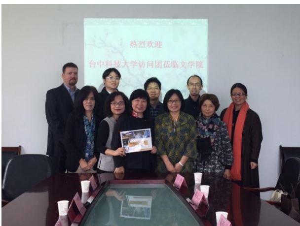
12/02 本團與福建師範大學文學院座談人員 合影