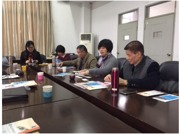
12/02 本團與福建師範大學外語文學系座談