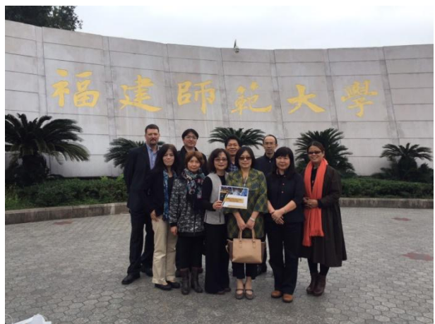
12/02 本團與福建師範大學文學院座談人員 於校門口合影