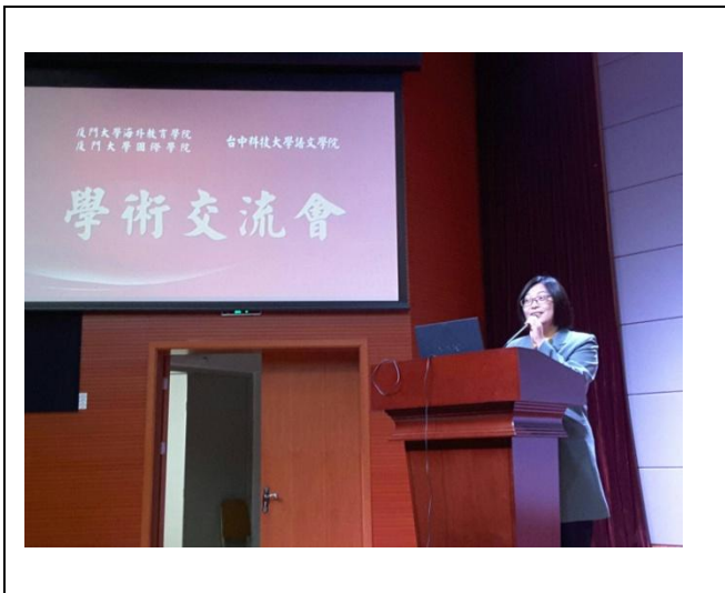
附錄1：11/29邱院長於廈門大學海外教育學院致詞、兩院報告內容大要