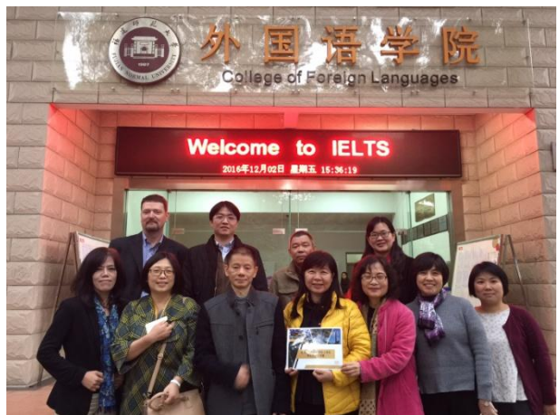
12/02 本團與福建師範大學外語文學院座談人員合影