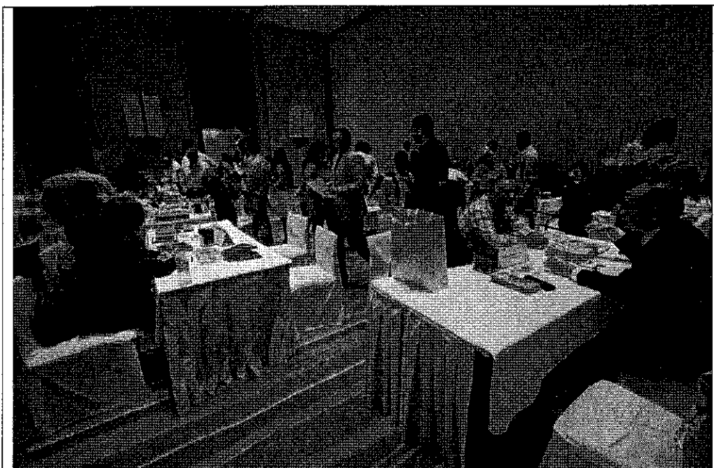
臺灣觀光推廣會-孟買辦理情形