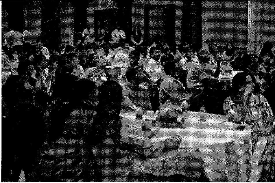
孟買業者踴躍出席臺灣觀光推廣會