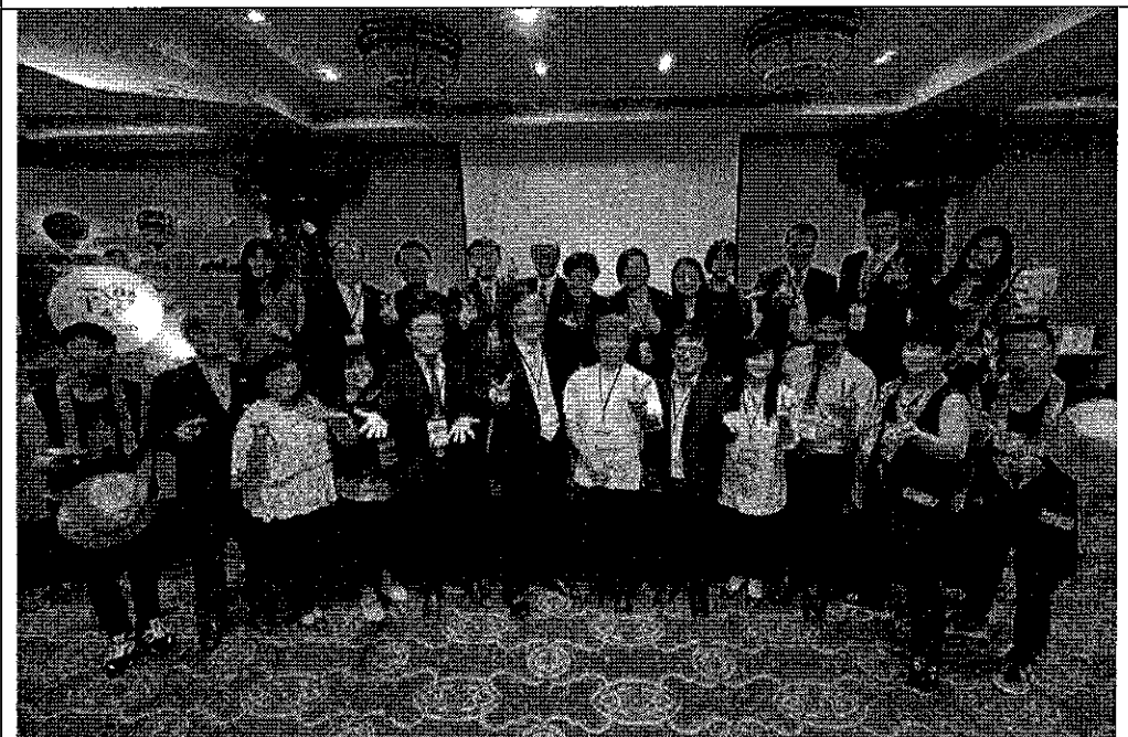
代表團暨表演團體合影