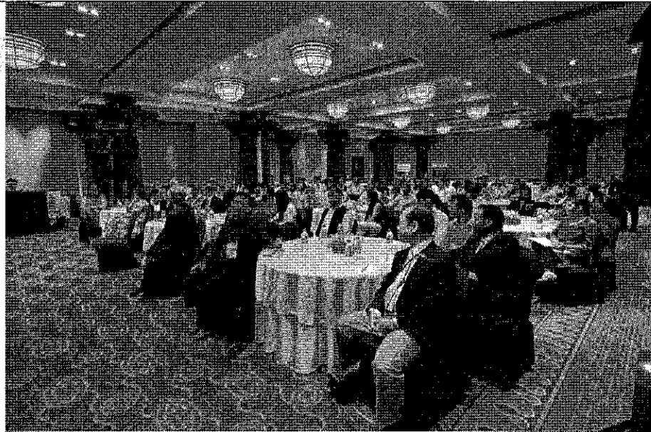
班加羅爾業者踴躍出席臺灣觀光推廣會