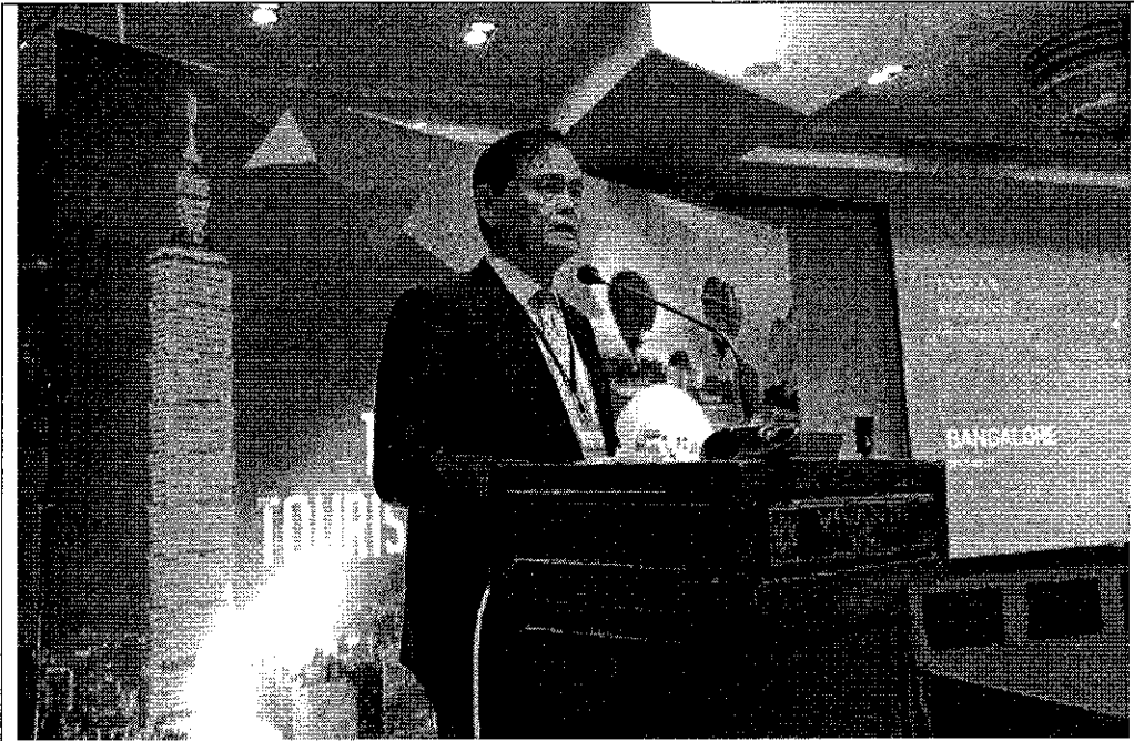
代表團之一介紹臺灣觀光內容