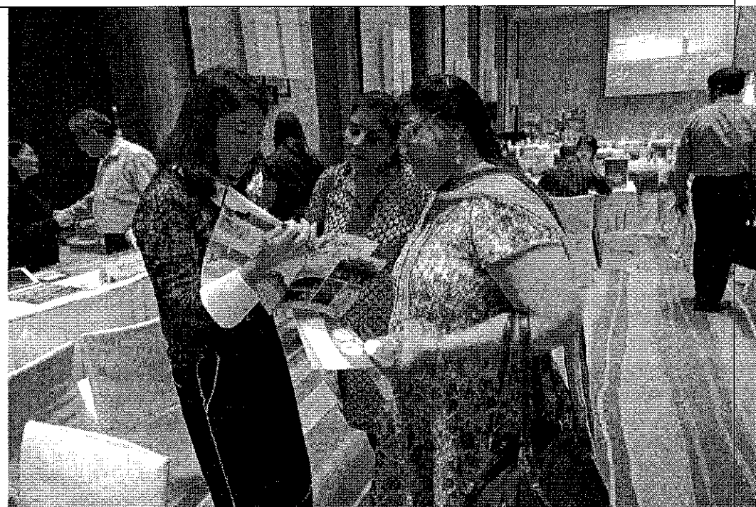
代表團之一及其印度代表向當地業者介紹該公司服務項目