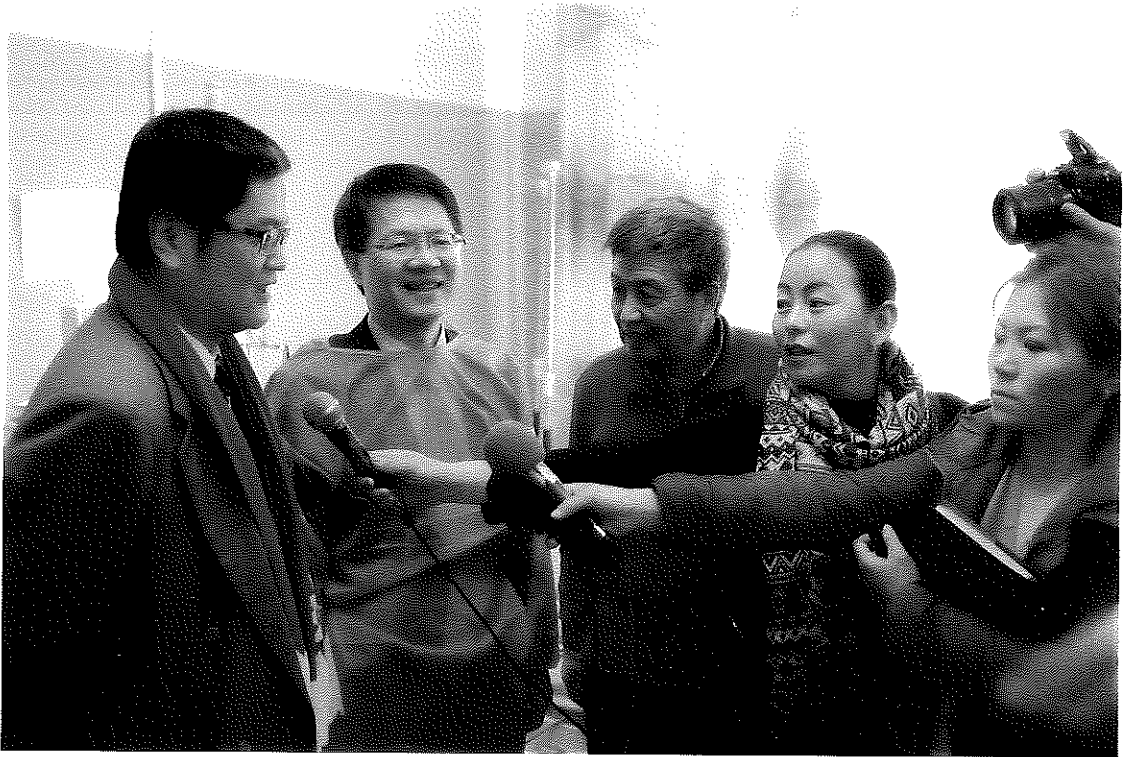
本會人員接受蒙古媒體訪問情形(於科布多省區域診斷及治療中心)