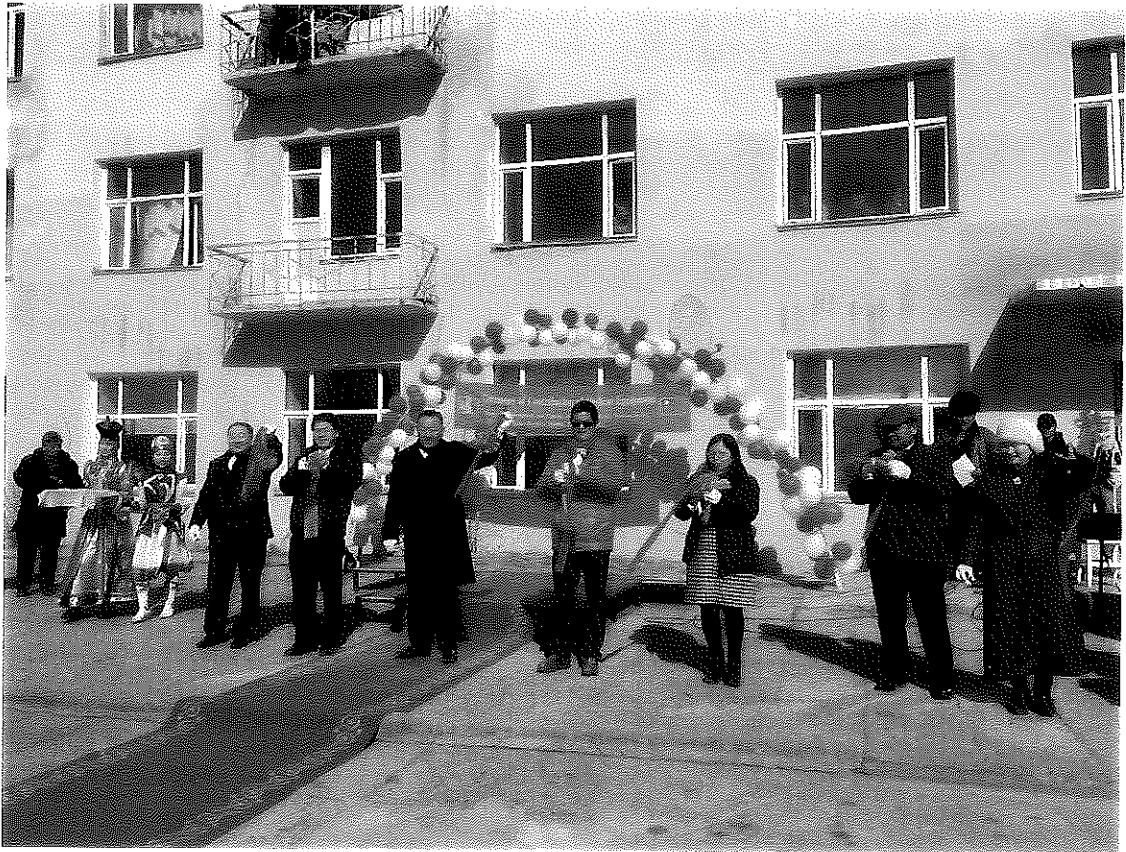
札布汗省省立醫院洗腎中心成立剪綵儀式