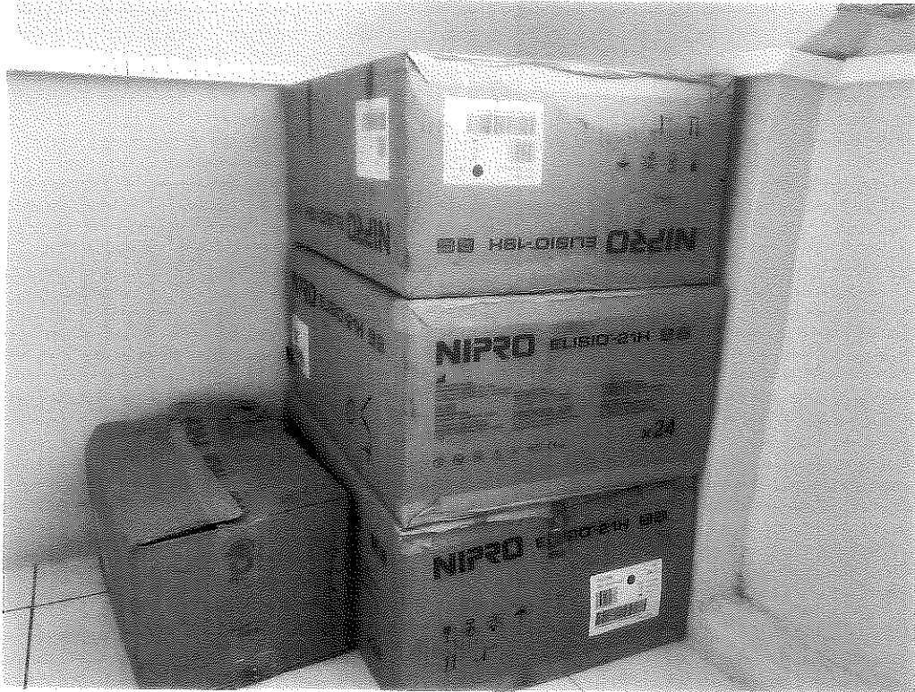
洗腎耗材裝箱情形