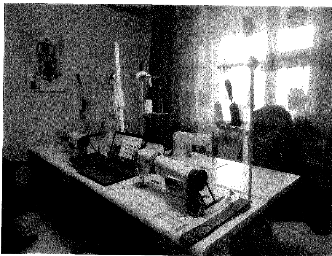
學員工作室現有設備