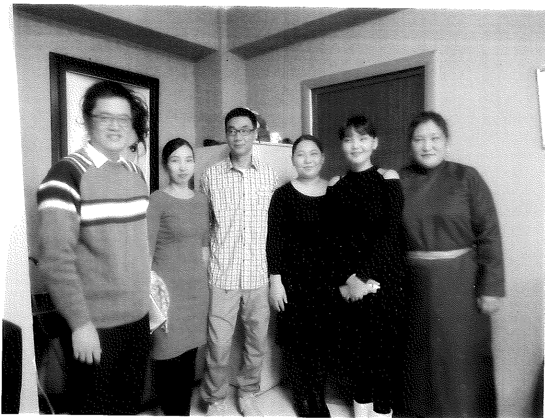
與第7期臺蒙職業訓練計畫一般縫紉班結業學員合影