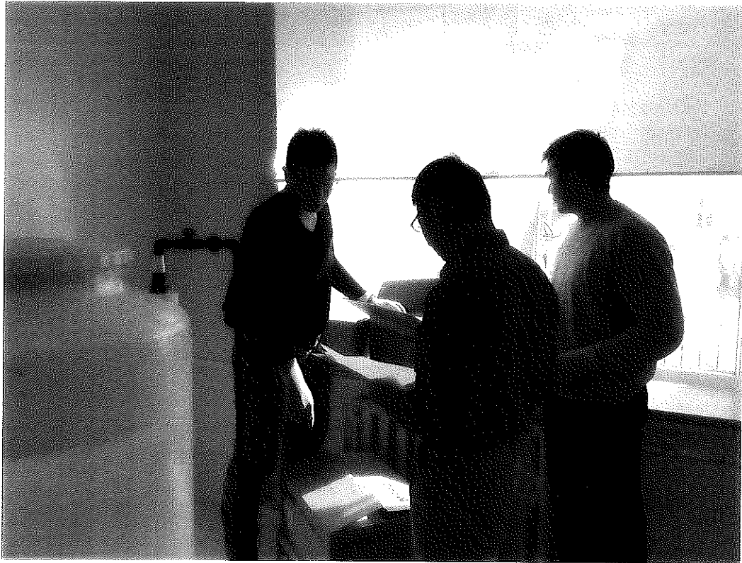
洗腎耗材拆箱驗收