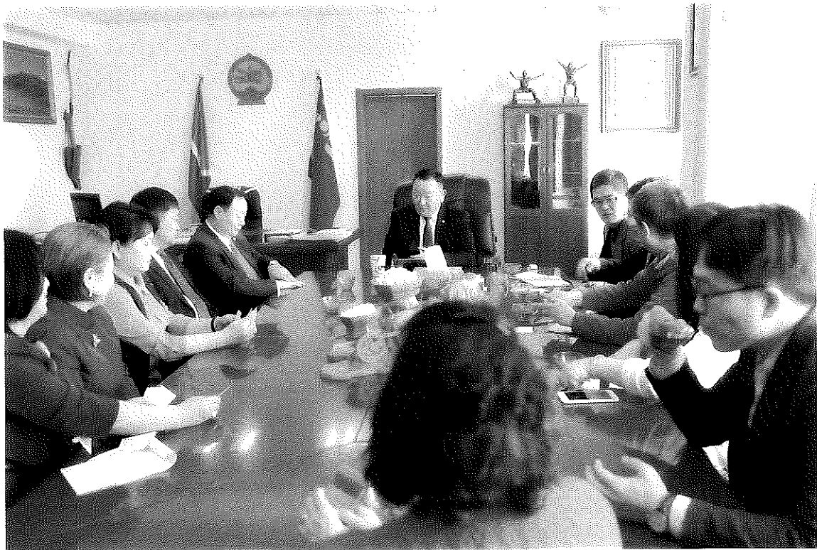
代表團成員與札布汗省省長Daimaa Batsaikhan會面情形