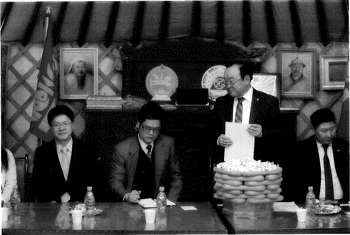
科布多省省長Damdin Galsandondog與代表團會面情形