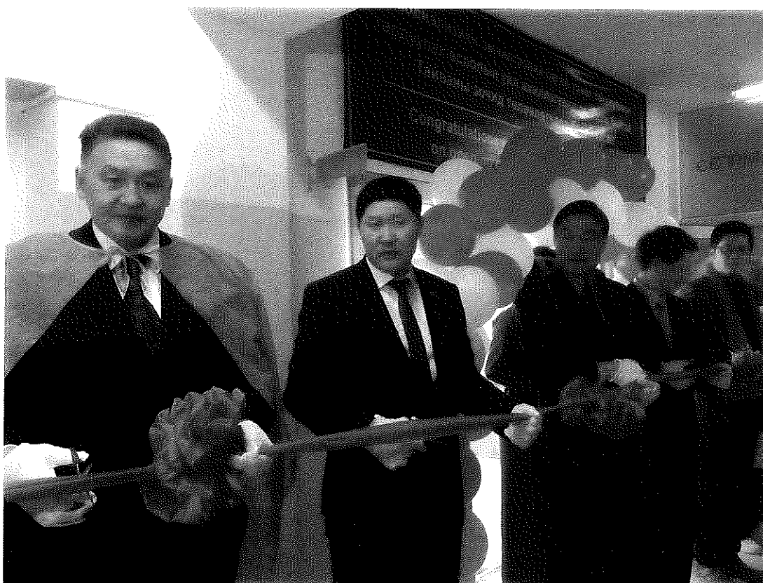
烏布蘇省省立醫院洗腎中心剪綵儀式