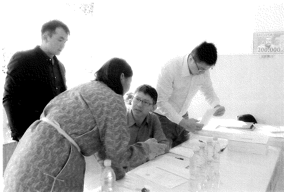
相關文件交付驗收情形