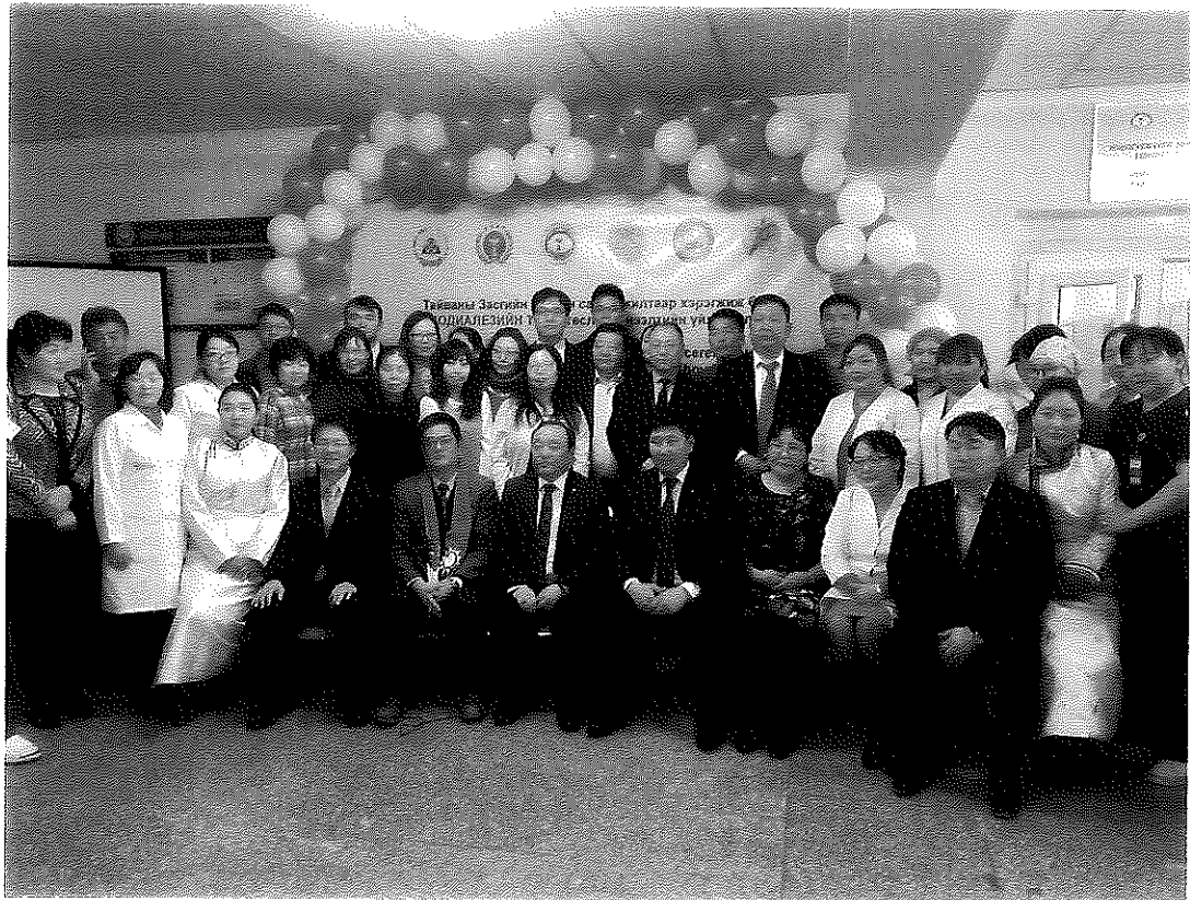
代表團成員與相關人員合影(於科布多省區域診斷及治療中心)