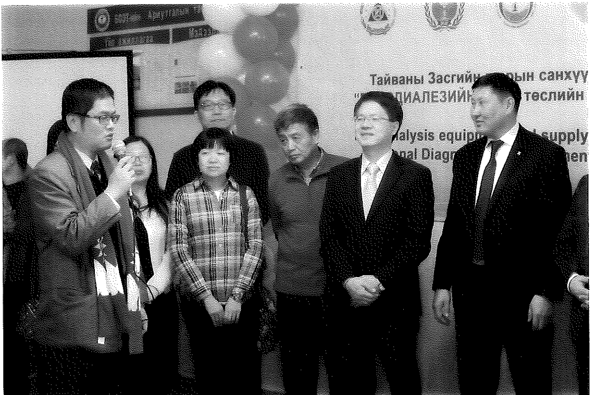
本會人員致詞情形(於科布多省區域診斷及治療中心舉辦洗腎中心剪綵儀式)