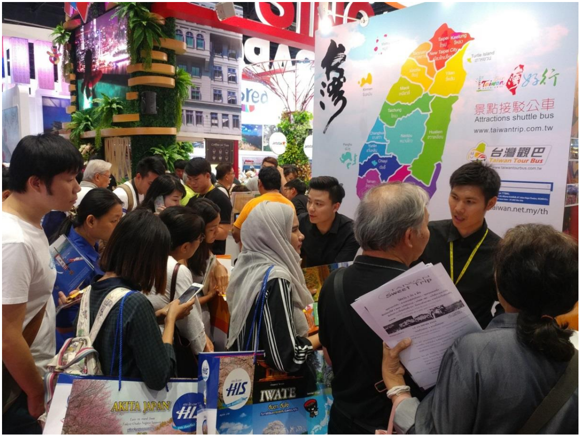
泰國免簽來臺口碑發酵，臺灣館詢問度高