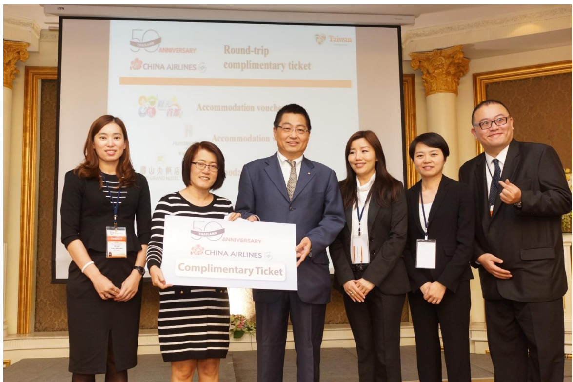
由航空公司及臺灣代表團員贊助之臺灣旅遊套裝禮品現場抽獎