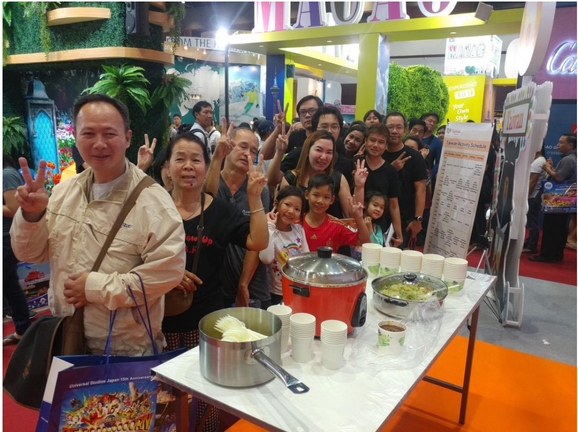
現場製作美食，讓泰國民眾體驗道地臺灣風味