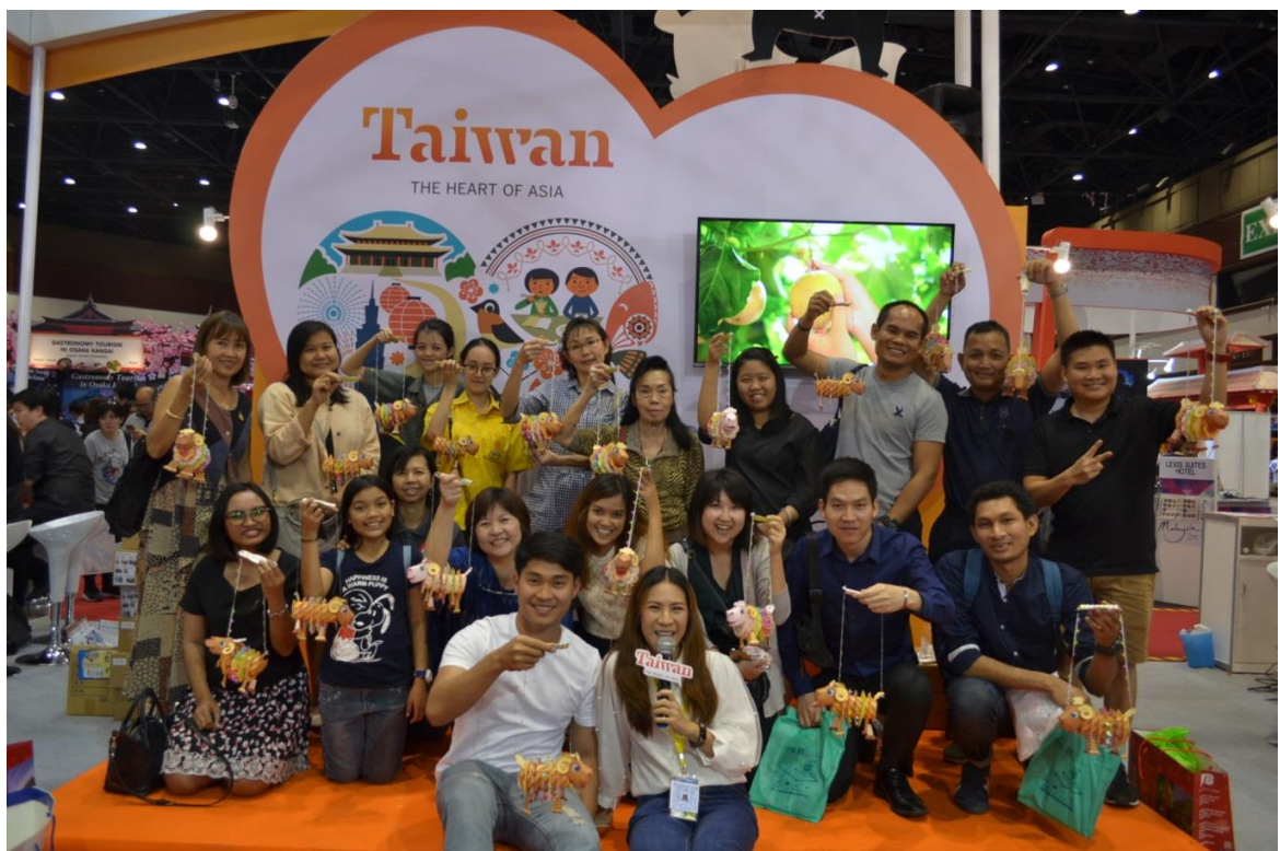
小提燈 DIY 活動吸引參觀民眾熱烈參與