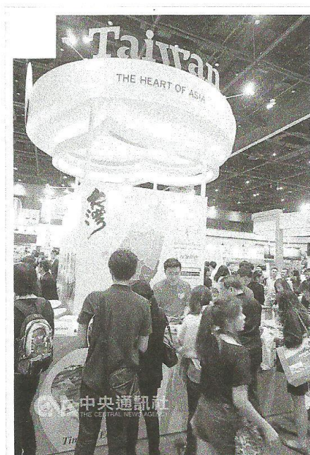
泰國春季國際旅遊展15日在曼谷詩麗吉展覽中心開幕，台灣館位於入口處，吸引人潮駐足，現場有鳳梨酥和最新旅遊行程資訊，還有美甲彩繪和表演。 106年2月15日

(中央社記者劉得倉曼谷15日專電)泰國春季國際旅遊展今天在曼谷詩麗吉展覽中心開幕，台灣館推出美甲彩繪和特技表演，以及鳳梨酥和最新的台灣旅遊行程；旅行業者的產品中，台灣行程熱賣。