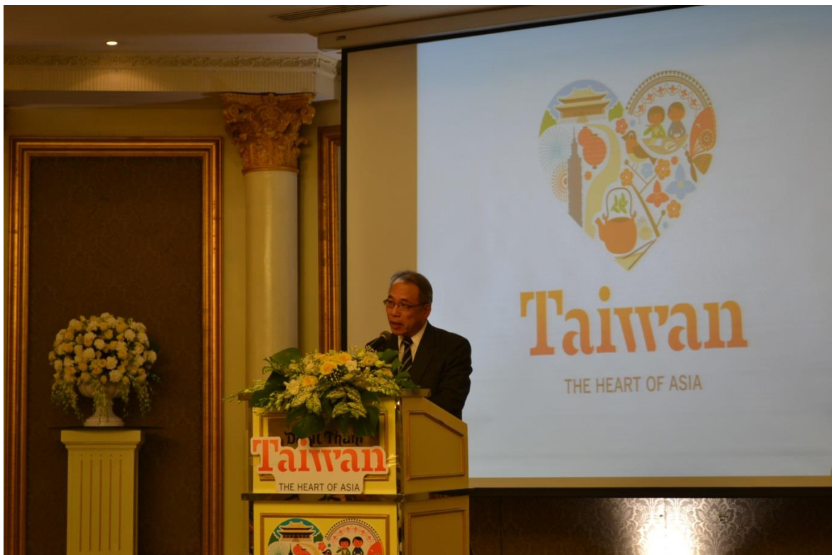
駐泰國經濟文化辦事處石公使柏士致詞