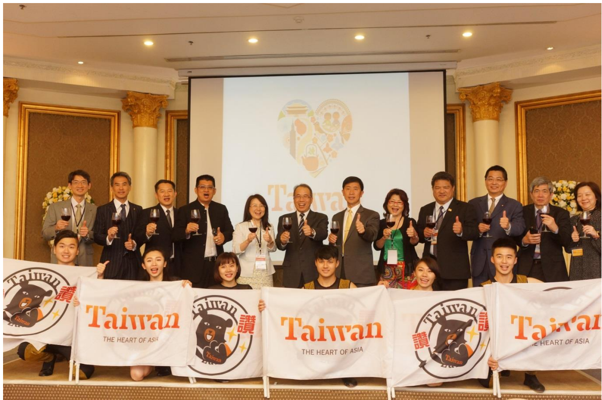
與會貴賓一同舉杯合影