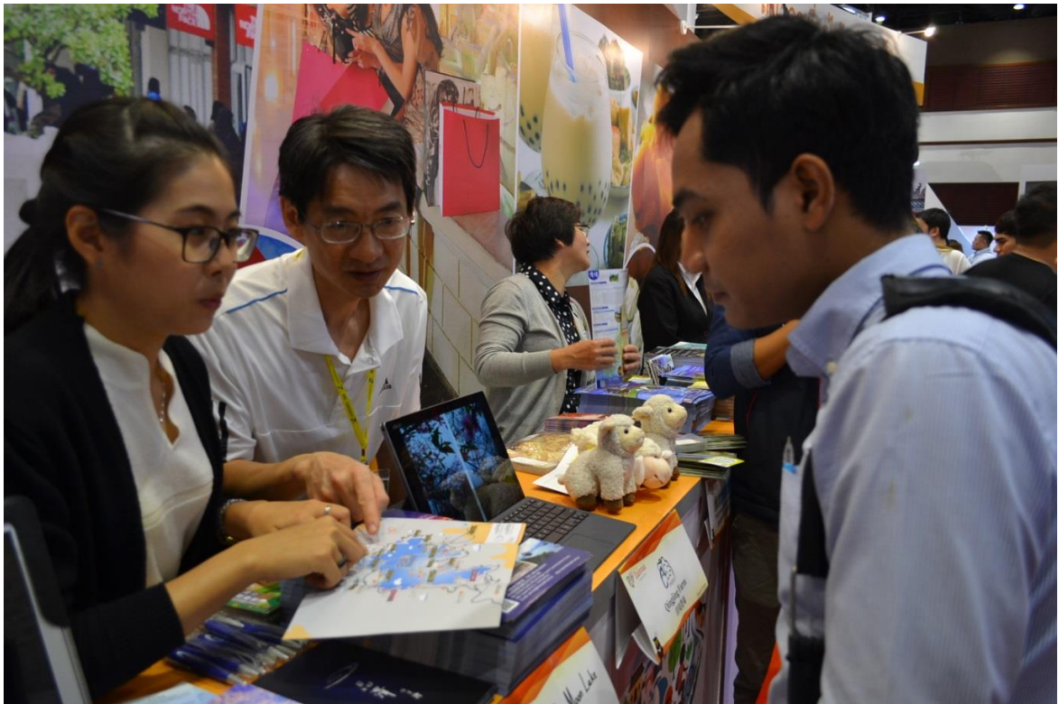
台灣代表團成員細心解說