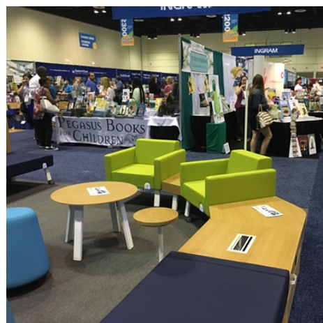
各式圖書館傢俱展示