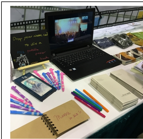
抽獎活動及訪客留言本