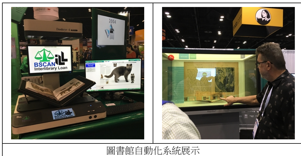
圖書館自動化系統展示