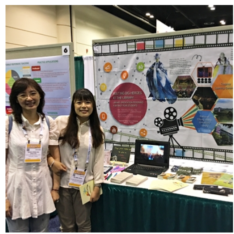
於海報攤位前紀念合影