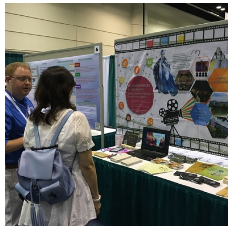
跟 ALA 採訪記者解說海報