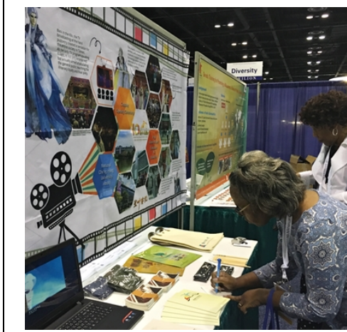
參觀者在留言本留下評語