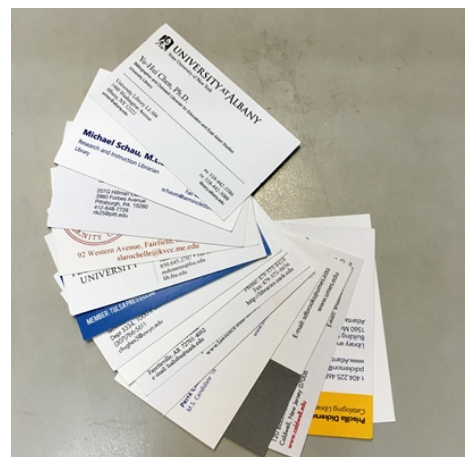
參與抽獎活動的名片