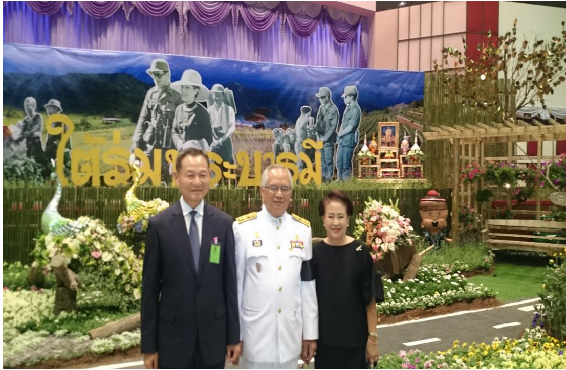
李主任委員與清邁大學校長伉儷於皇家計畫基金會農業成果博覽會場內合影