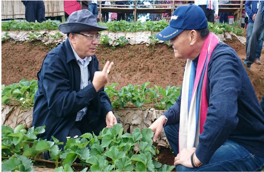
李主任委員聽取泰方草莓專家說明新品種草莓摘種情形