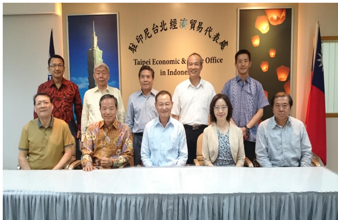
李主任委員由印尼榮光會主要幹部陪同拜會駐印尼代表處陳忠大使合影， 並聽取台商有關政府推動新南向政策相關建言及意見