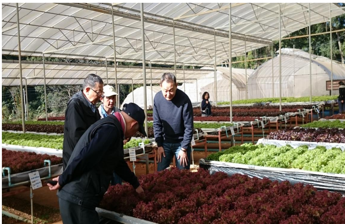
李主任委員聽取安康農場說明溫室蔬菜栽種情形