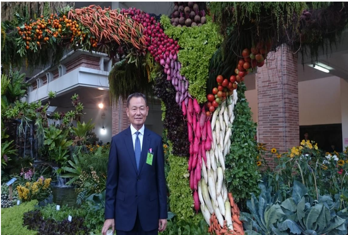
皇家計畫基金會農業成果博覽會場農產品精緻裝置藝術