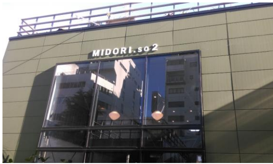
緑莊 2 號