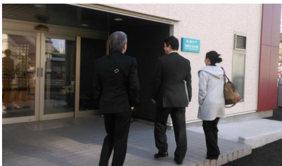
參觀國際交流會館(留學生宿舍)