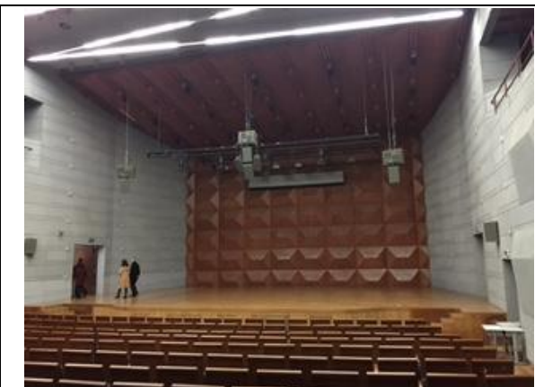
星海音樂學院音樂廳之小音樂廳