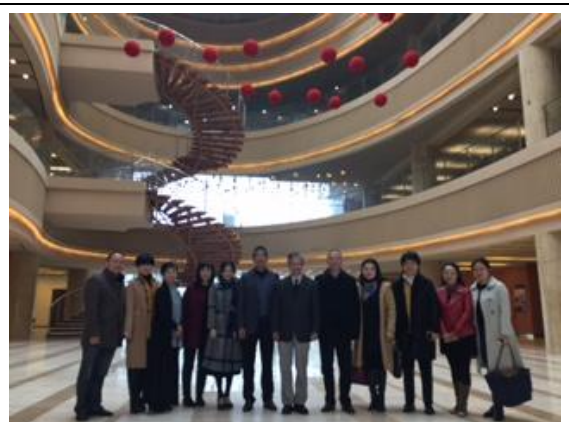
星海音樂學院之音樂廳內合影