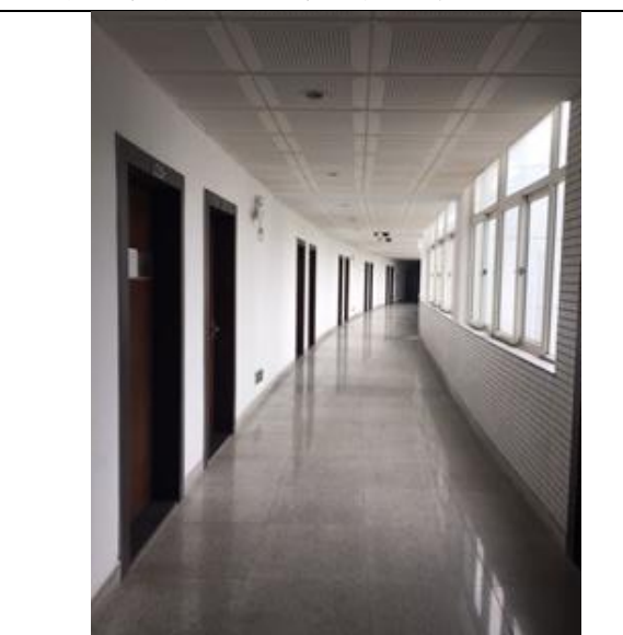
星海音樂學院琴房大樓內部