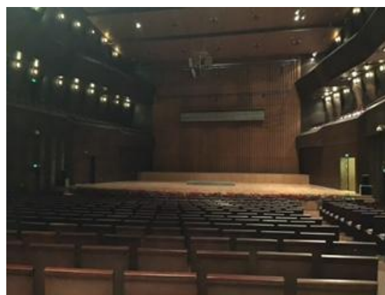
星海音樂學院音樂廳之大音樂廳