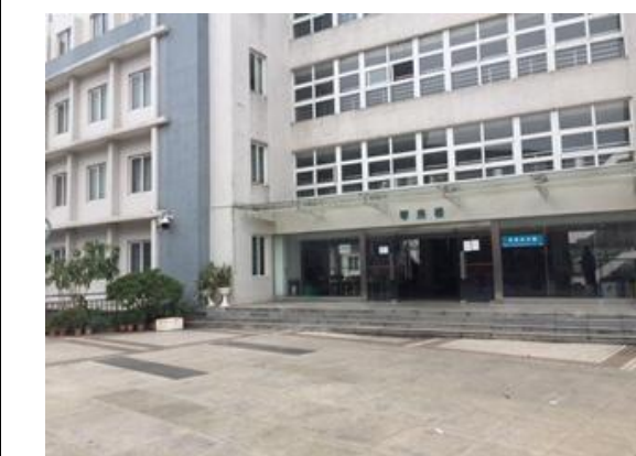
星海音樂學院琴房大樓之外觀