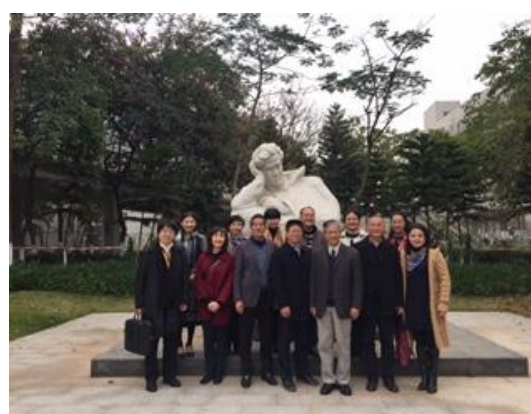
兩校代表人員於星海音樂學院之地標廣州音樂家冼星海人像前合影