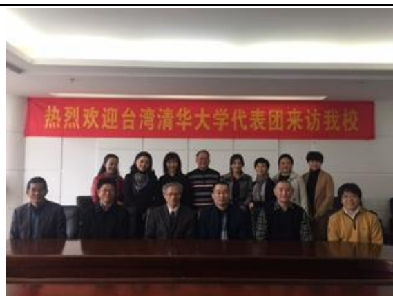
兩校會談人員合影