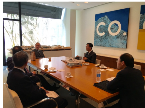
Tinterow 館長特別介紹本院林院長該館的擴建計劃。