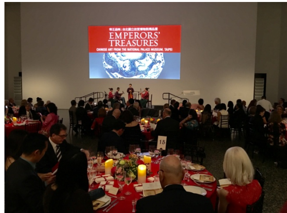
休士頓博物館 The Caroline Wiess Law 展覽館的 Cullinan 大廳舉行，席開二十桌。