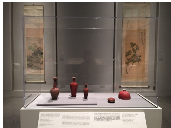
「帝王的品位」特展在新展覽館（The Audrey Jones Breck）展出。