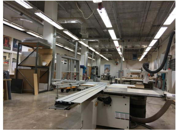
面積寬廣的布展工程作業專區。