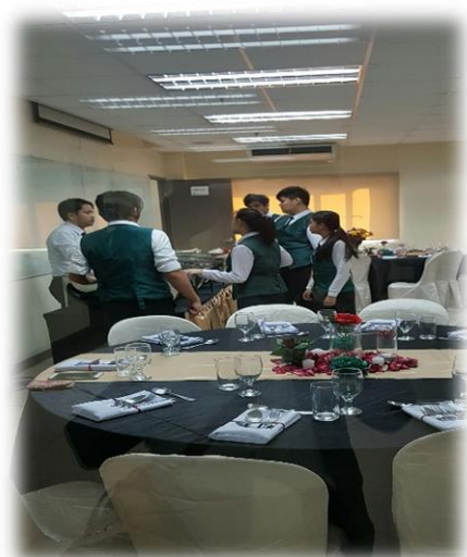
參觀 FEU 實習餐廳