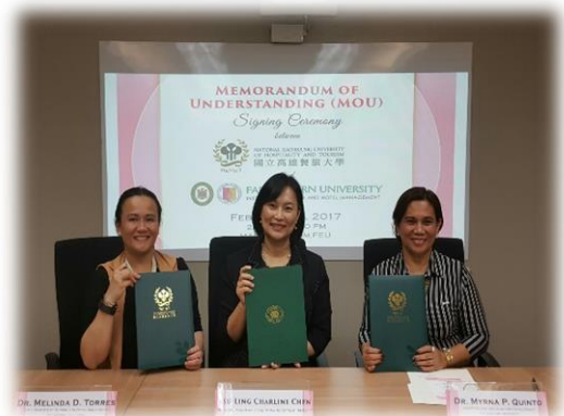
與 FEU 簽署合作備忘錄