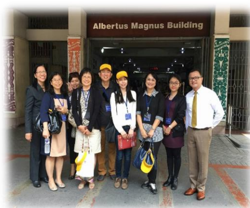
參訪 UST 廚藝教室