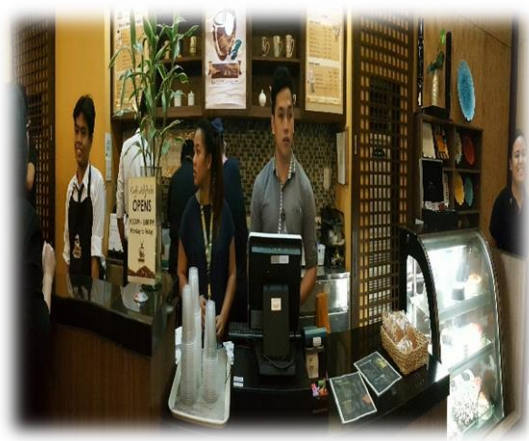
參觀 FEU 實習咖啡廳