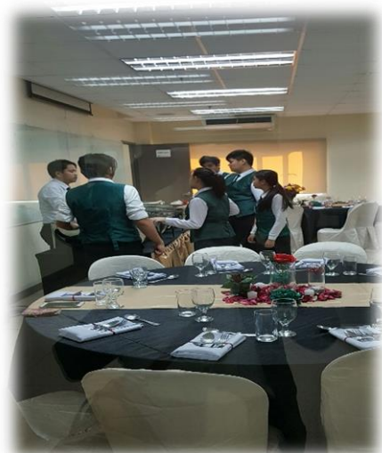
參觀 FEU 實習餐廳