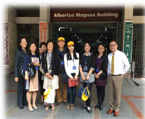
參訪 UST 廚藝教室