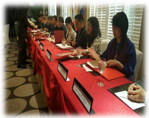
LPU 合作備忘錄簽約儀式