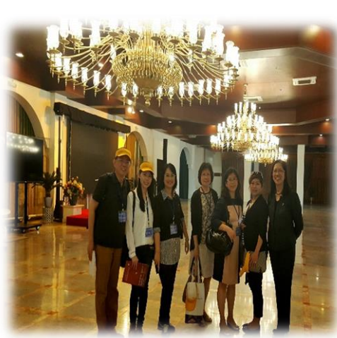
參觀 UST 實習宴會廳