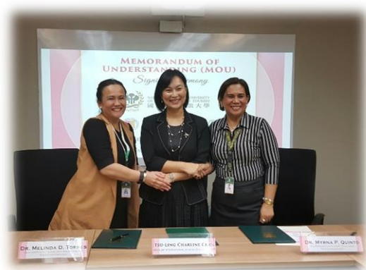
與 FEU 簽署合作備忘錄