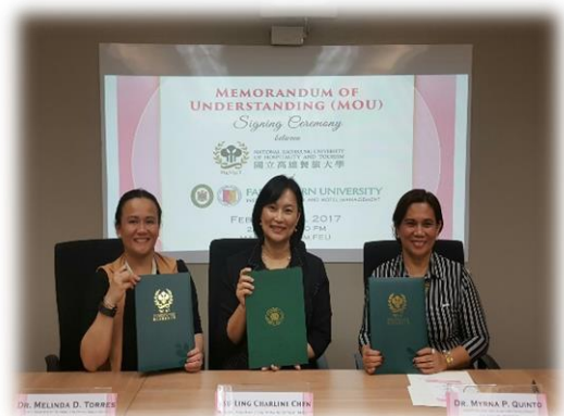
與 FEU 簽署合作備忘錄