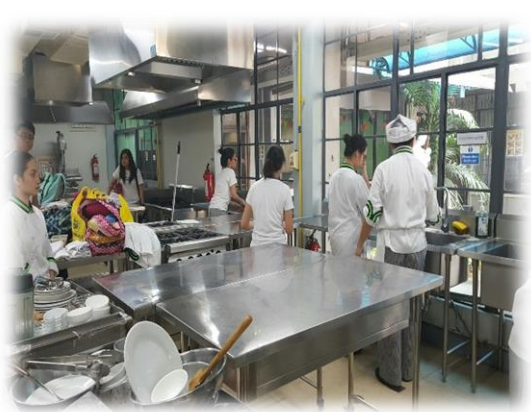
參訪 UST 廚藝教室