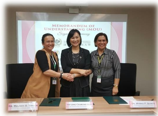
與 FEU 簽署合作備忘錄