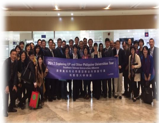
南台灣大學聯盟成員