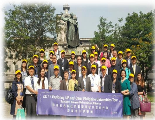
南台灣大學聯盟成員