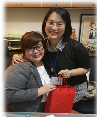
與 UST 觀光學院院長合影