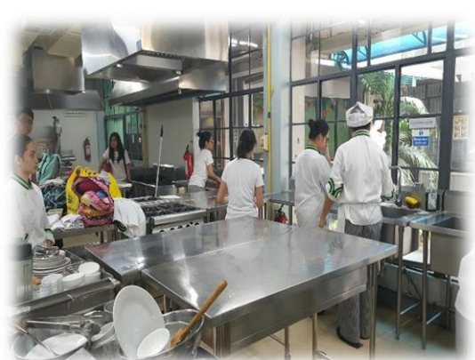
參訪 UST 廚藝教室